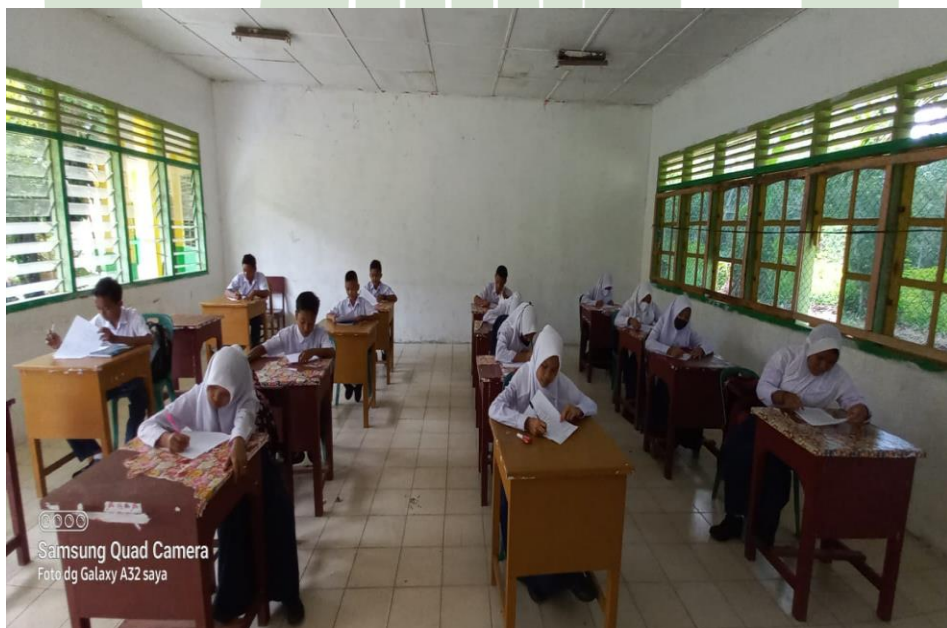
Pemberian Angket Kepada Siswa