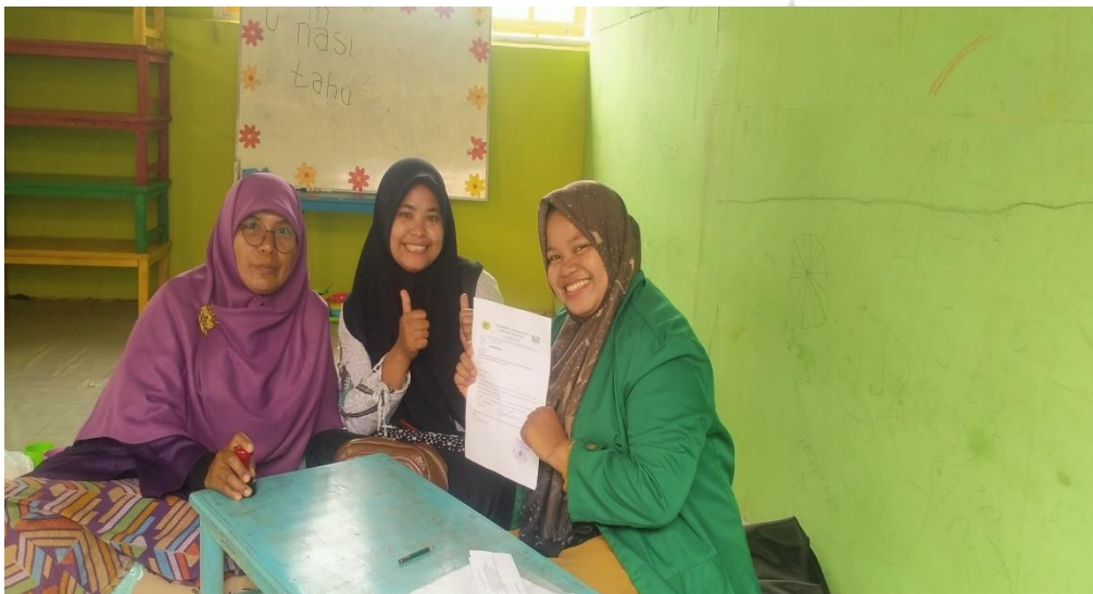
Poto bersama Kepala sekolah dan Guru kelas