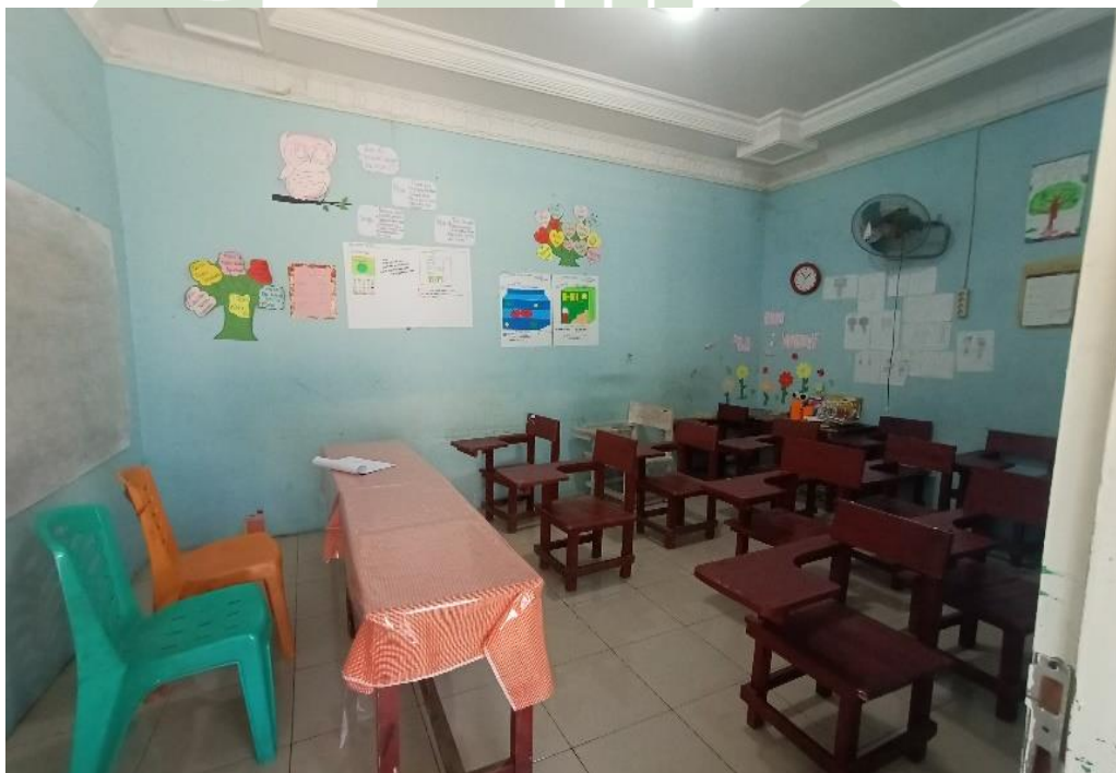
3.8 RUANG KELAS MTs HIDAYATUSSALAM