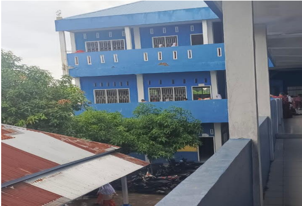
3.3 LANTAI II MTs Hidayatussalam