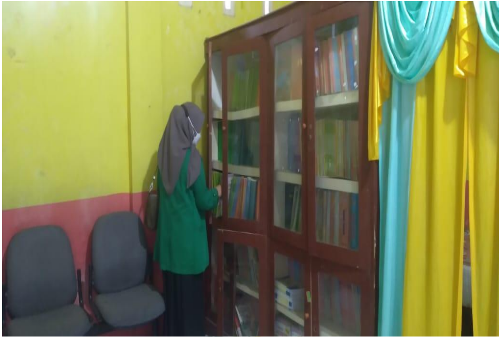
3.7 RUANG PEPRUSTAKAAN MTs HIDAYATUSSALAM