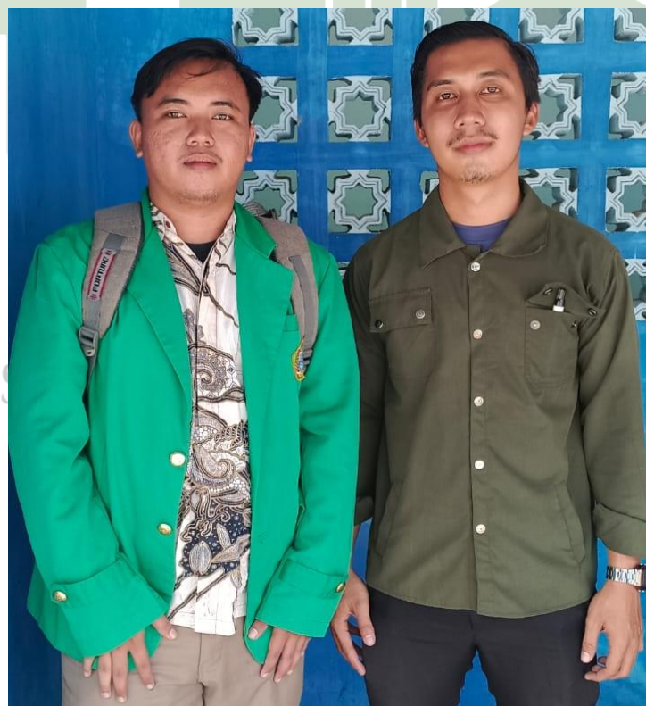
2.4 WAWANCARA GURU II