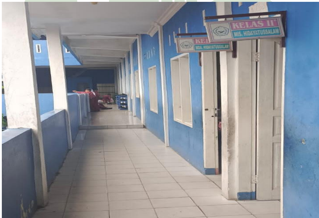
3.4 KELAS MTs Hidayatussalam