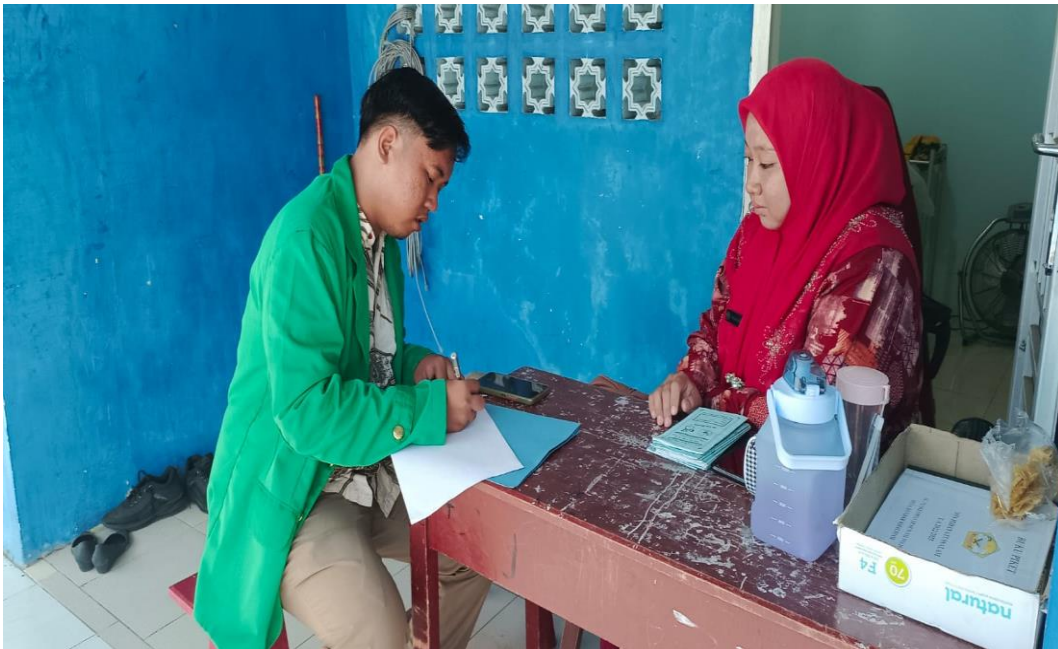
2.3 WAWANCARA GURU I