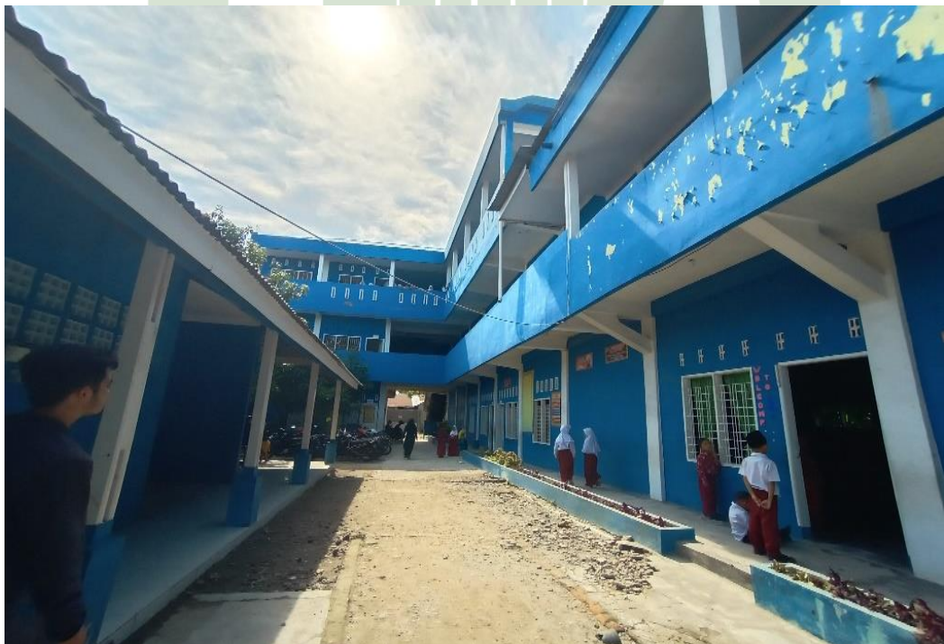
3.2 HALAMAN MTs HIDAYATUSSALAM