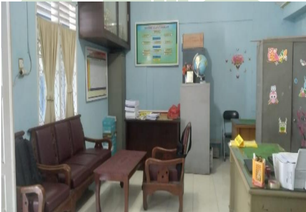
3.6 RUANG KEPALA MADRASAH MTs HIDAYATUSSALAM