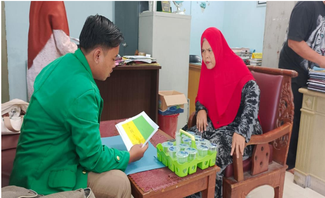
2.1 WAWANCARA WAKIL KEPALA MADRASAH