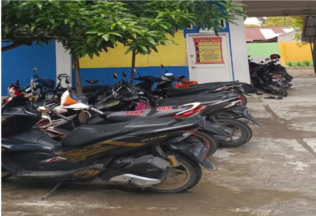
3.5 HALAMAN PARKIR MTs HIDAYATUSSALAM