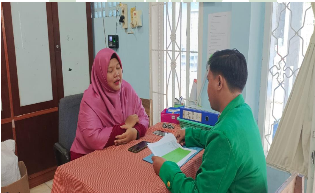
2.2 WAWANCARA KEPALA MADRASAH