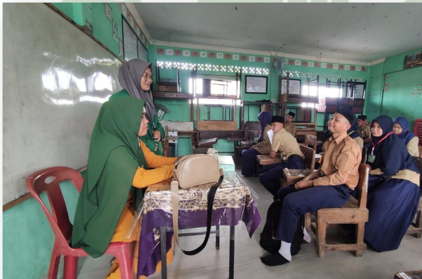
Meeting with English Teacher of Madrasah Aliyah Muhammadiyah Sei Apung Jaya