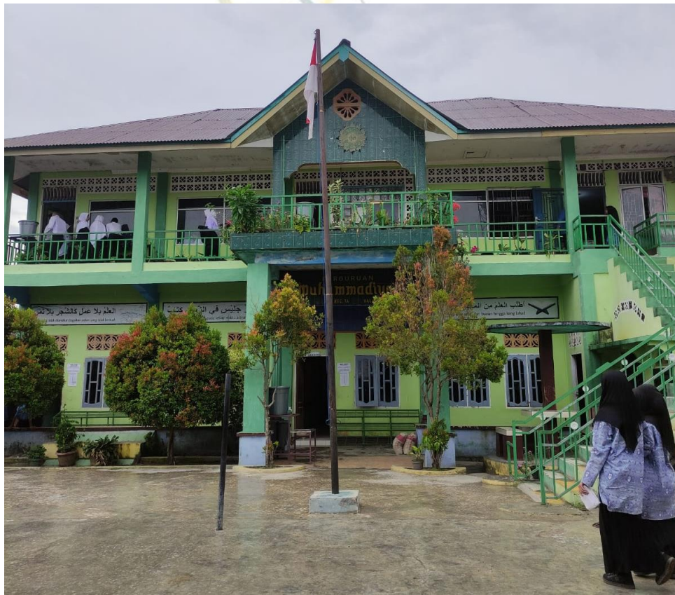
Madrasah Aliyah Muhammadiyah Sei Apung Jaya