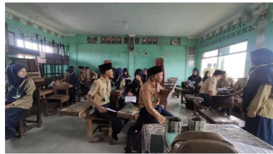
Observation Day 1 (June 31 th )