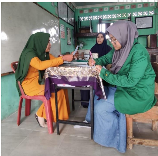
Interview Session Day 3 (May 2 nd )