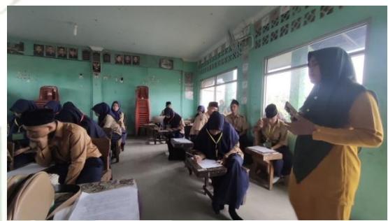
Observation Day 2 (May 1 st )