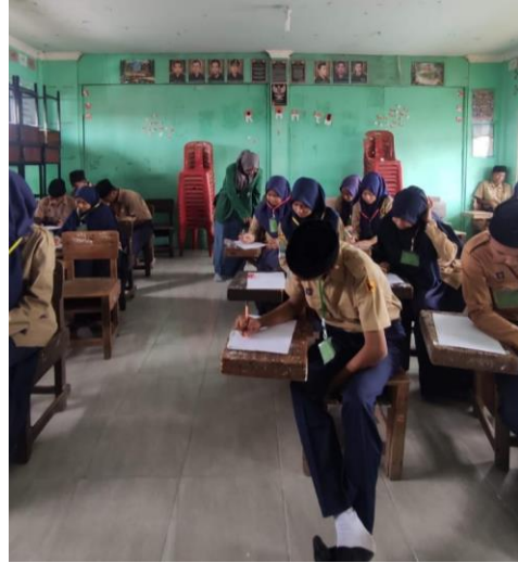
Observation Day 4 (May 3 rd )