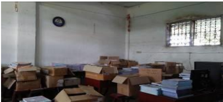
4. Perpustakaan MTs Al Washliyah Ismailiyah Medan