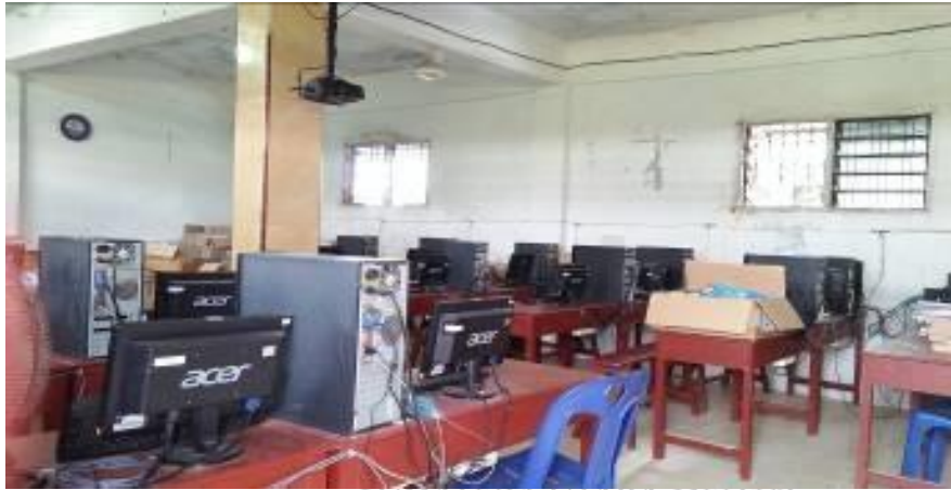
3. Lab. Komputer MTs Al Washliyah Ismailiyah Medan