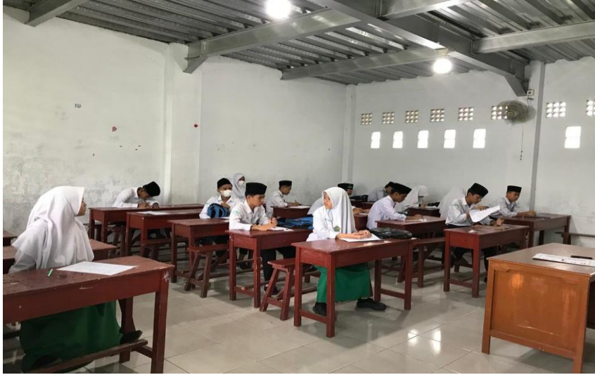
11. Kegiatan Ujian Madrasah