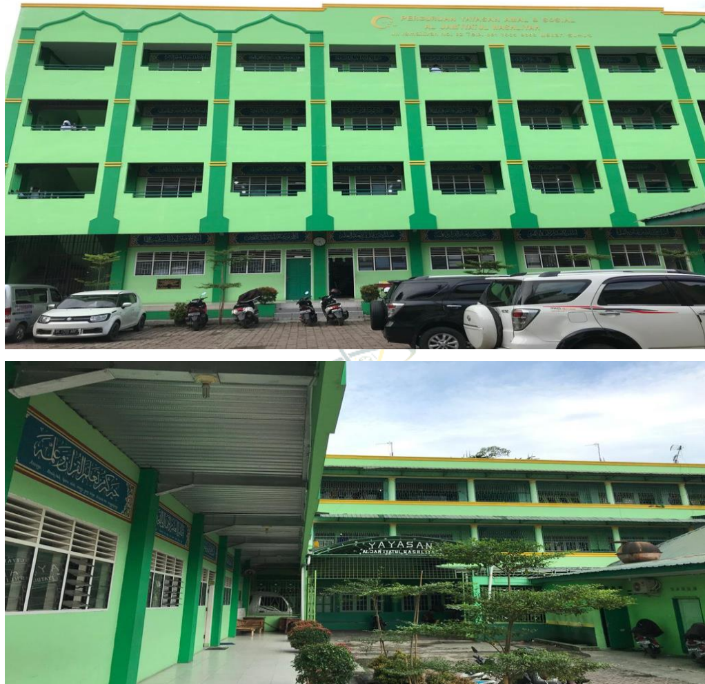
1. MTs Al Washliyah Ismailiyah Medan