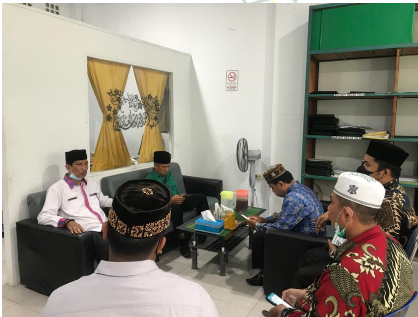
10. Rapat Kepala Madrasah dan Guru sebelum melaksanakan Ujian Madrasah