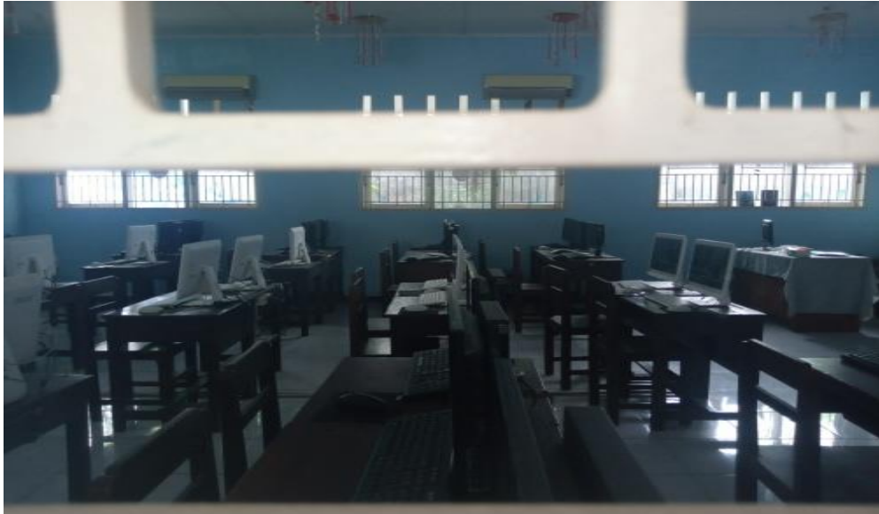
KOMPUTER SMP IT NURUL ILMI MEDAN