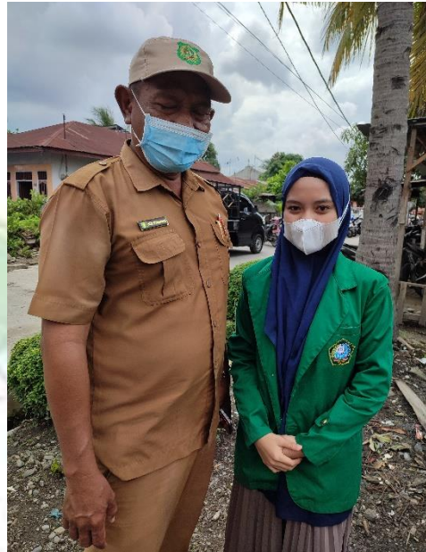
Kepala Lingkungan VI di Kelurahan Mabar, pada Tanggal 10 Januari 2022.