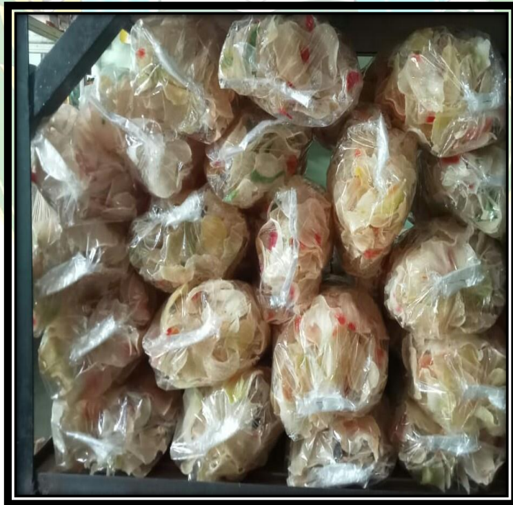
Pengemasan/Hasil Kemas Kerupuk Ubi