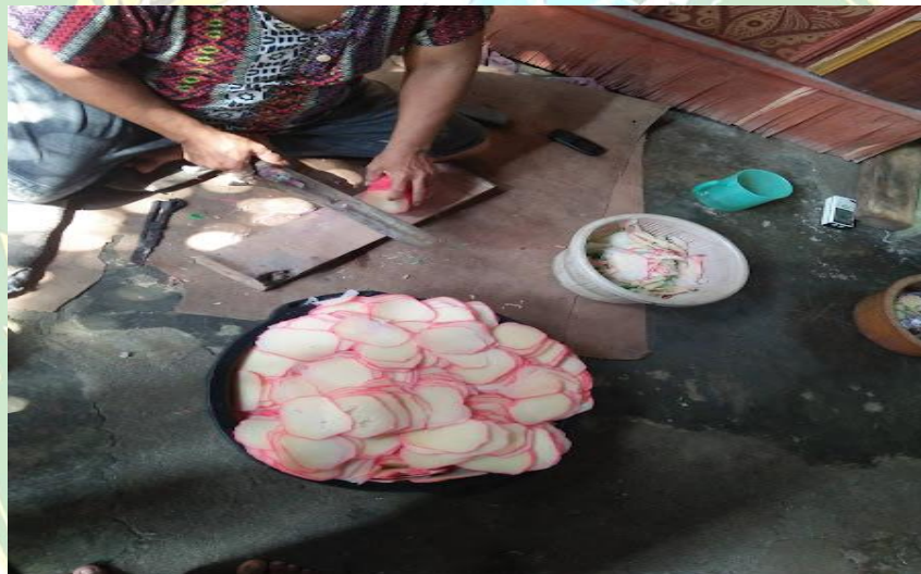
Proses Pemoongan Kerupuk Ubi