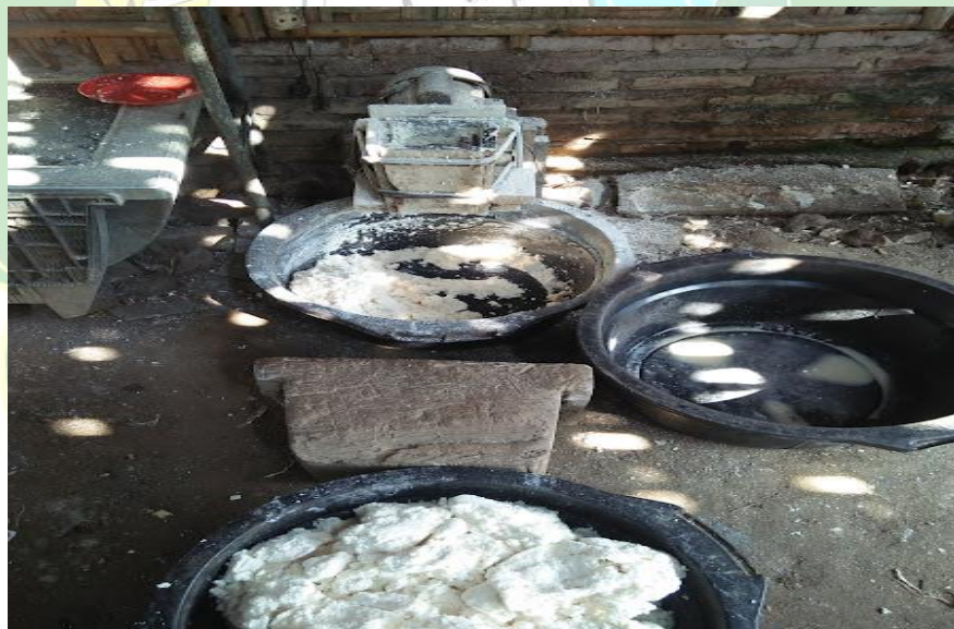
Hasil Dari Penggilingan/Pemarutan Ubi Kayu