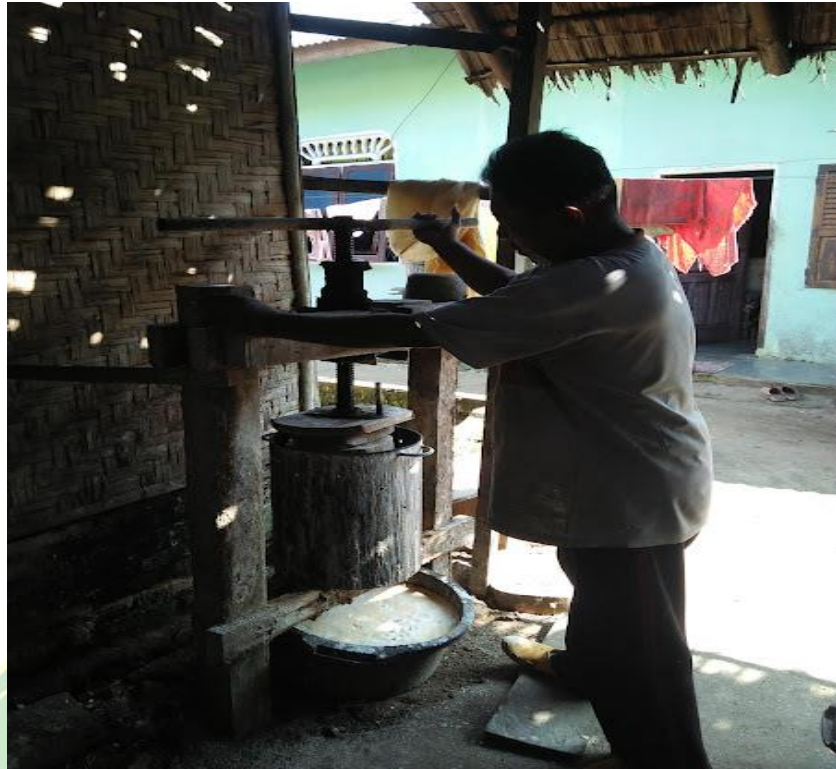
Pengepresan ubi yang diparut dibuang pati ubi nya