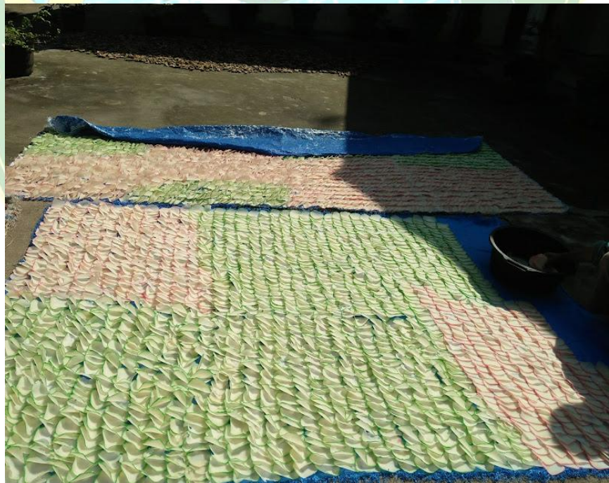
Penejuran kerupuk ubi