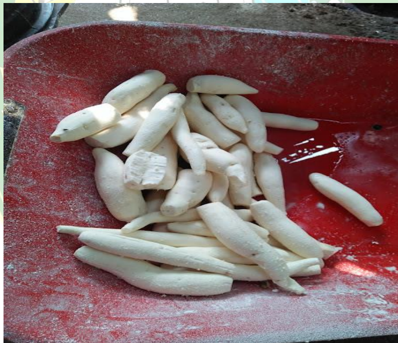
Bahan Baku Kerupuk Ubi Yaitu Ubi Kayu