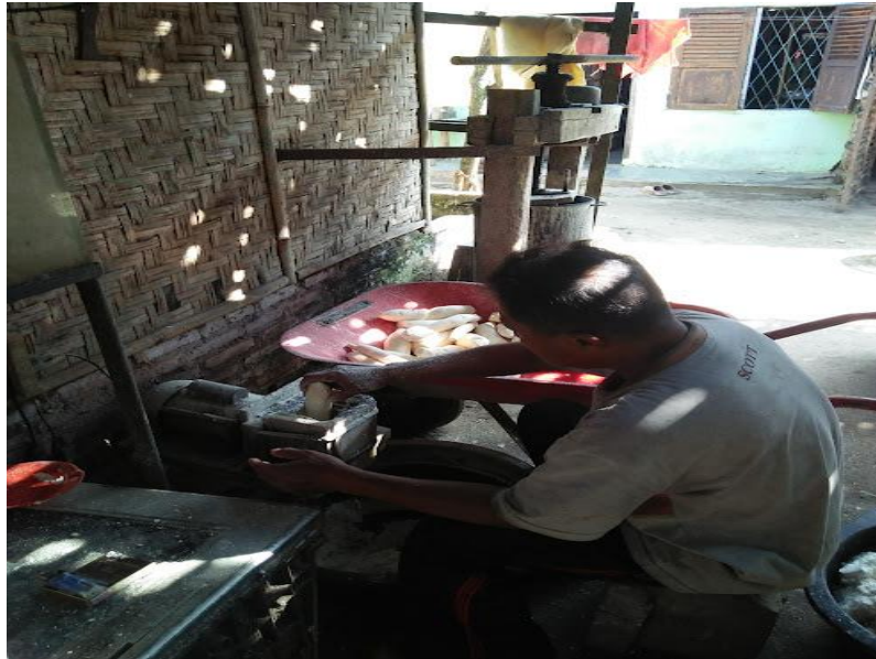
Penggilingan/Memarut Ubi Kayu Bahan Baku Kerupuk Ubi