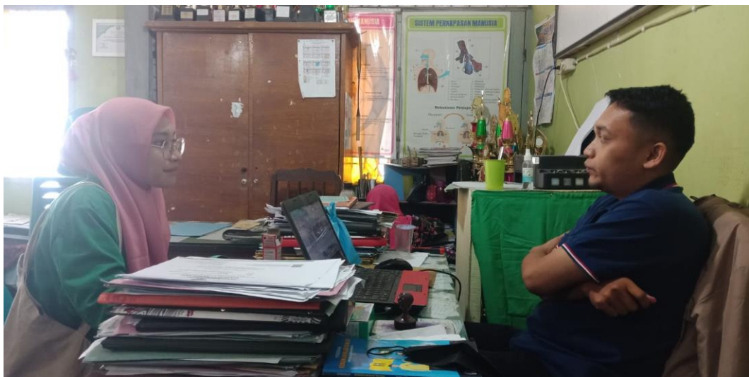
Wawancara Dengan Guru Kemuhammadiyahan