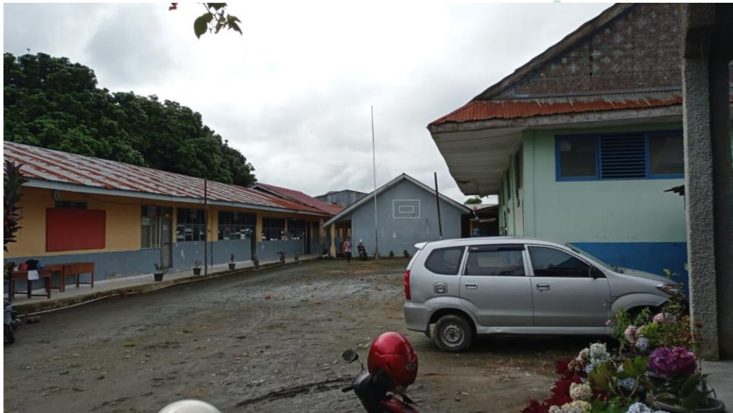
Halaman dan Ruang Kelas