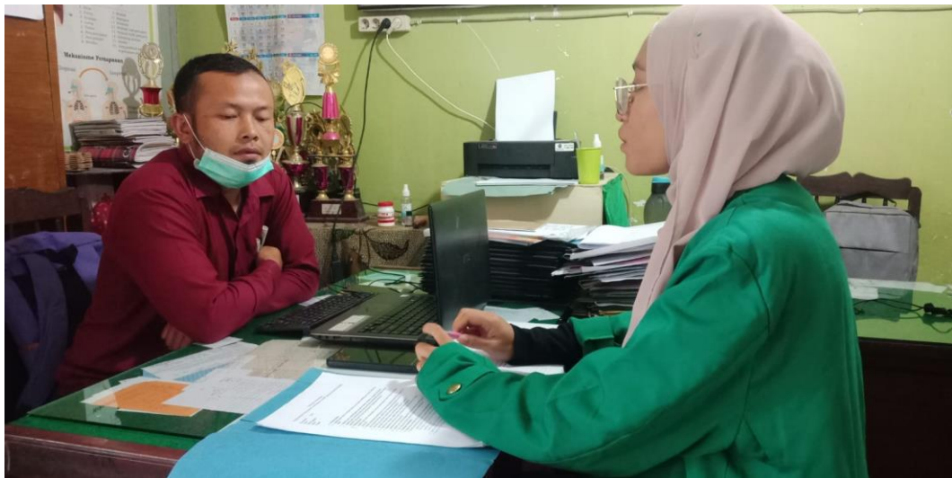
Wawancara Dengan Guru Bidang Studi Ilmu Pengatahuan Alam