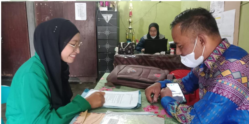
Wawancara Dengan Wakil Kepala Sekolah