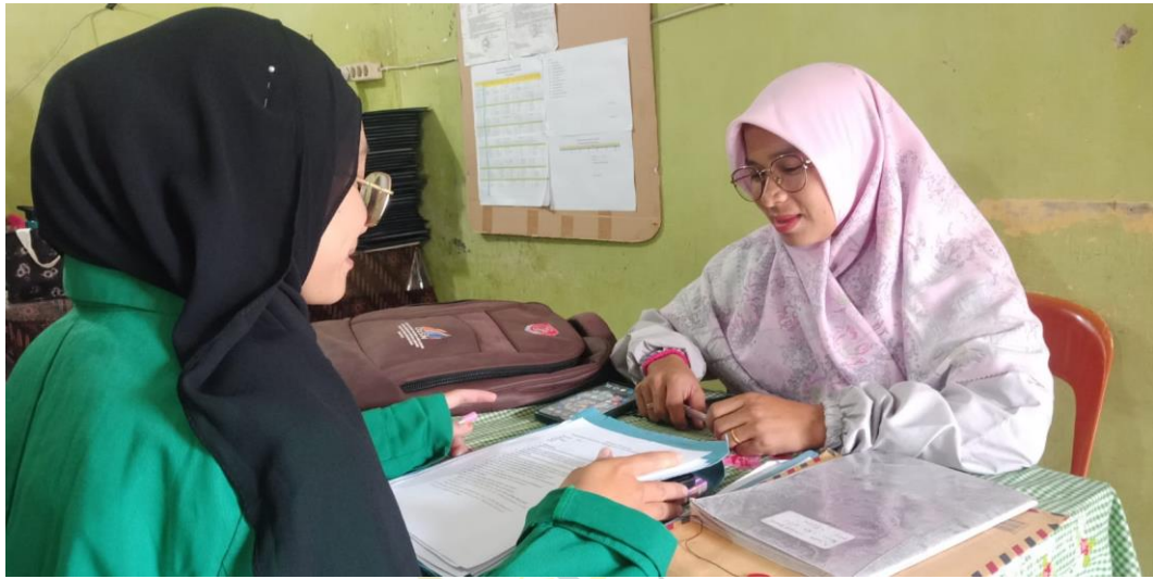
Wawancara Dengan Guru Bidang Study Bahasa Indonesia