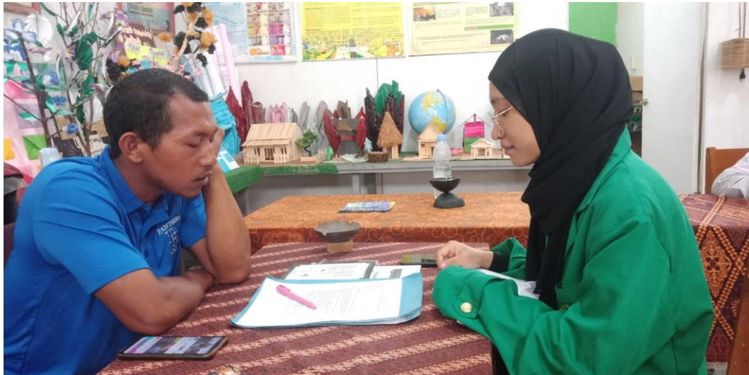
Wawancara Dengan Guru Bidang Studi Olahraga