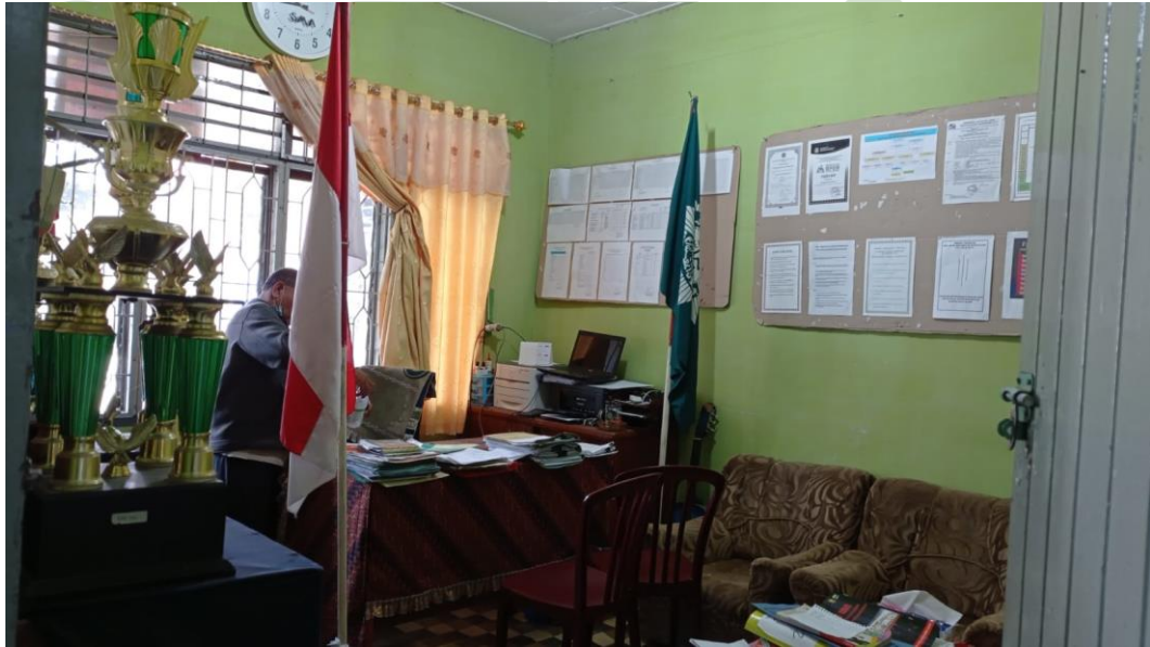
Ruang Kepala Sekolah