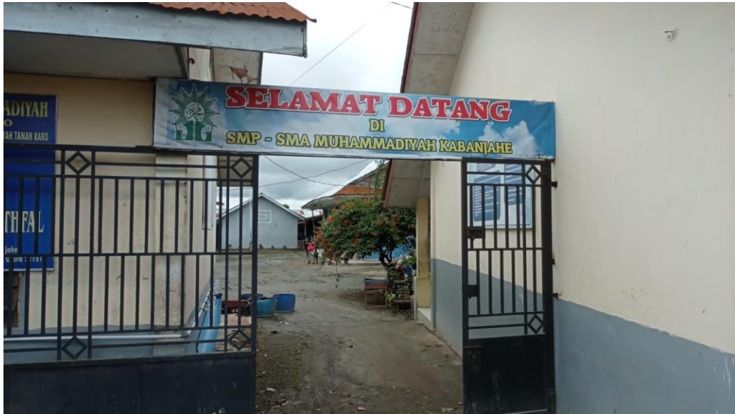
Tampak Depan Pagar Pintu Masuk Sekolah