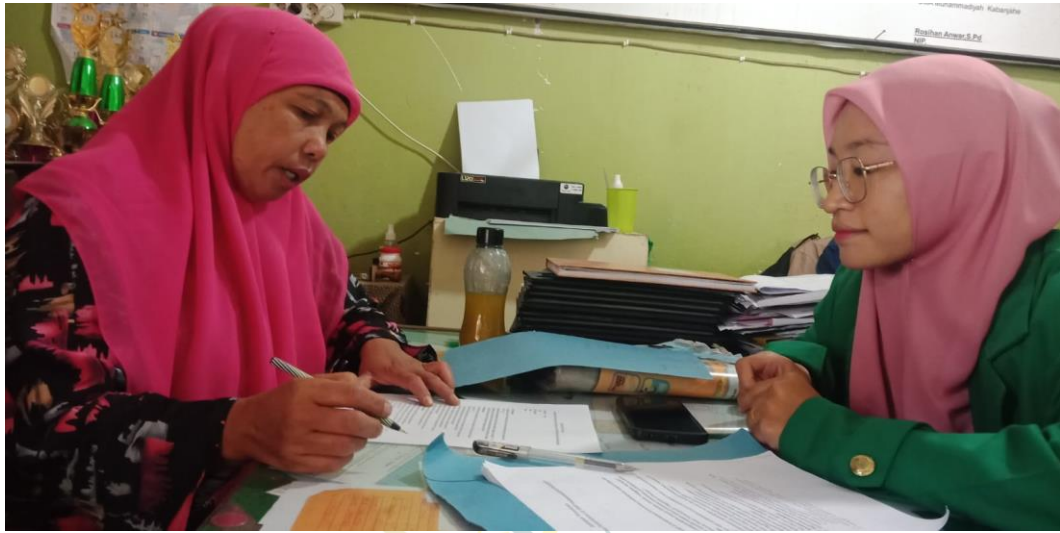
Wawancara Dengan Guru Bidang Studi Ilmu Pengetahuan Sosial