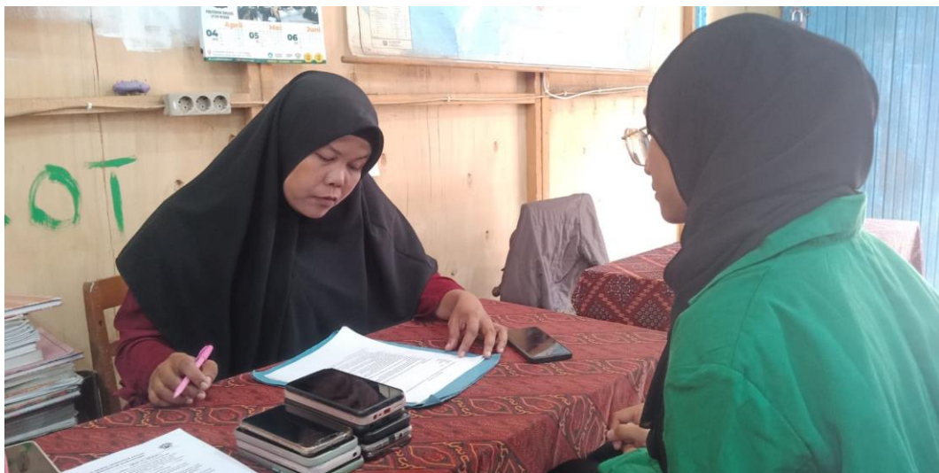
Wawancara Dengan Guru Bidang Studi Matematika