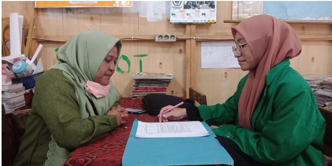
Wawancara Dengan Guru Seni Budaya