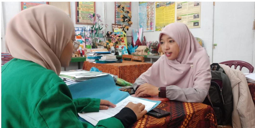
Wawancara Dengan Guru Bidang Studi Bahasa Inggris