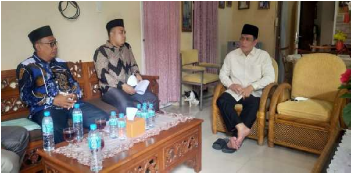
Wawancara dengan Komisi III DPR RI Fraksi Partai Gerindra Romo H.R. Muhammad Syafi'i, SH, M.Hum. Pada tanggal : 10 Maret 2022 di kediaman beliau.