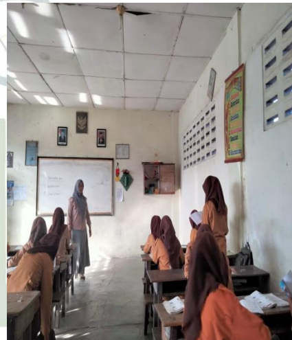
UNIVERSITAS ISLAM NEGERI Observation Picture SUMATERA UTARA MEDAN