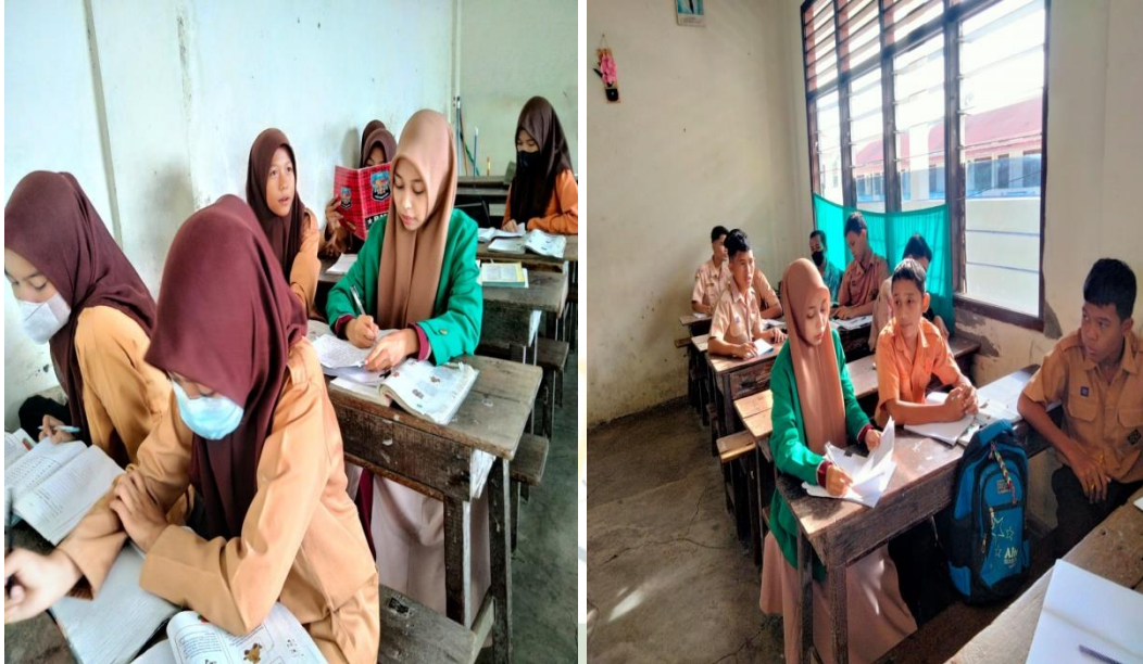
Interview with students