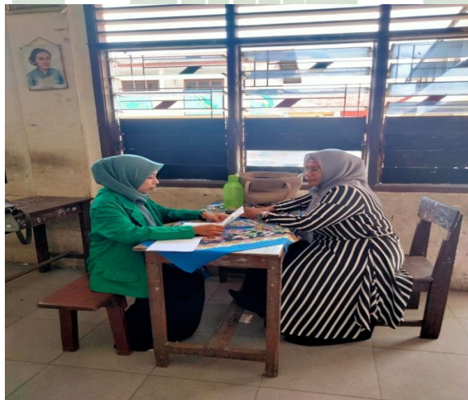
Interview with teacher