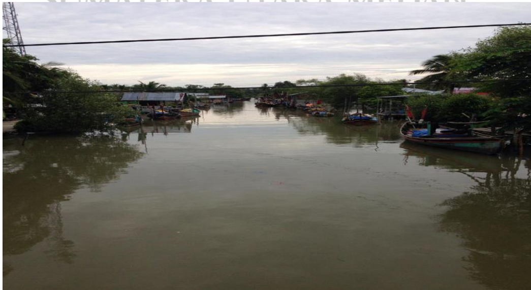
Perumahan Nelayan Desa Dahari Selebar

UNIVERSITAS ISLAM NEGERI SUMATERA UTARA MEDAN