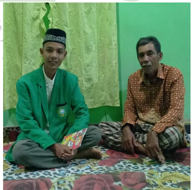
Wawancara bersama masyarakat nelayan Desa Dahari Selebar Kecamatan Talawi