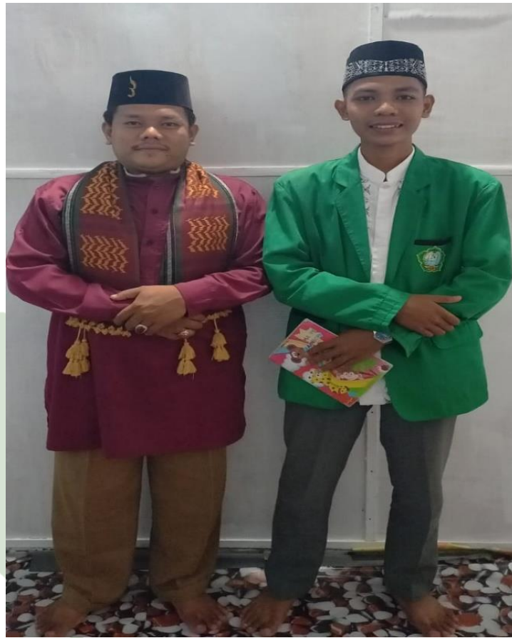
Bersama penyuluh agama kecamatan talawi untuk Desa Dahari selebar

UNIVERSITAS ISLAM NEGERI SUMATERA UTARA MEDAN