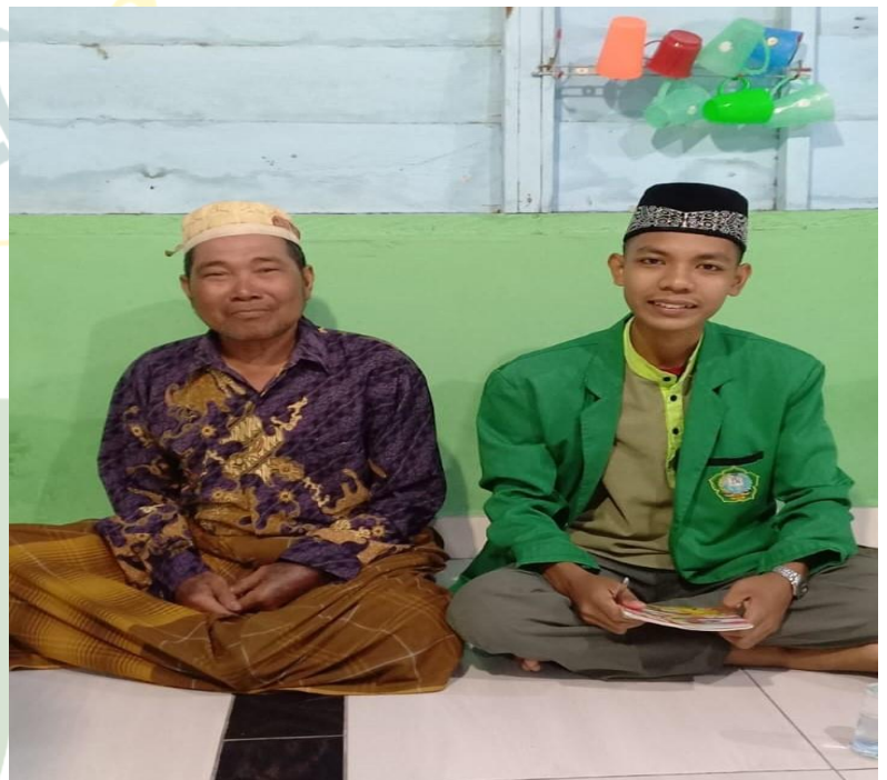
Wawancara bersama masyarakat nelayan Desa Dahari Selebar Kecamatan Talawi