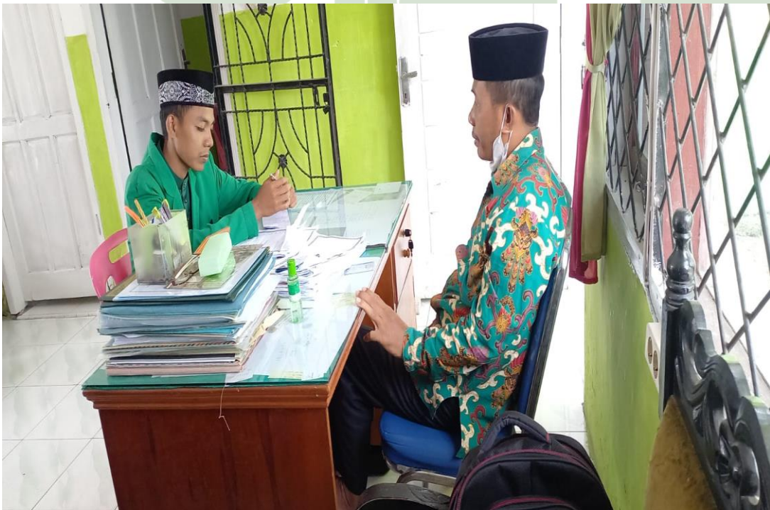
Wawancara bersama pegawai Kantor Urusan Agama (KUA) Kecamatan Talawi