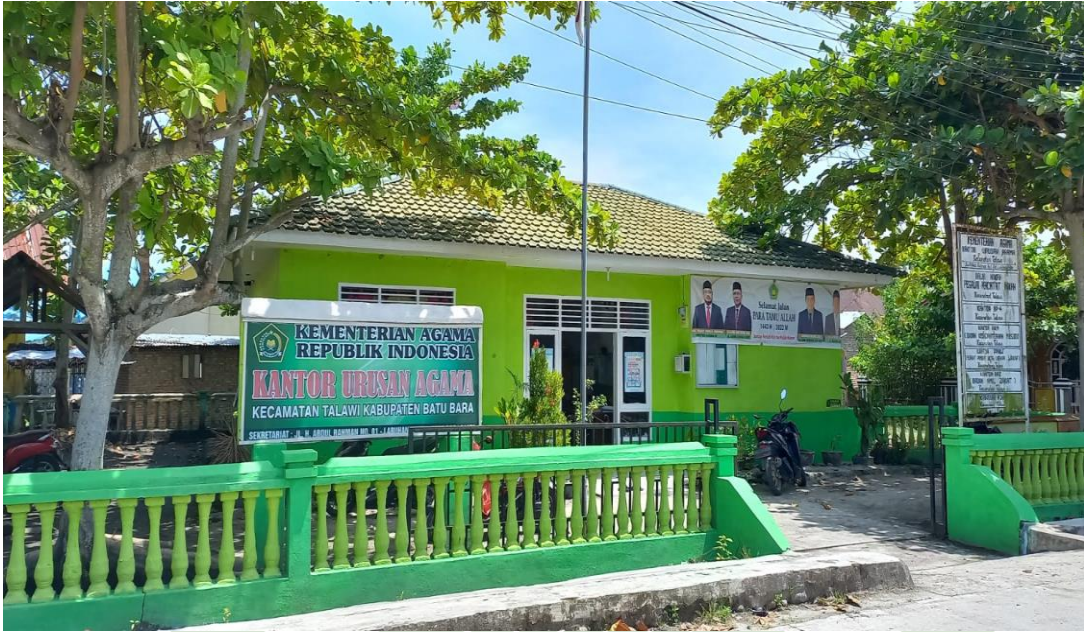
Kantor Urusan Agama (KUA) Kecamatan Talawi