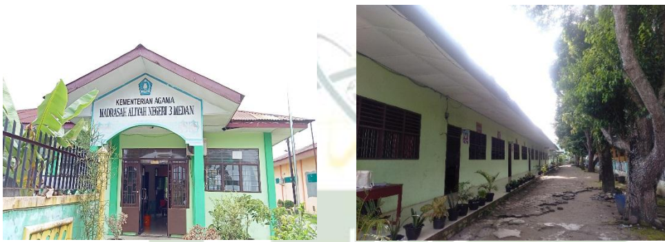
Gambar 18. Tampak depan MAN 3 Medan