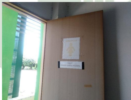
Gambar 15. Kamar mandi Guru dan Pegawai