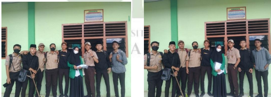
Gambar 19. Bersama Peserta didik MAN 3 Medan