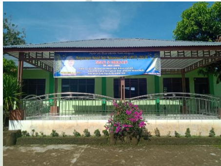
Gambar 2. Pendopo MAN 3 Medan