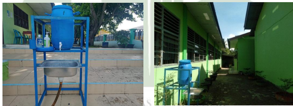
Gambar 7. Tempat cuci tangan MAN 3 Medan