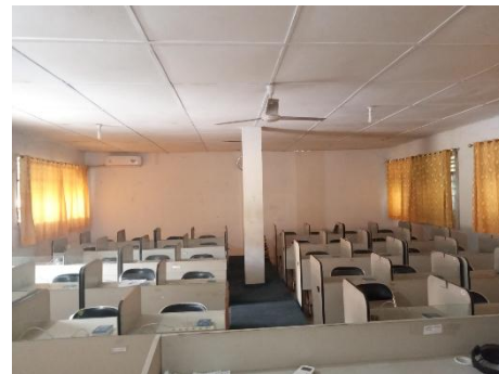
Gambar 10. Lab Bahasa MAN 3 Medan