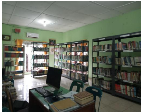
Gambar 11. Perpustakaan MAN 3 Medan