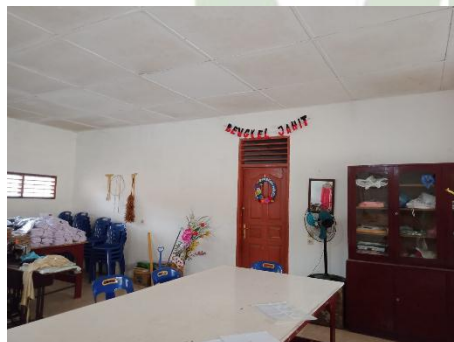
Gambar 12. Ruang Tata Busana MAN 3 Medan