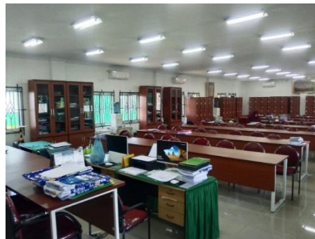
Gambar 4. Ruang Guru Madrasah