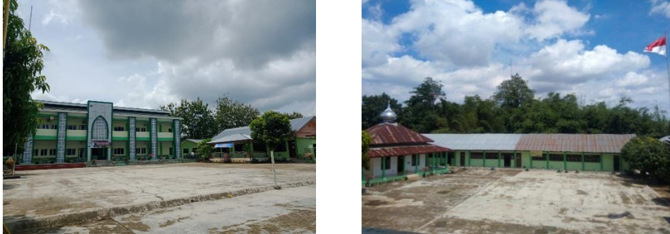
Gambar 1. Gedung dan lapangan MAN 3 Medan