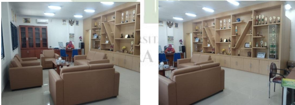
Gambar. 3 Ruang Kepala Madrasah