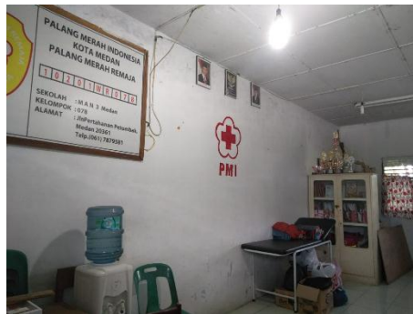
Gambar 17. Ruang UKS MAN 3 Medan