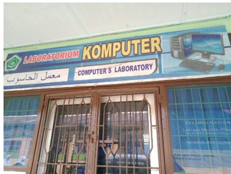
Gambar 9. Lab Komputer MAN 3 Medan