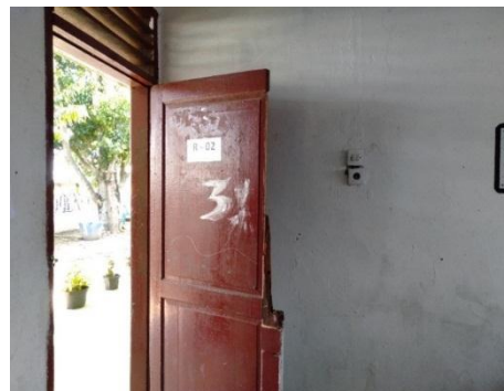
Gambar 6. Ruang Kelas MAN 3 Medan