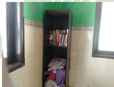
Gambar 5. Musholla MAN 3 Medan