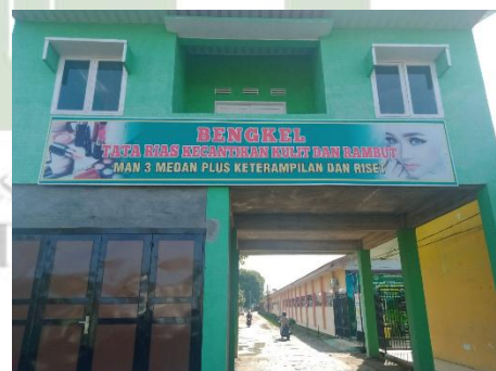
Gambar 13. Ruang tata rias MAN 3 Medan