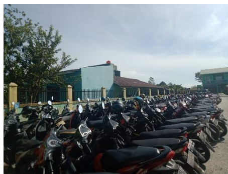
Gambar 16. Parkiran MAN 3 Medan