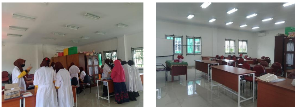
Gambar 8. Lab IPA MAN 3 Medan sekaligus Ruang Kelas SKS