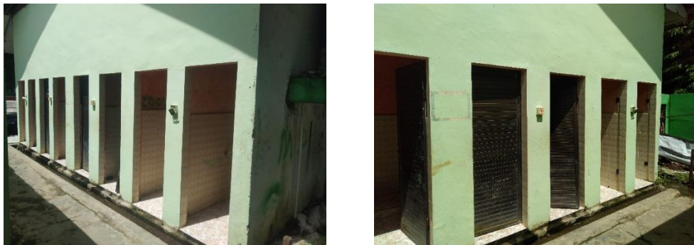
Gambar.14 Kamar mandi peserta didik