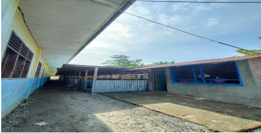
Gambar 1.16 Kantin SMP Negeri 3 Air Putih