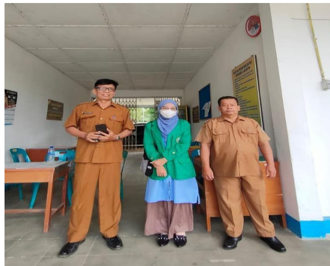
Gambar 1.1 Kepala Sekolah dan Kepala Tata Usaha SMP Negeri 3 Air Putih