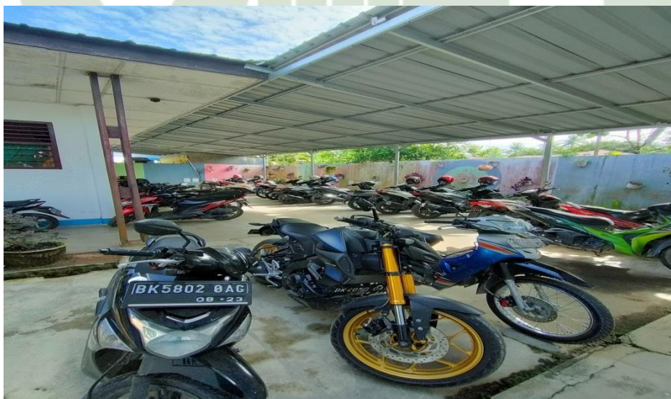
Gambar 1.9 Parkiran SMP Negeri 3 Air Putih