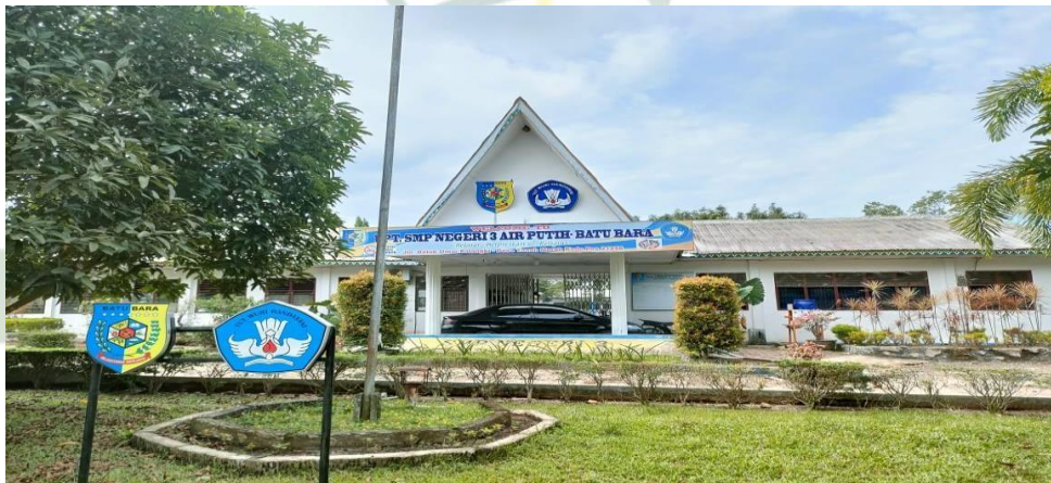
Gambar 1.8 Tampak Depan SMP Negeri 3 Air Putih