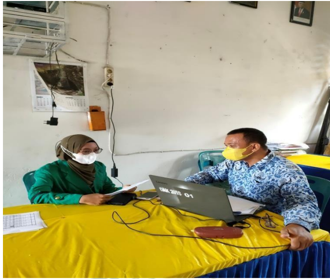
Gambar 1.3 Wawancara Dengan Wakil Kepala Sekolah Bidang Kurikulum SMP Negeri 3 Air Putih