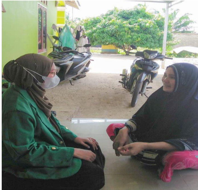
Gambar 1.5 Wawancara Dengan Orang Tua Siswa SMP Negeri 3 Air Putih