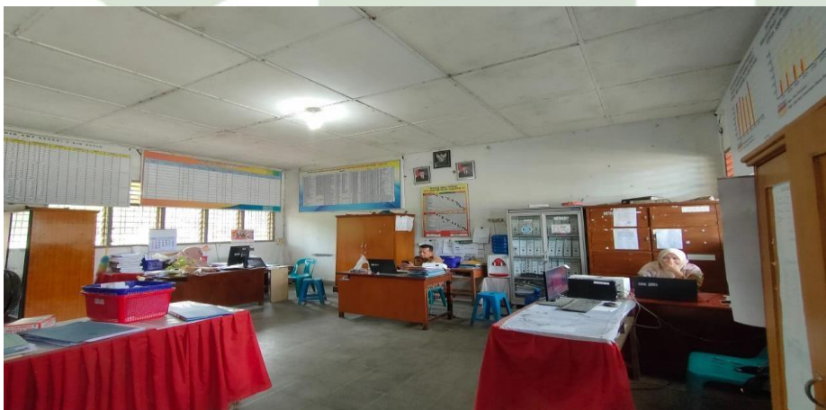
Gambar 1.12 Ruangan Tata Usaha SMP Negeri 3 Air Putih