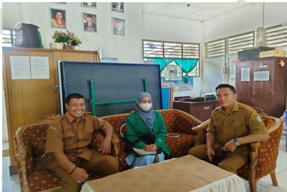
Gambar 1.2 Wakil Kepala Sekolah Bidang Kesiswaan, Koordinator Ekstrakurikler dan Sarana Prasarana SMP Negeri 3 Air Putih