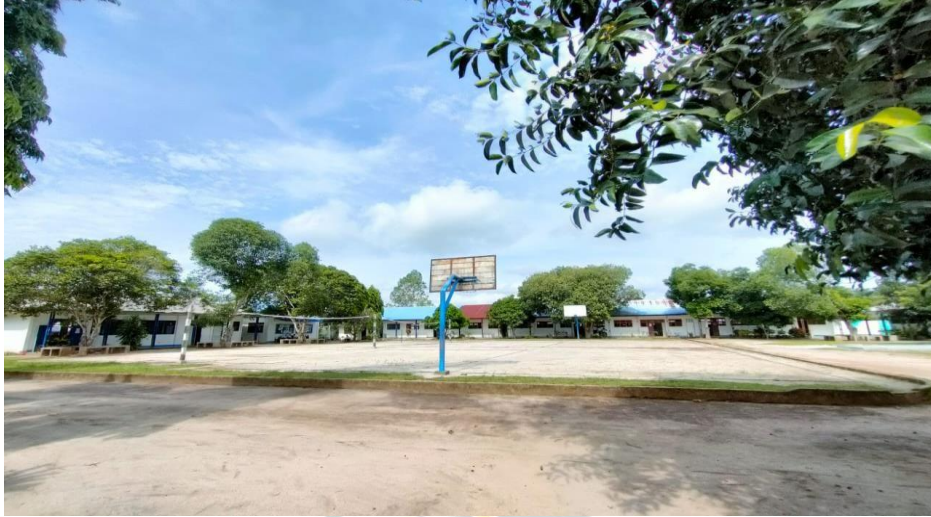
Gambar 1.10 Lapangan Voli dan Lapangan Bola Basket SMP Negeri 3 Air Putih