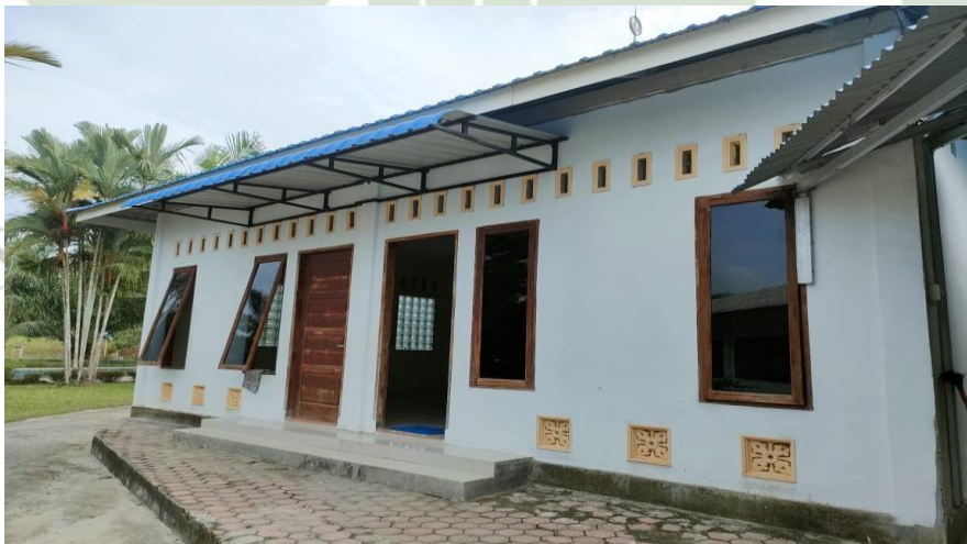
Gambar 1.18 Mushola SMP Negeri 3 Air Putih