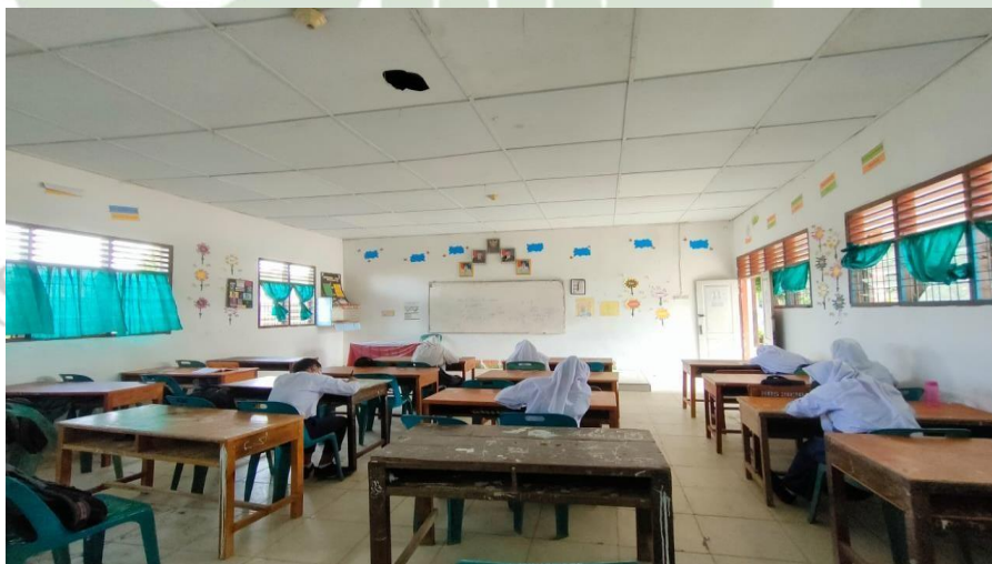
Gambar 1.15 Ruang Kelas SMP Negeri 3 Air Putih