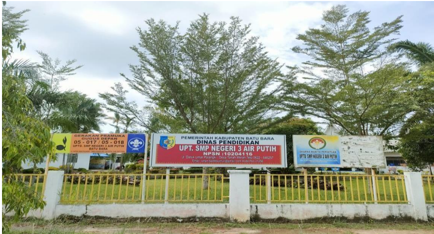
Gambar 1.7 Plang Depan SMP Negeri 3 Air Putih