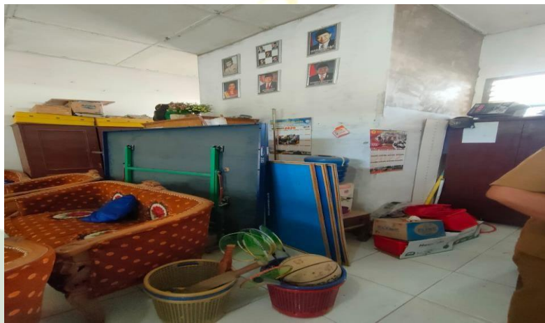
Gambar 1.19 Perlengkapan Ekstrakurikuler SMP Negeri 3 Air Putih