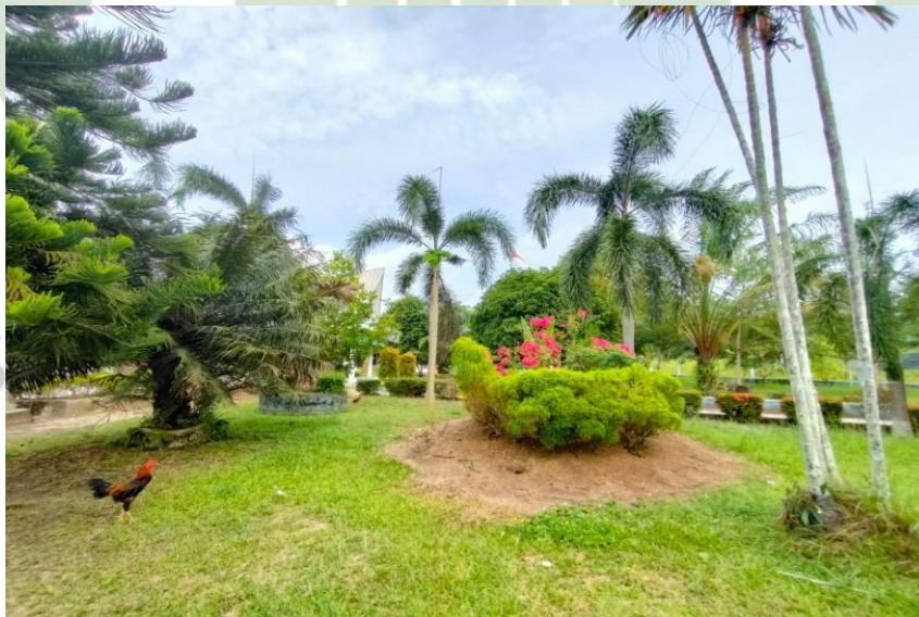
Gambar 1.20 Taman SMP Negeri 3 Air Putih