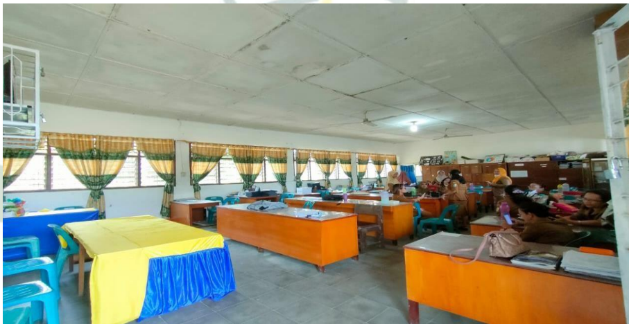
Gambar 1.14 Ruang Guru SMP Negeri 3 Air Putih