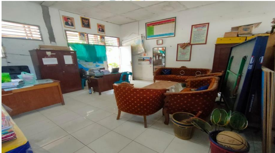
Gambar 1.11 Ruangan BK SMP Negeri 3 Air Putih