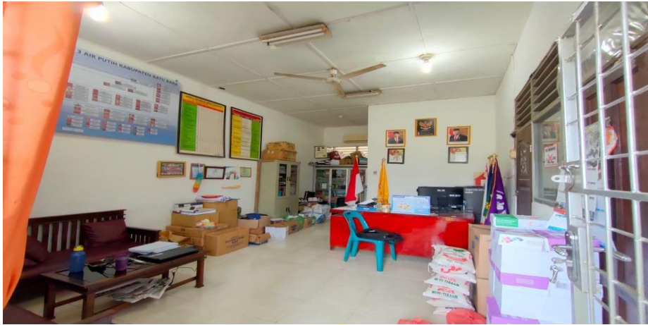
Gambar 1.13 Ruang Kepala Sekolah SMP Negeri 3 Air Putih