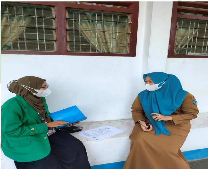
Gambar 1.4 Wawancara Dengan Guru SMP Negeri 3 Air Putih