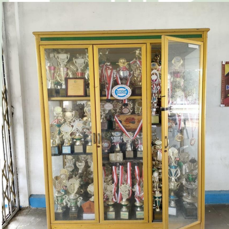
Gambar 1.6 Piala SMP Negeri 3 Air Putih