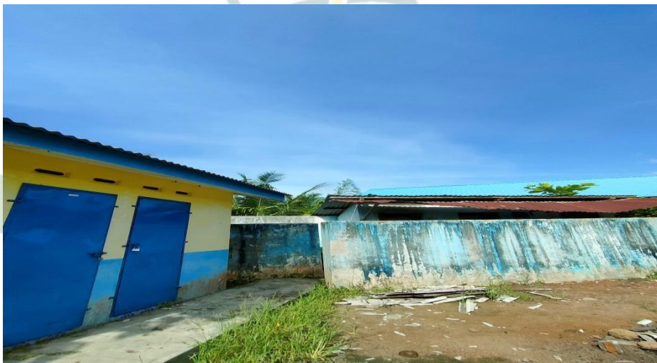
Gambar 1.17 Kamar Mandi Siwa SMP Negeri 3 Air Putih