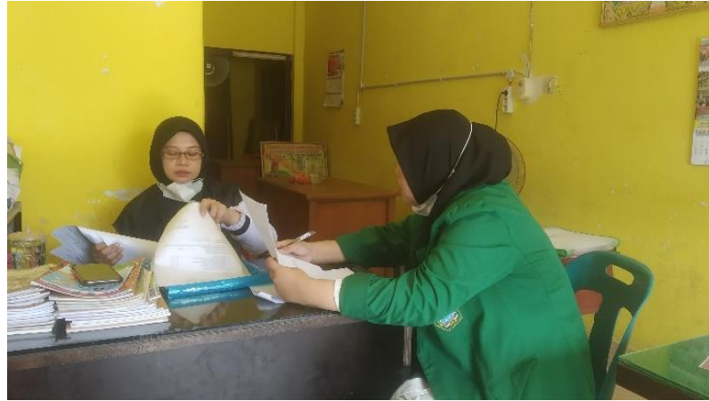
Foto dokumentasi dengan Guru BK di MAN 2 Langkat