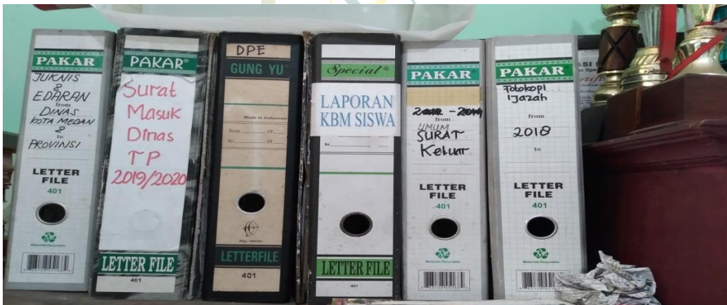
Gambar 8. Rak Pengarsipan Tata Usaha