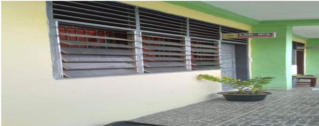
Gambar 4. Ruang Laboratorium