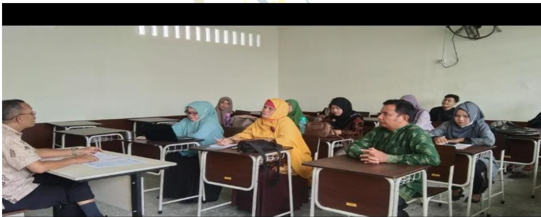
Gambar 5. Rapat pembentukan Panitia PPDB