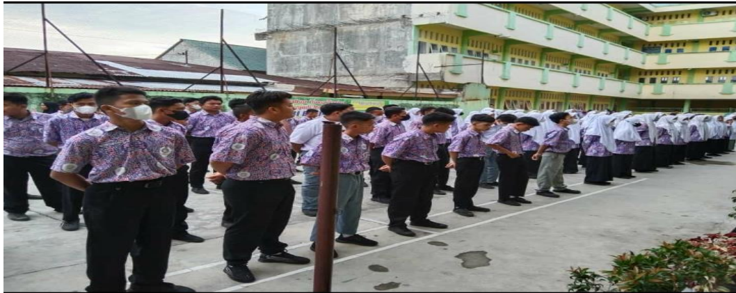
Gambar 7. Awal Mauk Tahun Ajaran Baru