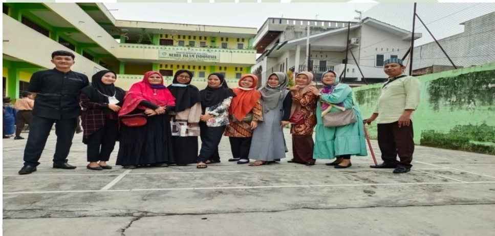
Gambar 9. Foto Bersama Tenaga Pendidik Dan Tenaga kependidikan