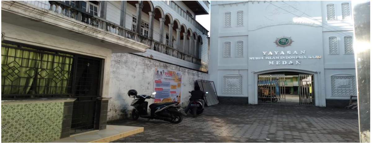
Gambar 1. Depan Gedung sekolah