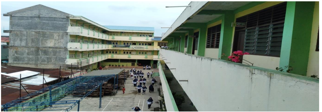
Gambar 2. Gedung sekolah