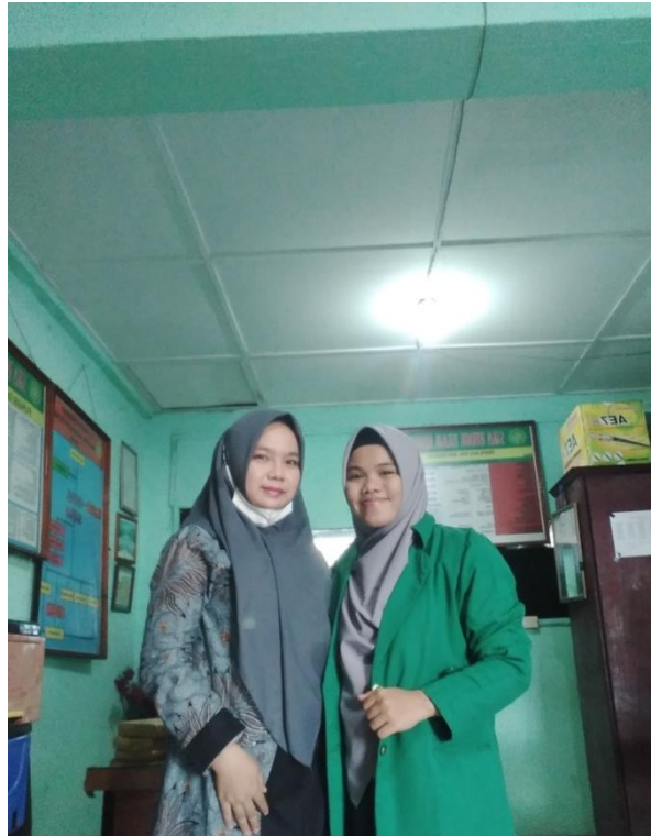
Gambar 9. Foto Bersama Wakasek Kurikulum