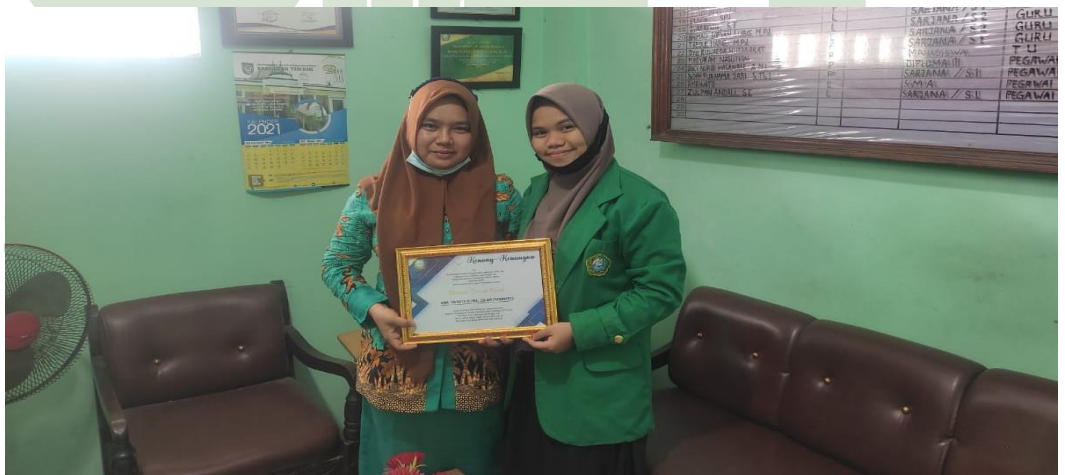
Gambar 12 bersama waksek Kurikulum