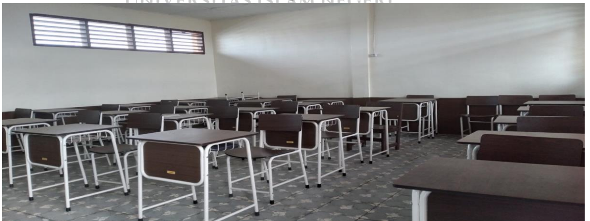
Gambar 3. Ruang Kelas