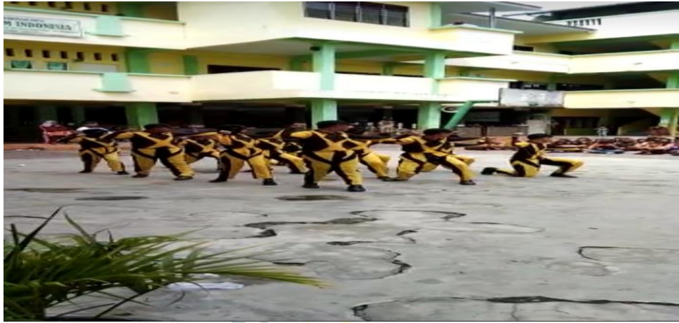
Gambar 10. Salah Satu Ekstrakurikuler