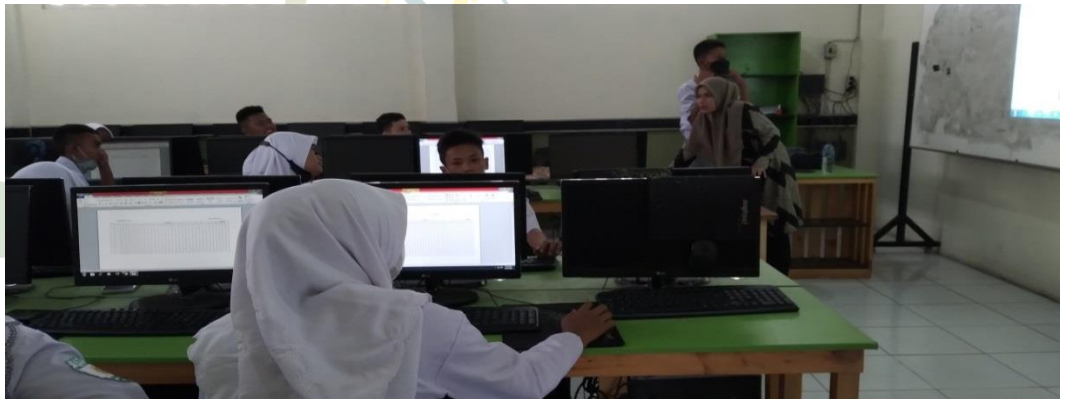
Gambar 11 Lab Komputer