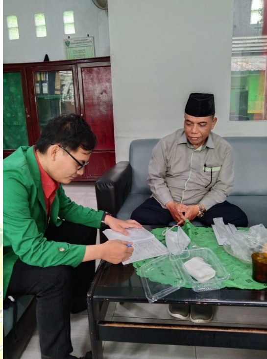
Gambar 6. Wawancara dengan Waka Madrasah III