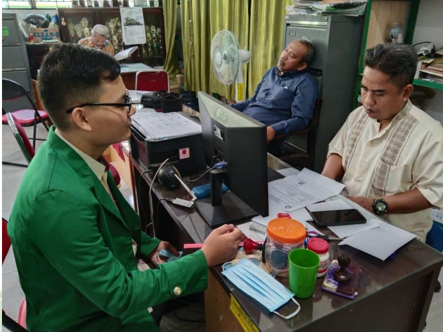
Gambar 8. Wawancara dengan Siswa