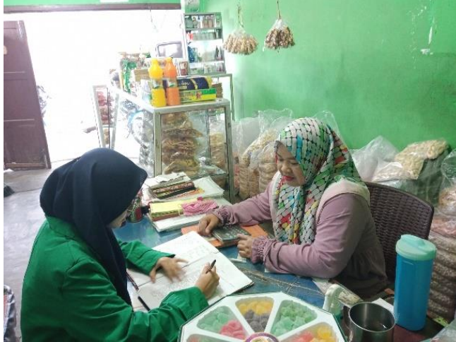
Kepada Pemilik Usaha