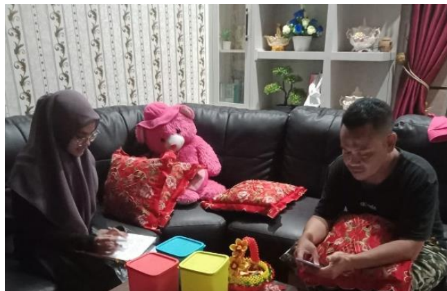
Kepada Pemilik Usaha