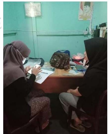
Kepada Bagian Kasir