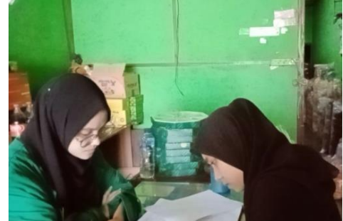
Kepada Bagian Pencatatan