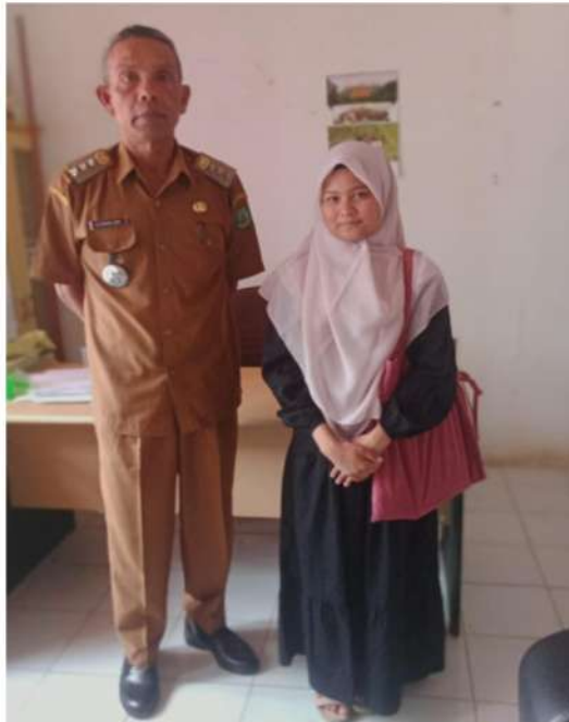
Wawancara dengan Camat Puncak Sorik Merapi