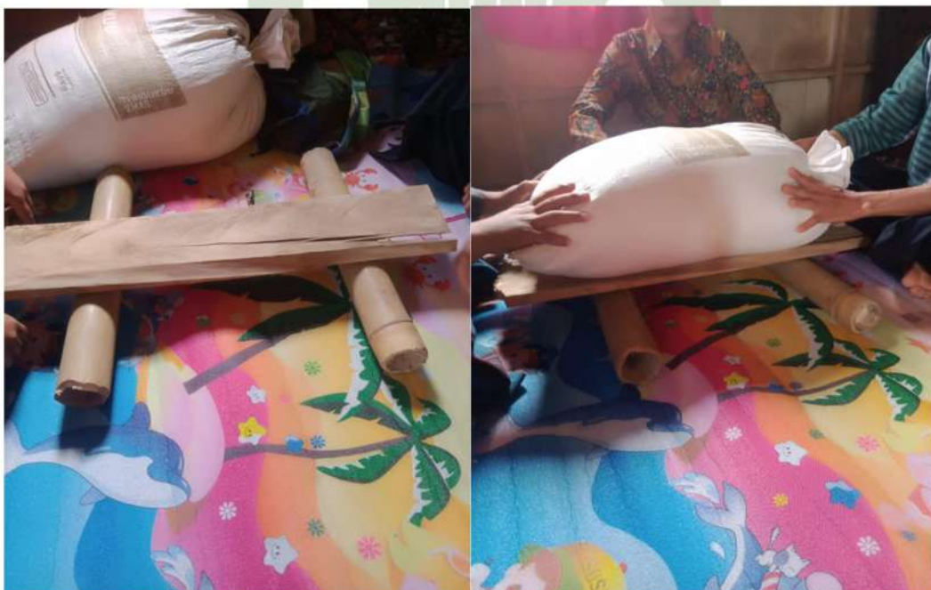
Papan tempat beras dan bambu sebagai roda guna Penulakan fidyah