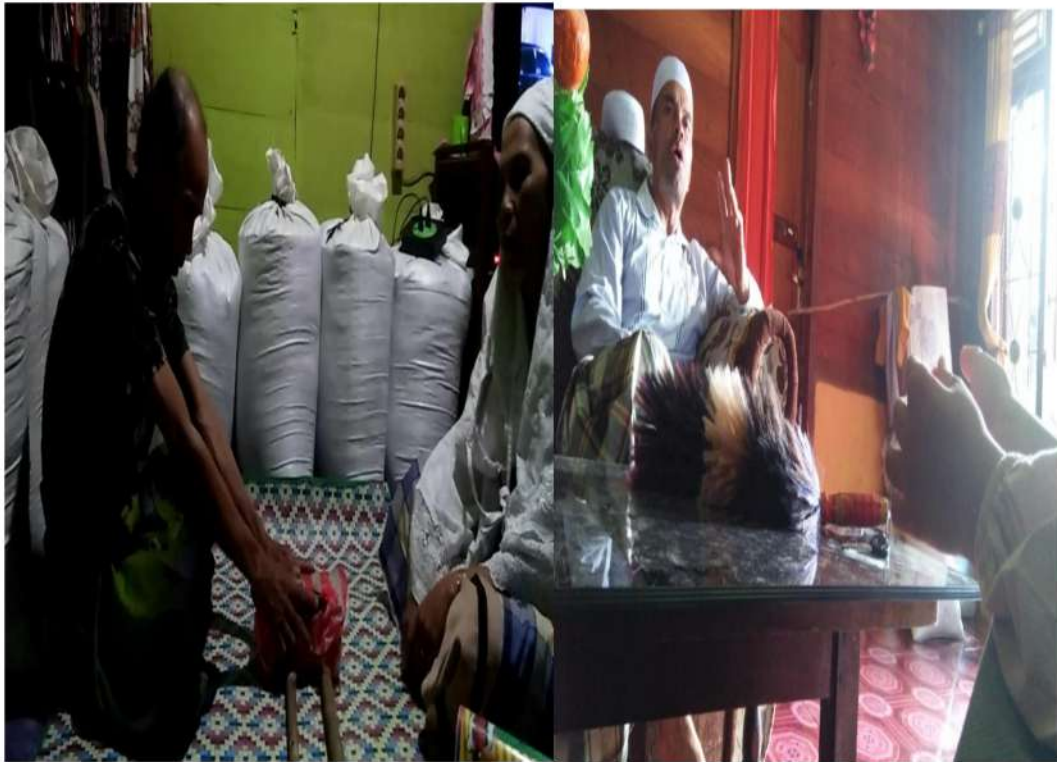
Wawancara dengan Bapak Suaib dan Bapak Bisman di Desa Handel dan Hutanamale