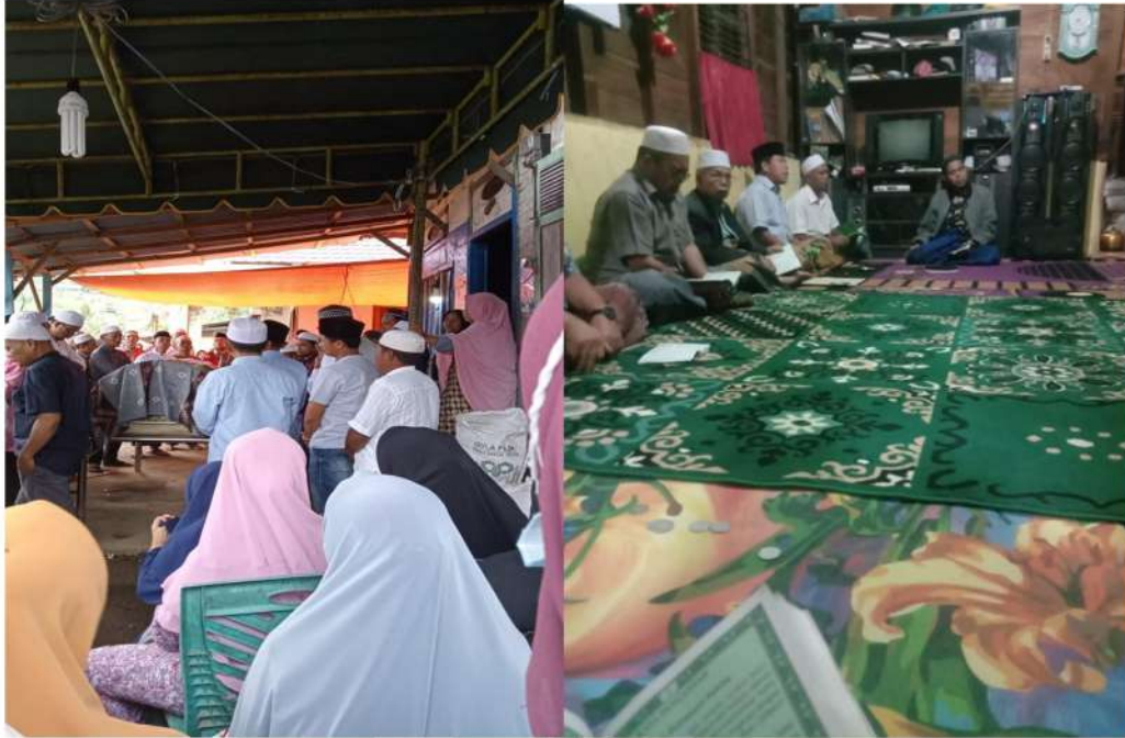
Prosesi Upacara Kematian pelaksanaan fardhu kipayah dan malam Tahlilan

Ukuran beras yang dibagi dengan menggunakan tabung beras dan dalam satu tabung ada 6 mud serta gundalan dengan menggunakan jagung guna perhitungan tulaq menulak fidyah