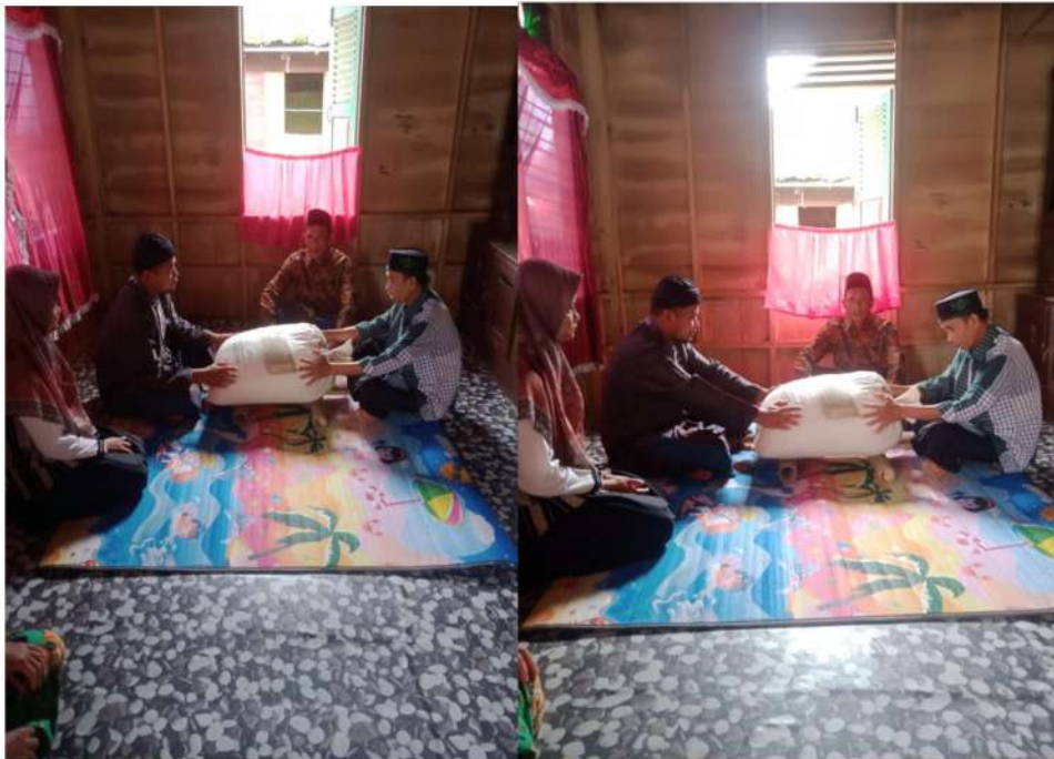
Pelaksanaan Tradisi pembayaran Fidyah shalat