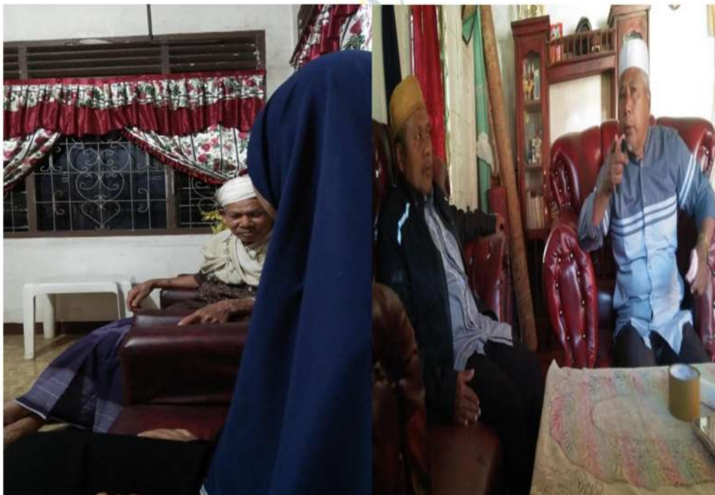
Wawancara Ayah Mansyur dan Bapak Sulhan di Desa Huta Baru dan Hutabaringin