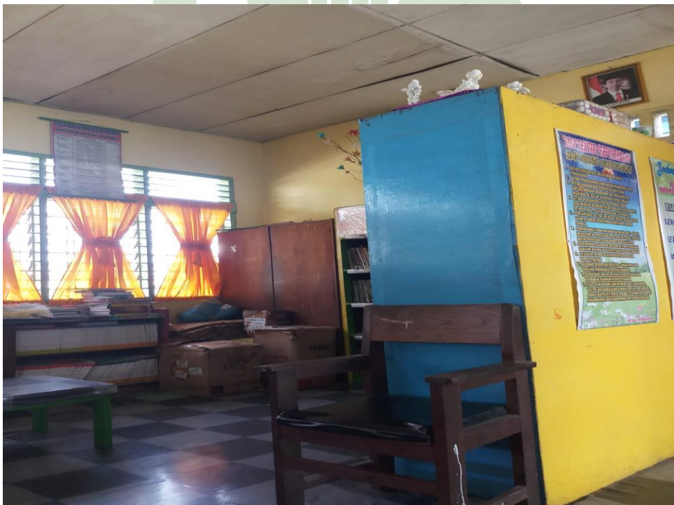
Ruang perpustakaan SMP Negeri 1 Kotapinang