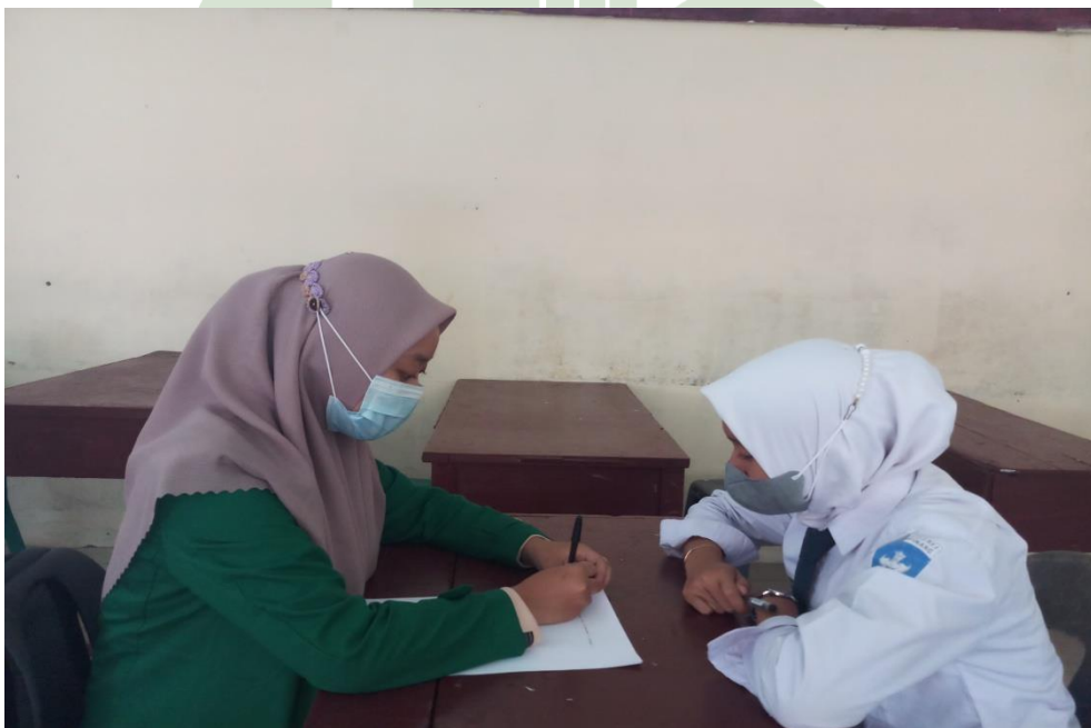
Wawancara dengan siswa yang menjadi informan