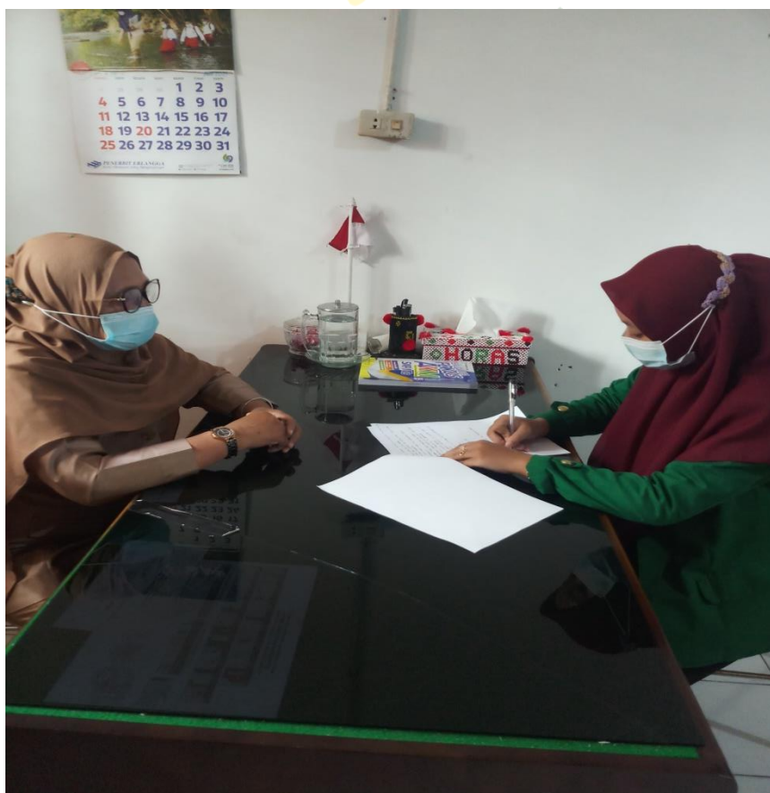
Wawancara dengan ibu pelaksana program literasi