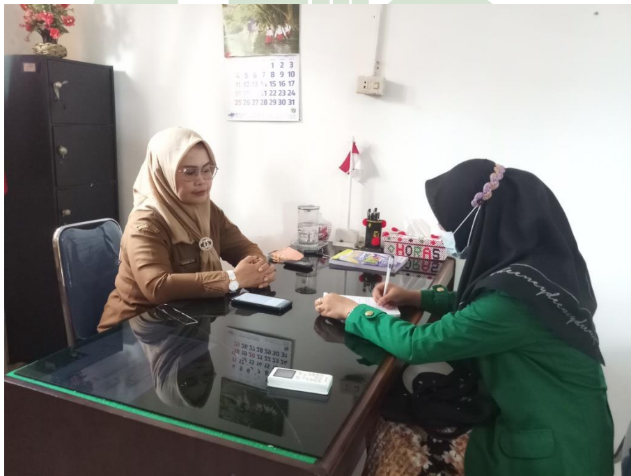
Wawancara dengan ibu pustakawan dan ibu kepala sekolah SMP Negeri 1 Kotapinang