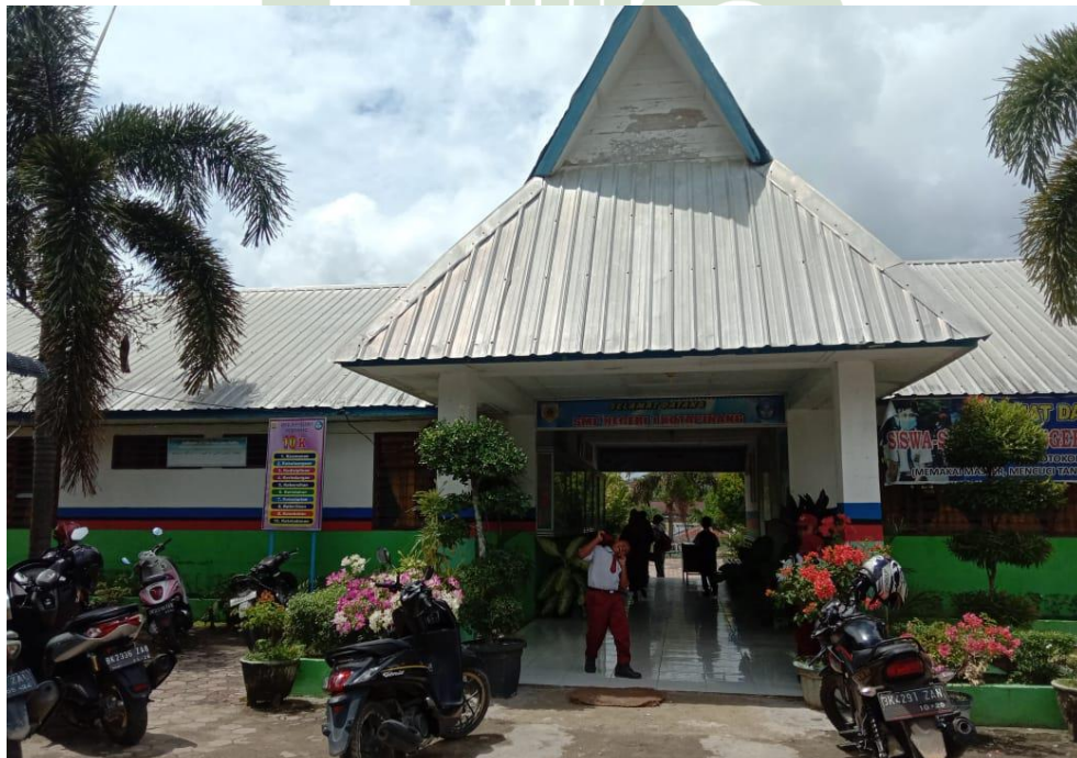
SMP Negeri 1 Kotapinang