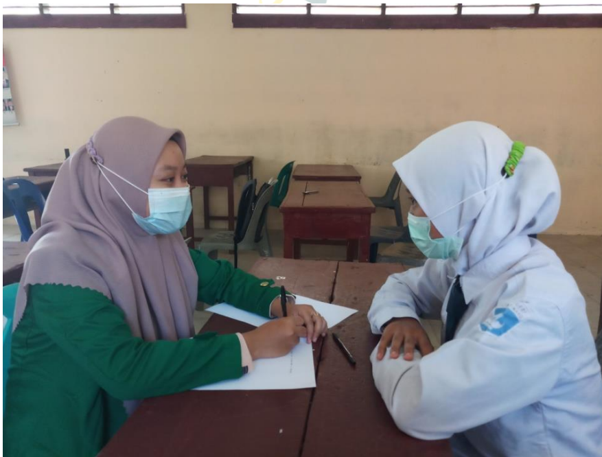
Wawancara dengan siswa yang menjadi informan