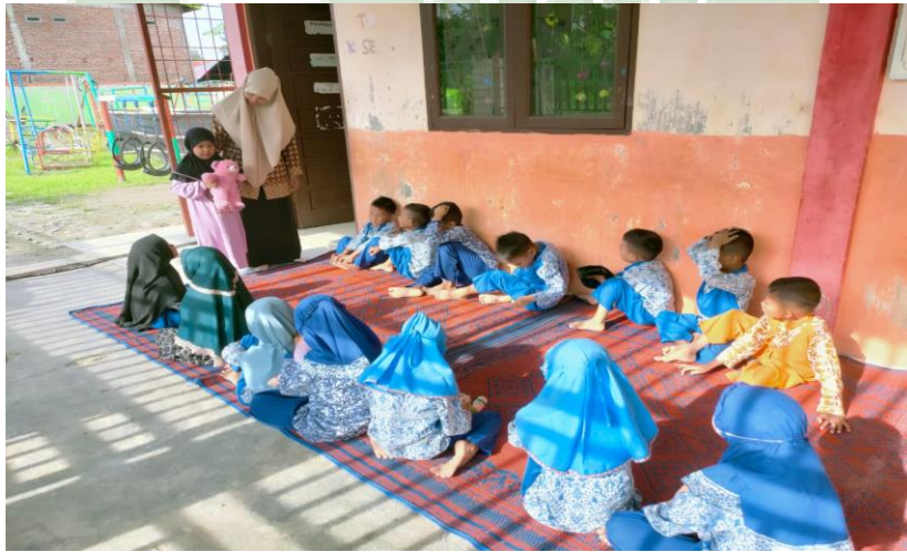
Gambar proses penerapan metode bermain show and tell