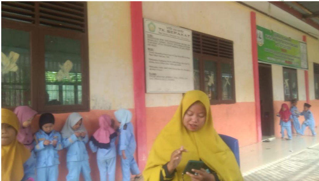
Gambar Depan Sekolah