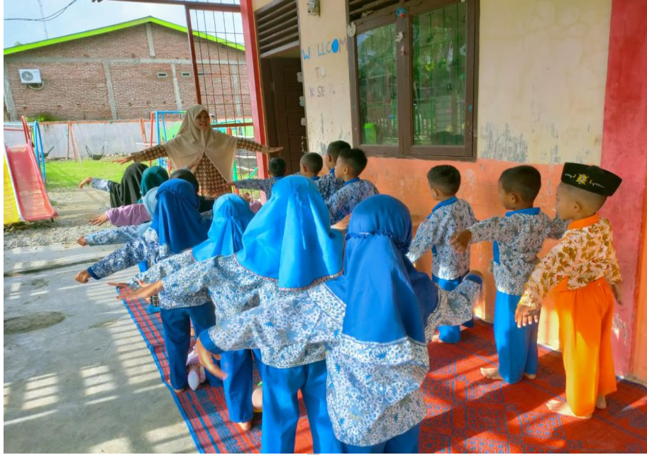
Guru sedang menertibkan anak-anak untuk proses metode bermain show and tell