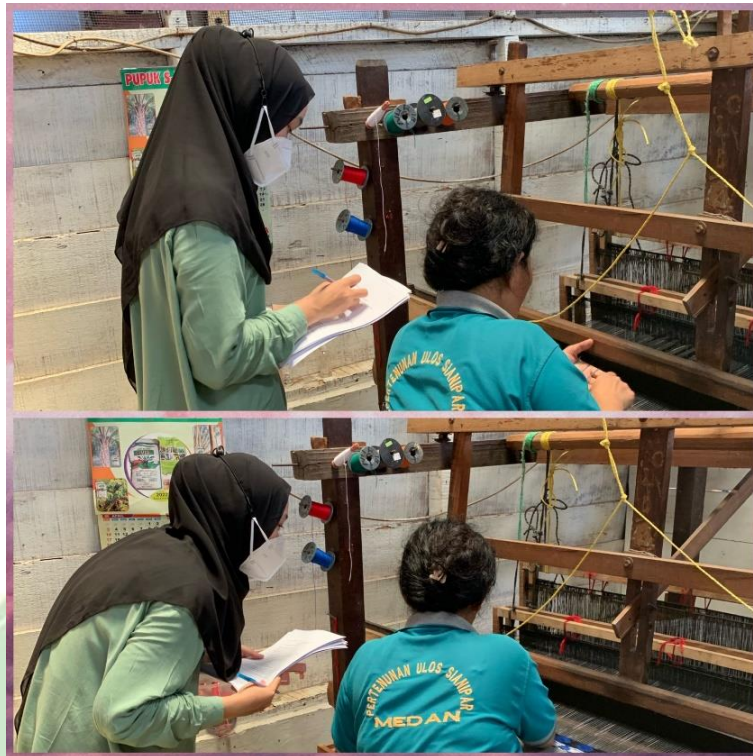
Gambar 1. Menjawab Kuesioner Tingkat Kelelahan Kerja Sebelum Pemberian Aromaterapi Lavender