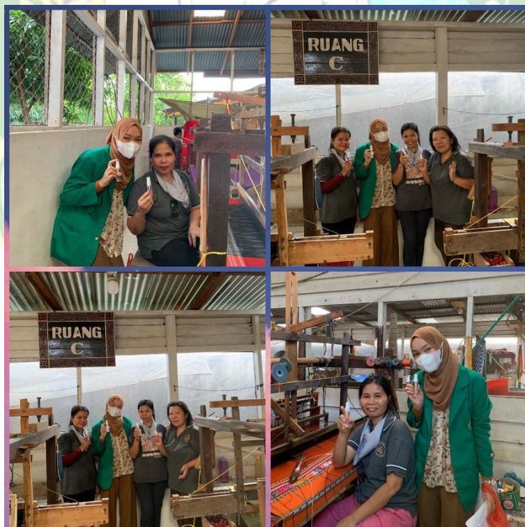
Gambar 8. Pemberian Minyak Esensial Lavender