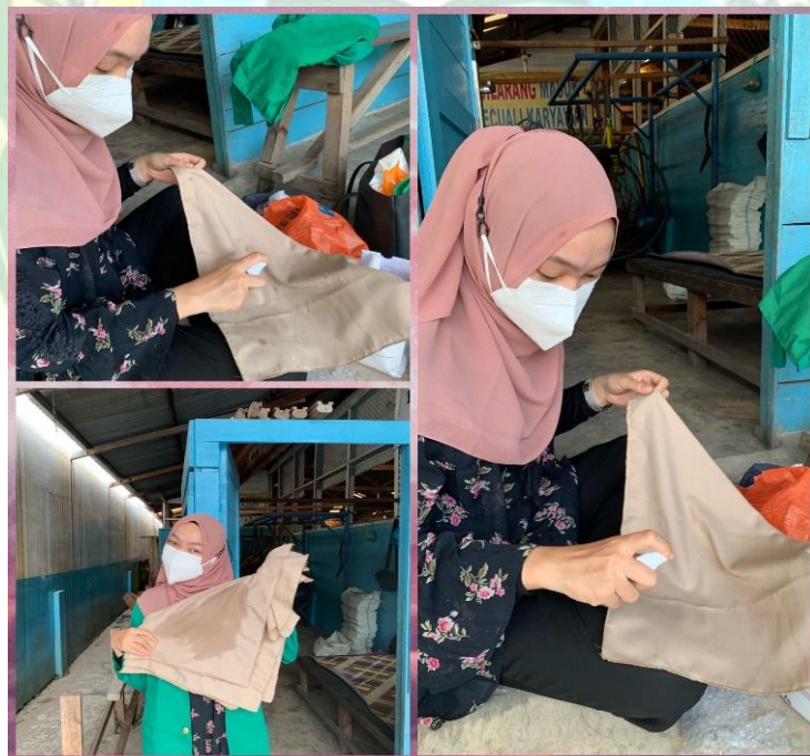
Gambar 2. Penyemprotan Aromaterapi Lavender