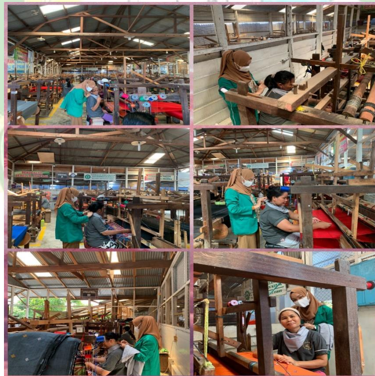
Gambar 6. Hari Keempat Pemberian Aromaterapi Lavender