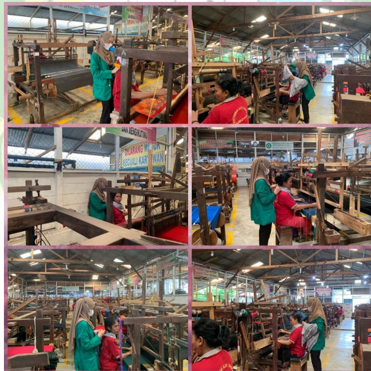
Gambar 4. Hari Kedua Pemberian Arpmaterapi Lavender