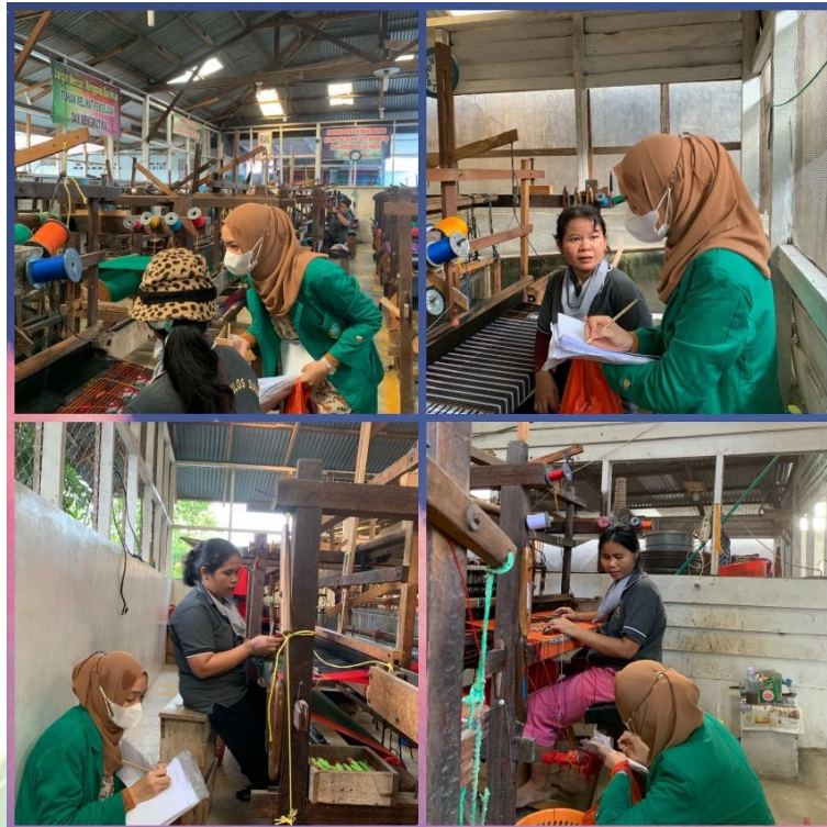
Gambar 7. Menjawab Kuesioner Tingkat Kelelahan Kerja Sesudah Pemberian Aromaterapi Lavender