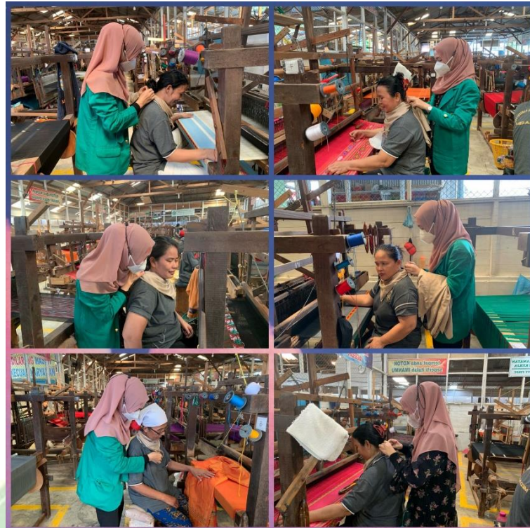
Gambar 3. Hari Pertama Pemberian Aromaterapi Lavender