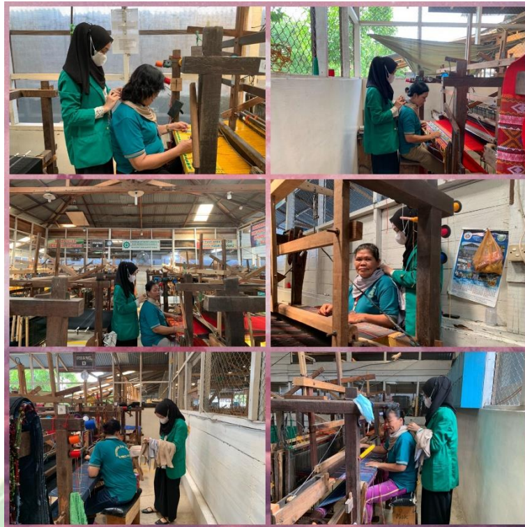
Gambar 5. Hari Ketiga Pemberian Aromaterapi Lavender