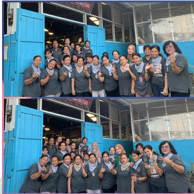
Gambar 9. Foto Bersama Para Penun