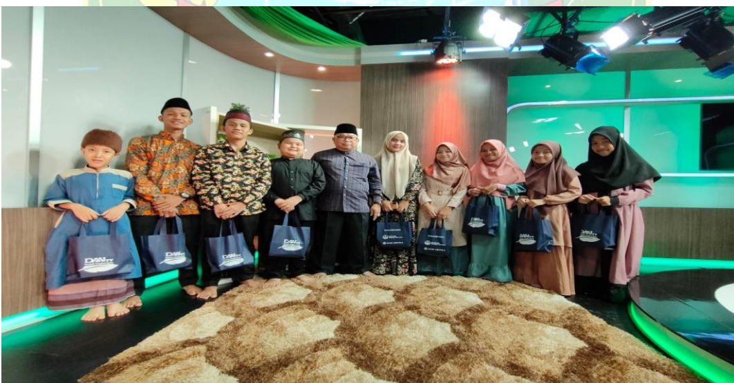
Gambar 8. Rekaman Ramadhan 1443 H/ Maret 2022 di DAAI TV Medan