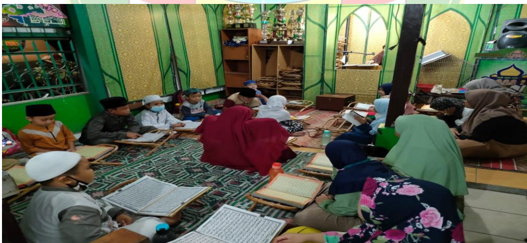
Gambar 5. Pelatihan