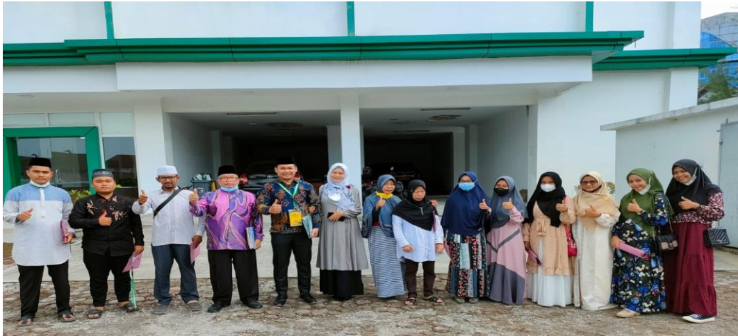
Gambar 6. MTQ Sumut ke-33 2022