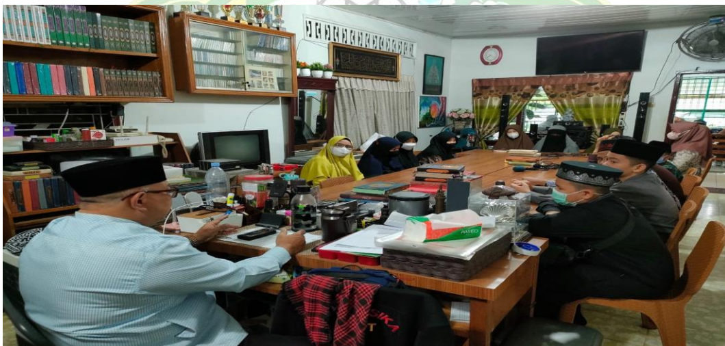
Gambar 4. Rapat antar pengurus