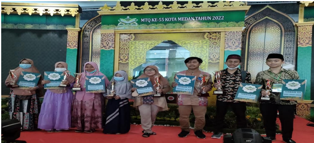
Gambar 7. Para pemenang pada MTQ Ke-55 Kota Medan 2022