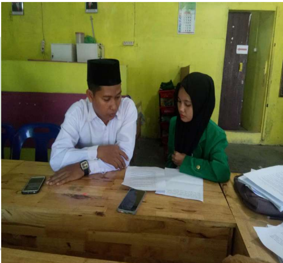
Wawancara dengan Wakil Kepala Madrasah Bidangng Kesiswaan MTs PAB Sampali