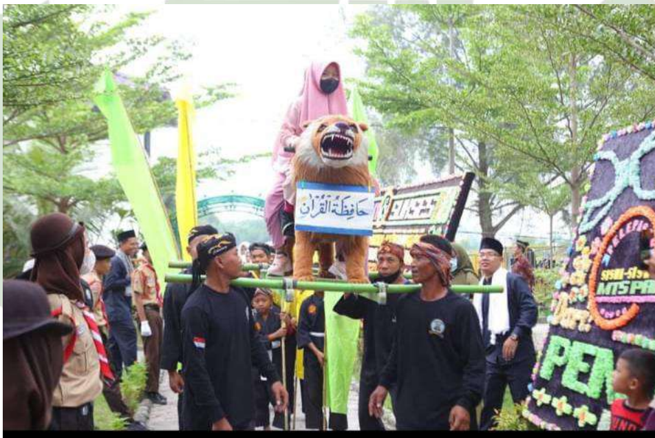
Acara Khatam Al-Quran Kelas 9

UNIVERSITAS ISLAM NEGERI SUMATERA UTARA MEDAN