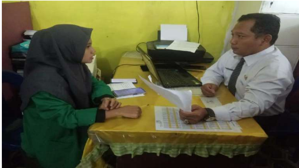
Wawancara dengan Kepala Madrasah MTs PAB 2 Sampali