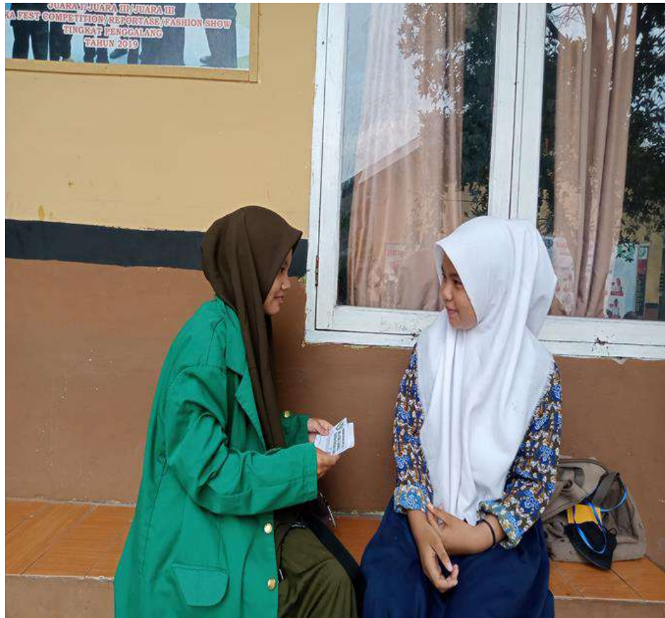
Wawancara dengan peserta didik MTs PAB 2 Sampali

UNIVERSITAS ISLAM NEGERI SUMATERA UTARA MEDAN