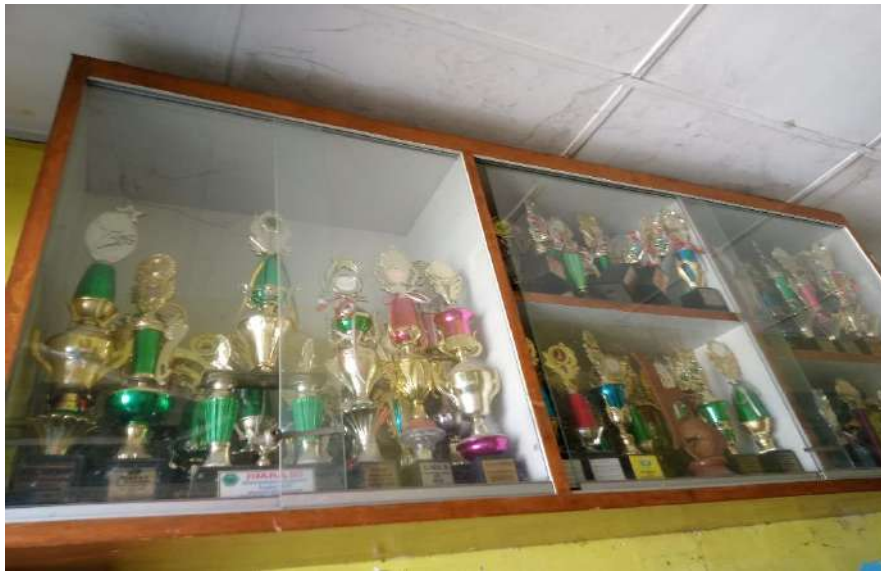
Piala Penghargaan kegiatan organisasi siswa