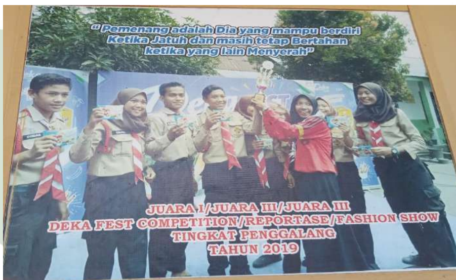
Gambar Kegiatan organisasi Pramuka

UNIVERSITAS ISLAM NEGERI SUMATERA UTARA MEDAN