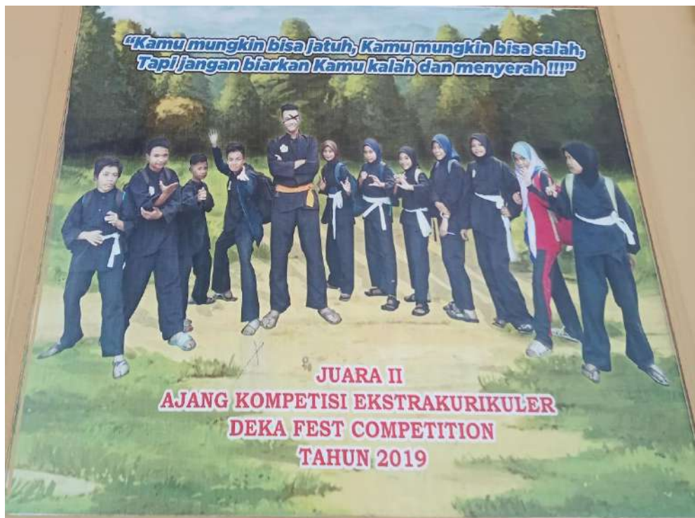
Gambar ajang kompetensi kegiatan organisasi pencak silat