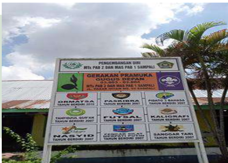
Nama –Nama Organisasi di Mts PAB 2 Sampali

UNIVERSITAS ISLAM NEGERI SUMATERA UTARA MEDAN