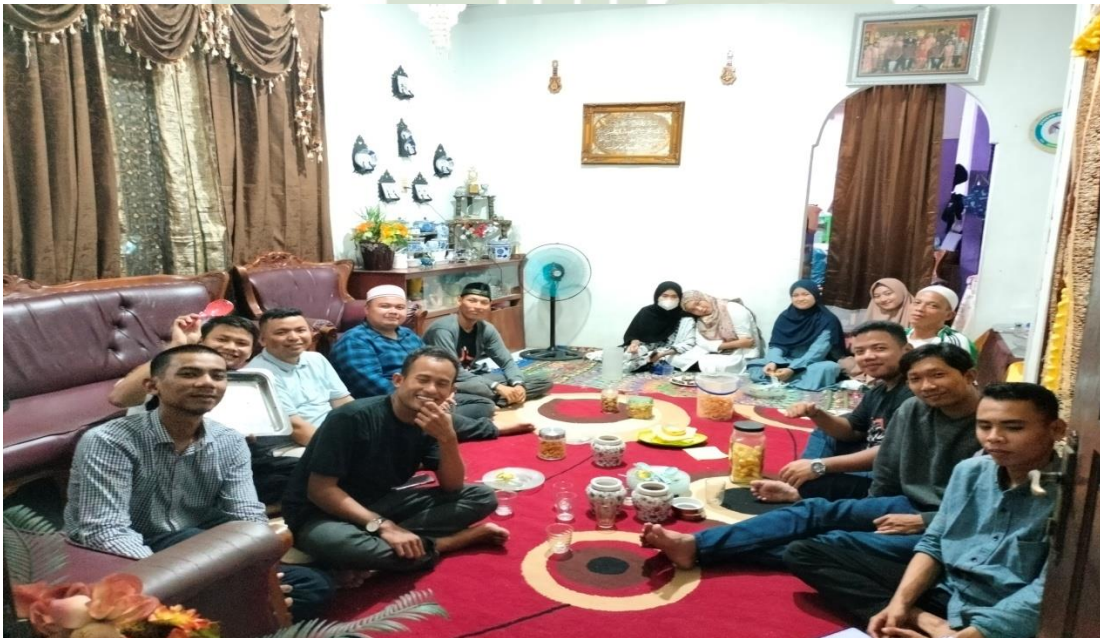
Gambar 3. Foto bersama Pengurus JPRMI Kecamatan Medan Perjuangan