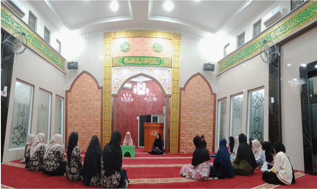
Gambar 2. Keberadaan Masjid Tempat Kajian