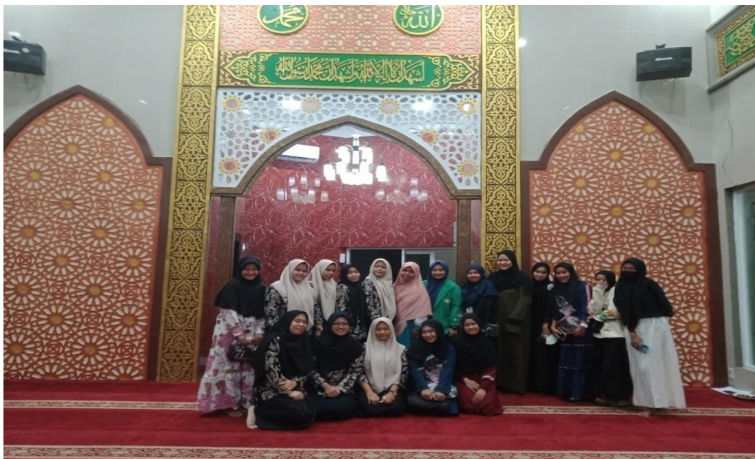
Gambar 4. Foto bersama Mubalighah, Pengurus JPRMI dan Remaja Masjid di Kecamatan Medan Perjuangan