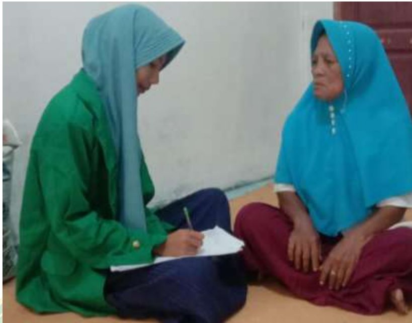
Foto wawancara dengan anggota majelis taklim Asy-syakirin