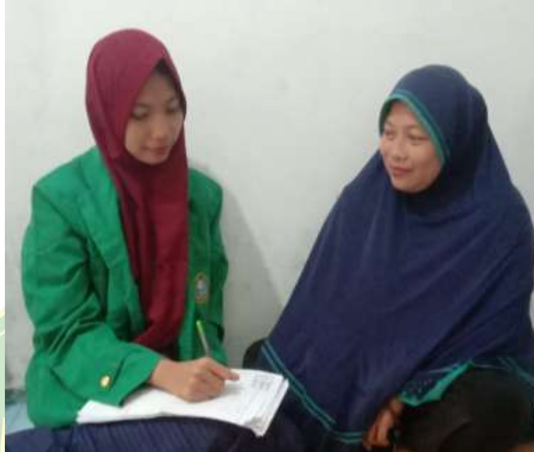
Foto wawancara dengan anggota Majelis Taklim Asy-Syakirin