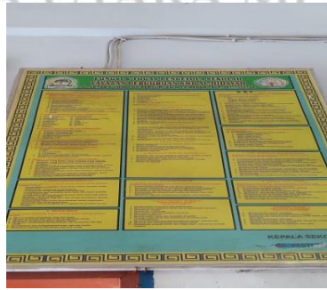
Tupoksi SMP Al-Hidayah