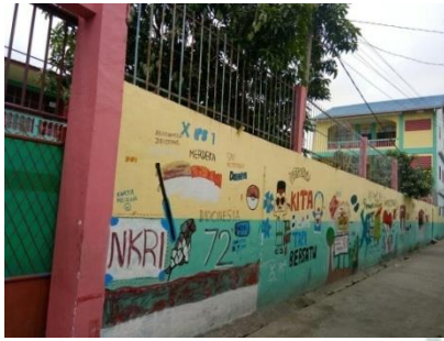
Lingkungan luar sekolah