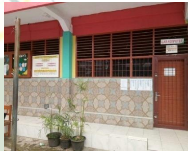
Ruang Lab Komputer