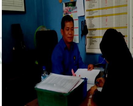
Wawancara dengan Kepala Sekolah SMP Al-Hidayah Medan Tembung