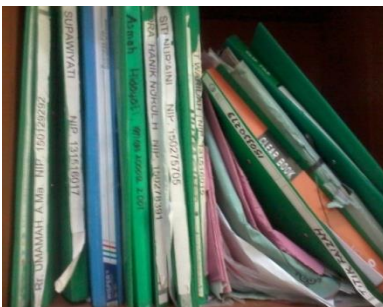
Tempat arsip SMP Al-Hidayah Medan Tembung