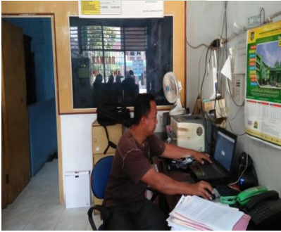
Kegiatan tata usaha SMP Al-Hidayah Medan Tembung