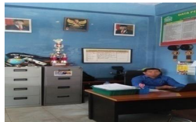
ruangan kepala sekolah