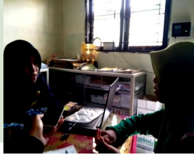
wawancara dengan guru SMP Al-Hidayah