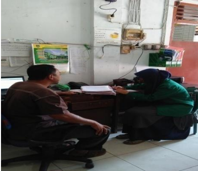
Wawancara dengan kepala tata usaha SMP Al-Hidayah Medan Tembung