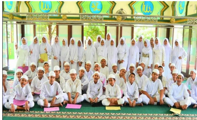
Gambar 24. Kegiatan SMP IT Nurul Hadina