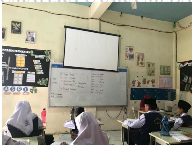
Gambar 9. Ruang Kelas Eksekutif SMP IT Nurul Hadina