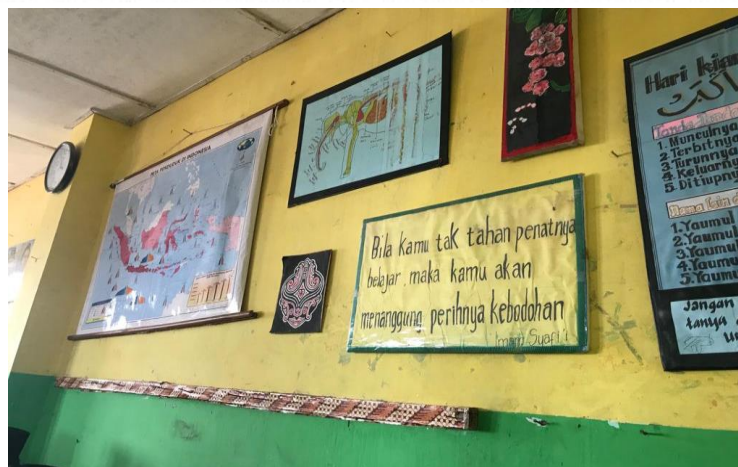
Gambar 15. Ruang Kelas Reguler SMP IT Nurul Hadina