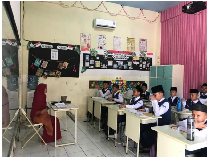
Gambar 10. Ruang Kelas Eksekutif SMP IT Nurul Hadina