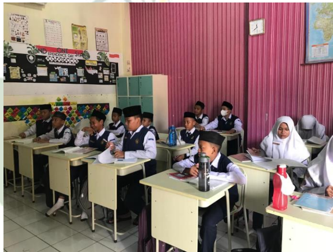
Gambar 8. Ruang Kelas Eksekutif SMP IT Nurul Hadina