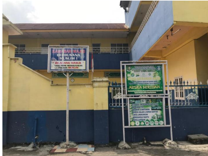
Gambar 4. Bangunan SMP IT Nurul Hadina