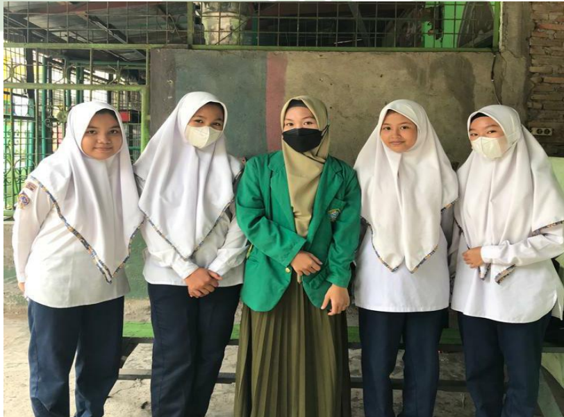
Gambar 23. Foto Bersama Murid Reguler SMP IT Nurul Hadina