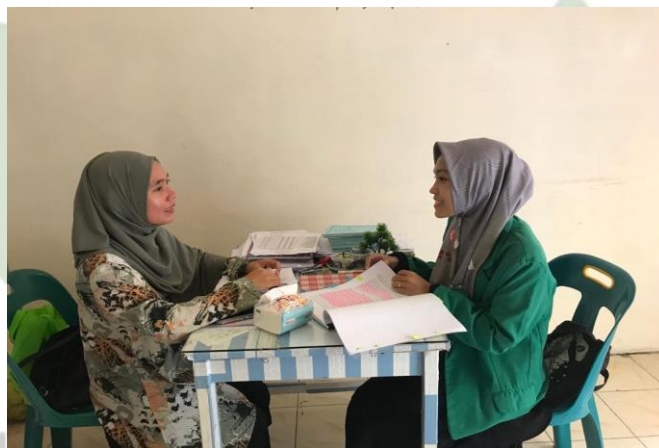
Gambar 17. Wawancara Bersama Waka Kesiswaan SMP IT Nurul Hadina