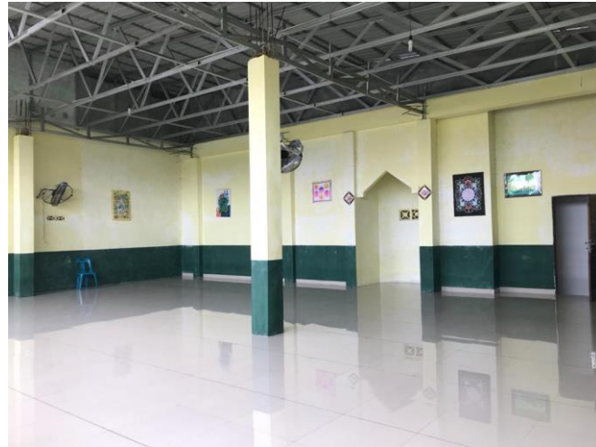
Gambar 7. Musholla SMP IT Nurul Hadina