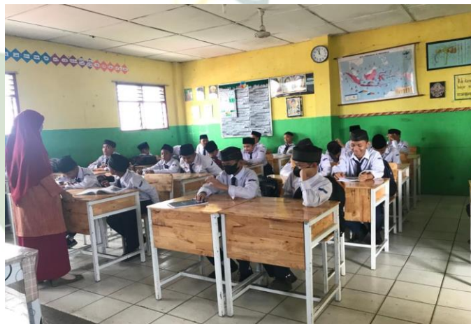
Gambar 11. Ruang Kelas Reguler LK SMP IT Nurul Hadina