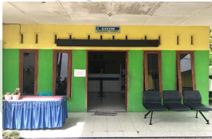
Gambar 5. Kantor guru dan staf SMP IT Nurul Hadina