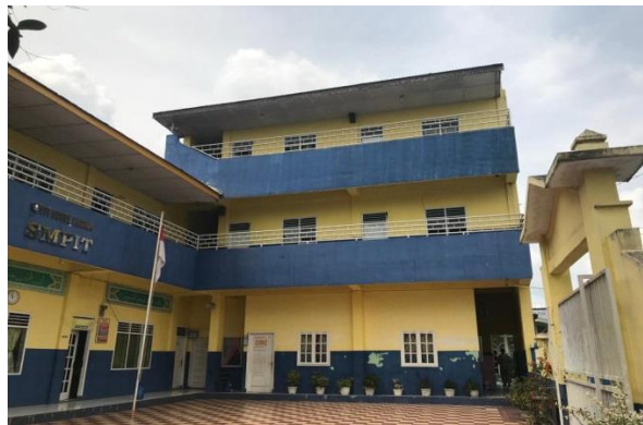
Gambar 3. Bangunan Sekolah SMP IT Nurul Hadina