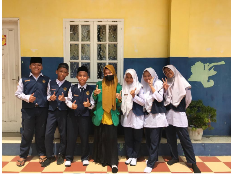
Gambar 22. Foto Bersama Murid Eksekutif SMP IT Nurul Hadina