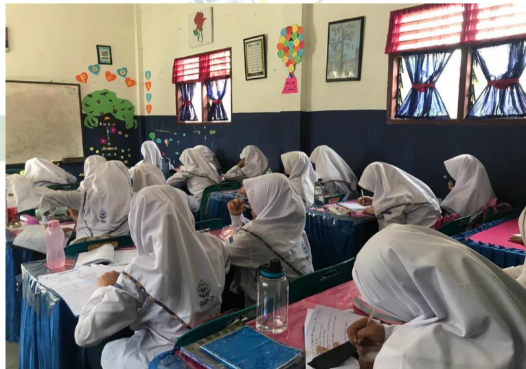
Gambar 14. Ruang Kelas Reguler PR SMP IT Nurul Hadina