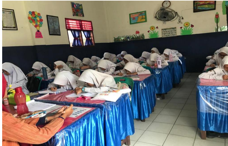
Gambar 13. Ruang Kelas Reguler PR SMP IT Nurul Hadina