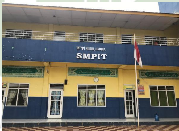
Gambar 2. Bangunan Sekolah SMP IT Nurul Hadina