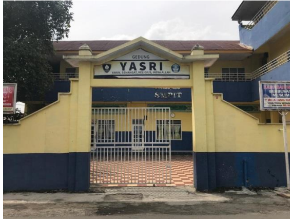
Gambar 1. Tampak Depan SMP IT Nurul Hadina