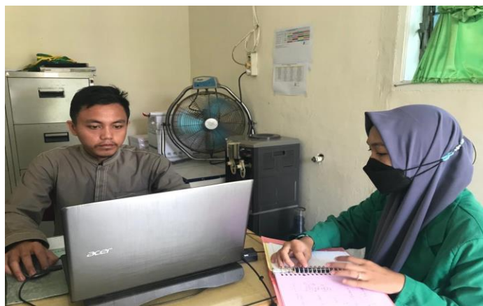
Gambar 18. Wawancara Bersama Staf Tata Usaha SMP IT Nurul Hadina