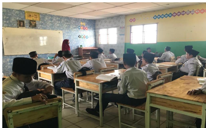
Gambar 12. Ruang Kelas Reguler LK SMP IT Nurul Hadina