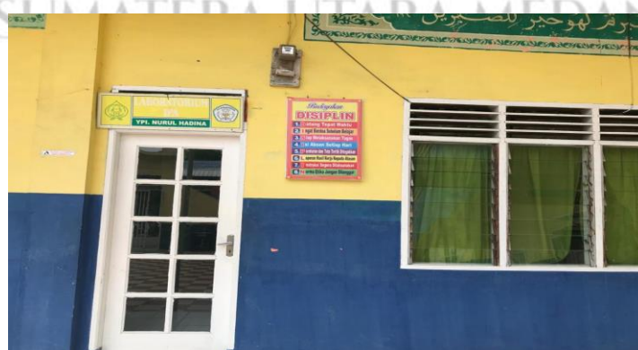
Gambar 6. Laboratorium IPA SMP IT Nurul Hadina