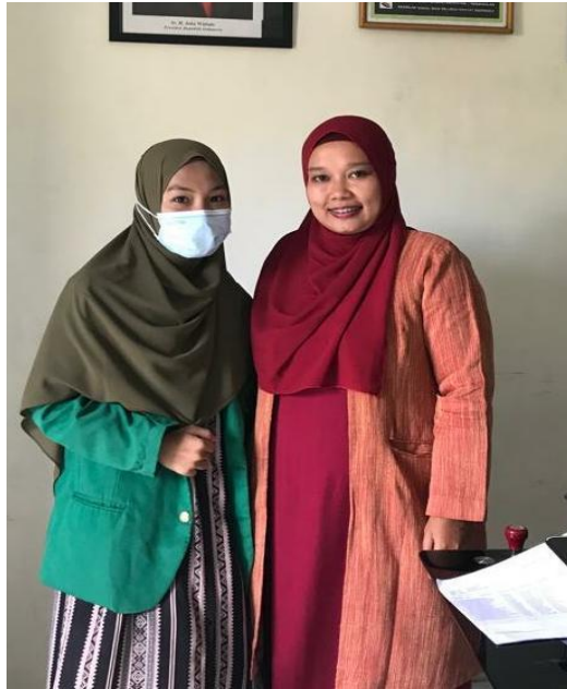
Gambar 16. Foto Bersama Kepala Sekolah SMP IT Nurul Hadina