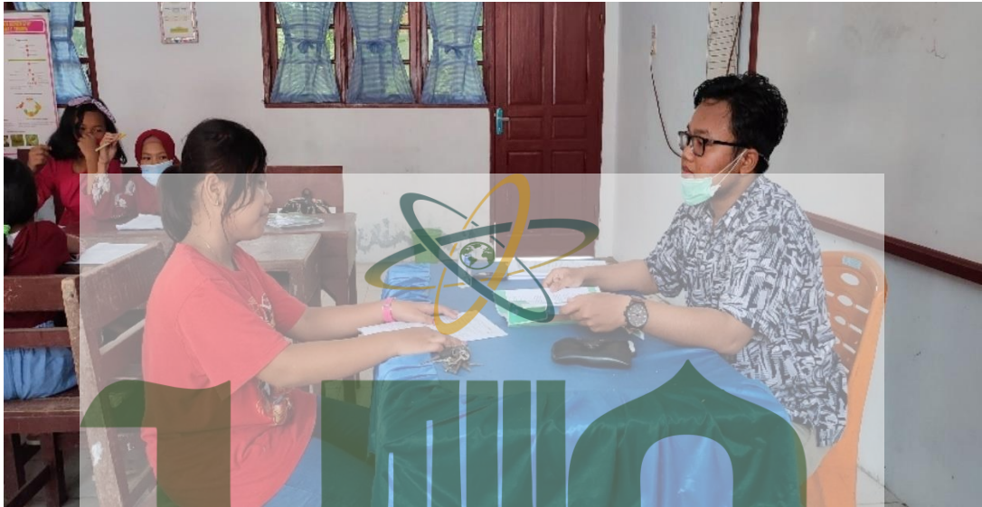
Gambar 1 : wawancara peserta didik

Gambar 1.5 Wawancara peserta didik SUMATERA UTARA MEDAN