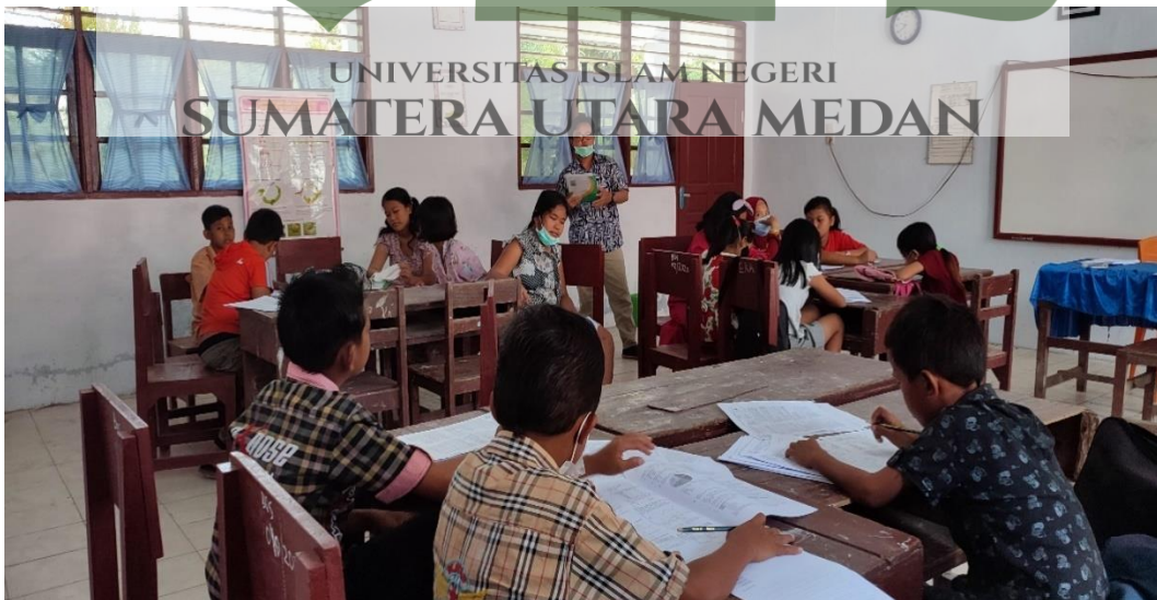
Gambar 4 : dokumentasi diskusi kelompok