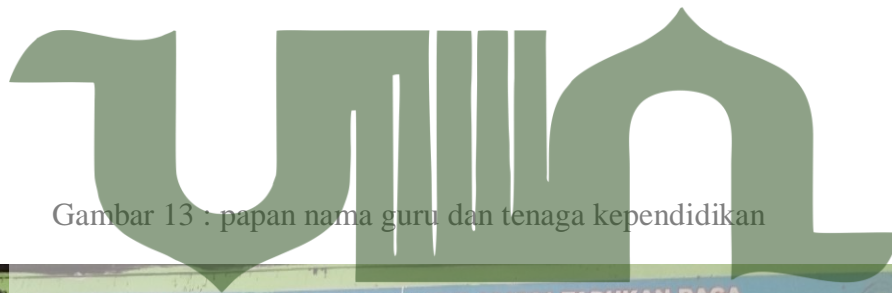
Gambar 13 : papan nama guru dan tenaga kependidikan