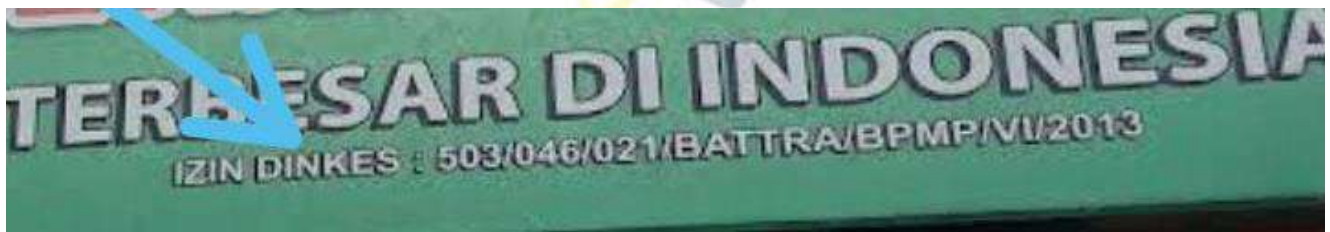
Nomor Izin Dinas Kesehatan Berdirinya Klinik Bekam PBR Kota Medan