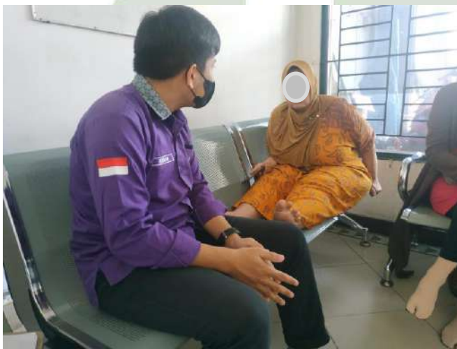
Wawancara awal Dengan penderita hipertensi (A, 52 Tahun)