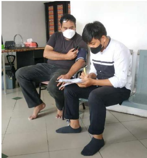
(RP, 38 Tahun)