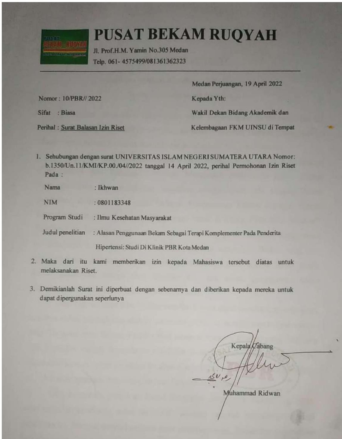
Lampiran 5.2 Surat Balasan Penelitian Klinik PBR Kota Medan