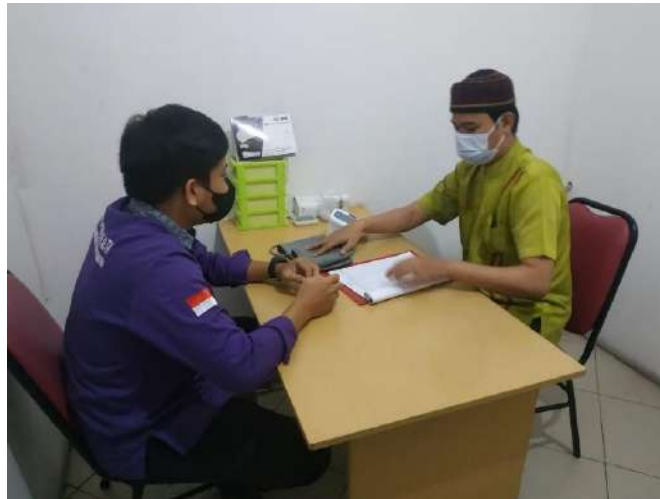
Wawancara awal dengan kepala cabang sekaligus terapis bekam (MR, 29 Tahun)