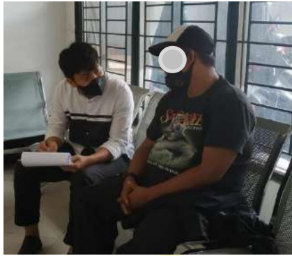
Wawancara mendalam dengan Informan Utama (Penderita Hipertensi yang menggunakan bekam [TD, 44 Tahun])