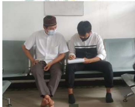
Wawancara mendalam dengan Informan Kunci (Kepala Cabang [MR, 29 Tahun])