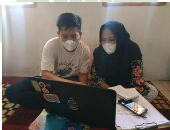
Proses Triangulasi Analisi dengan teman asal Unimed