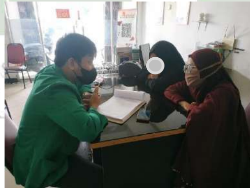
Wawancara mendalam dengan Informan Pembantu (Terapis Bekam [AD, 27 Tahun], [YN, 20 Tahun])