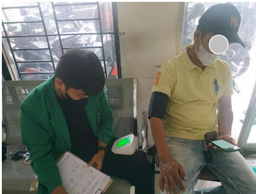
(RM, 46 Tahun)