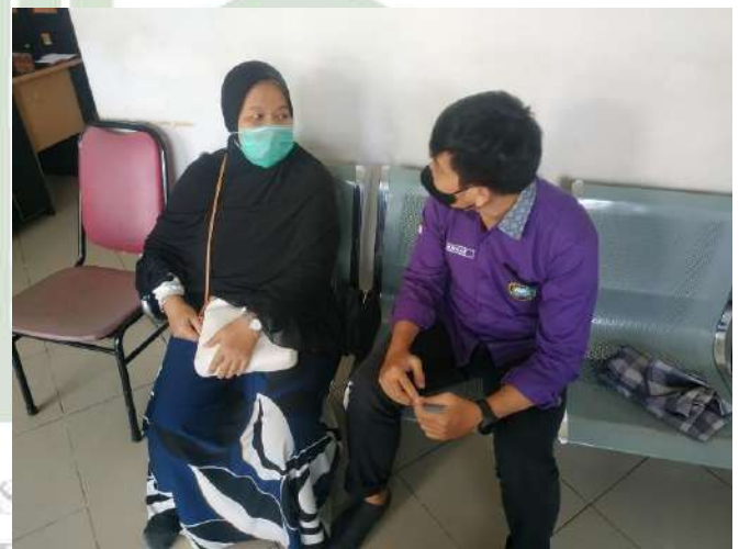
Wawancara awal Dengan penderita hipertensi (HS, 46 Tahun)