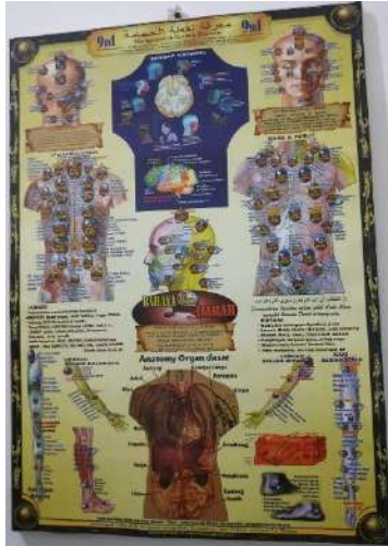
Poster Bekam Klinik Bekam PBR Kota Medan