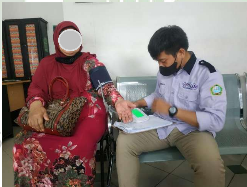
(RS, 65 Tahun)