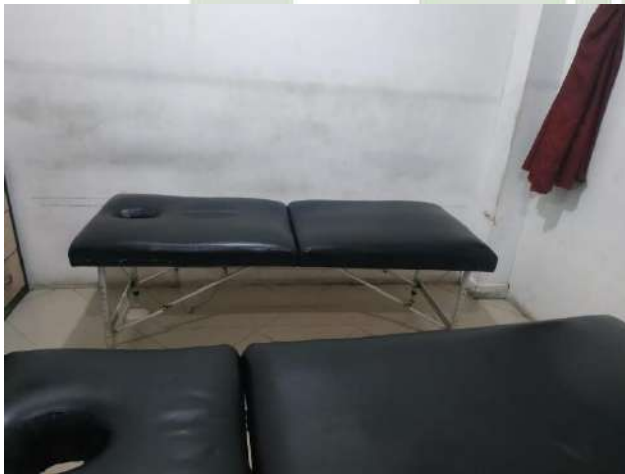
Ruangan saat terapi bekam

(Kop, alkohol, minyak zaitun, pompa, jarum (sekali pakai), lancet, sarung tangan (sekali pakai) dan tisu.