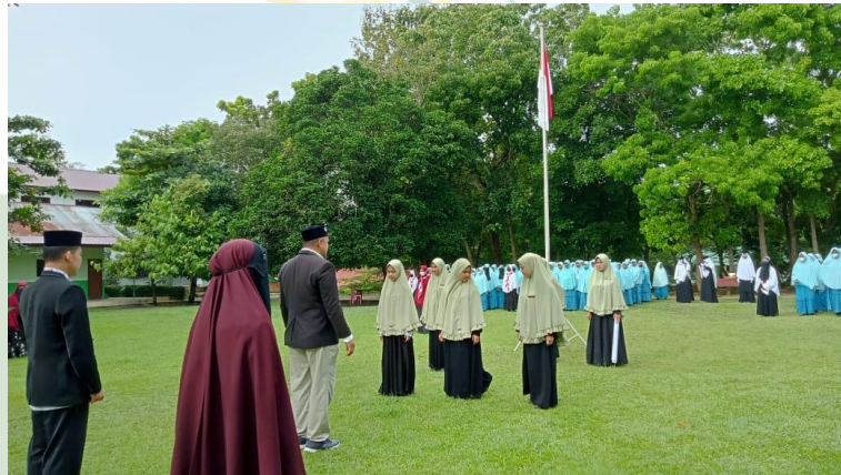
Gambar 7 Foto Kegiatan Apel Pagi