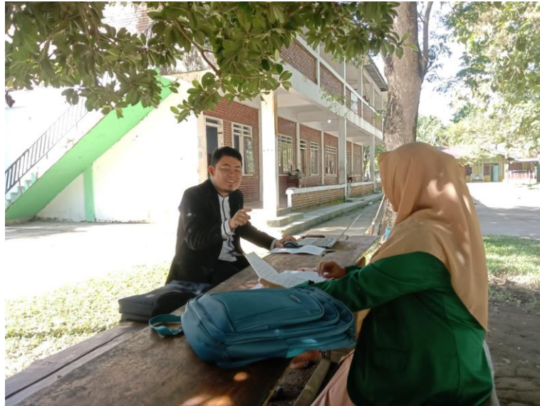
Gambar 1 Wawancara Bersama Kepala Madrasah MTs Hidayatullah