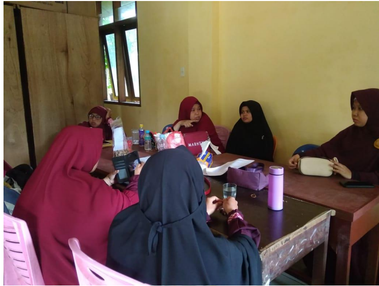
Gambar 6 Foto Rapat Guru MTs Hidayatullah