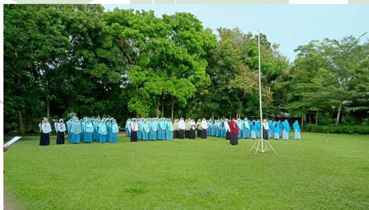
Gambar 8 Foto Kegiatan Apel Pagi