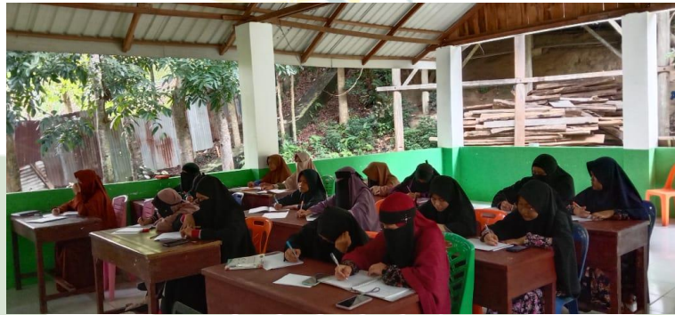
Gambar 4 Ruang Kelas MTs Hidayatullah