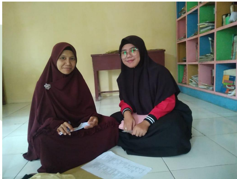
Gambar 2 Foto Bersama Guru MTs Hidayatullah