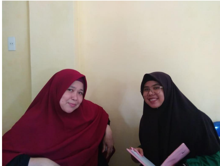
Gambar 3 Foto Bersama Guru MTs Hidayatullah