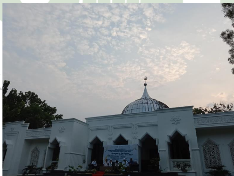
Gambar 11 Masjid