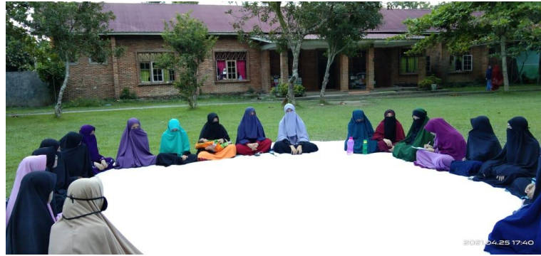
Gambar 9 Halaman Asrama Putri