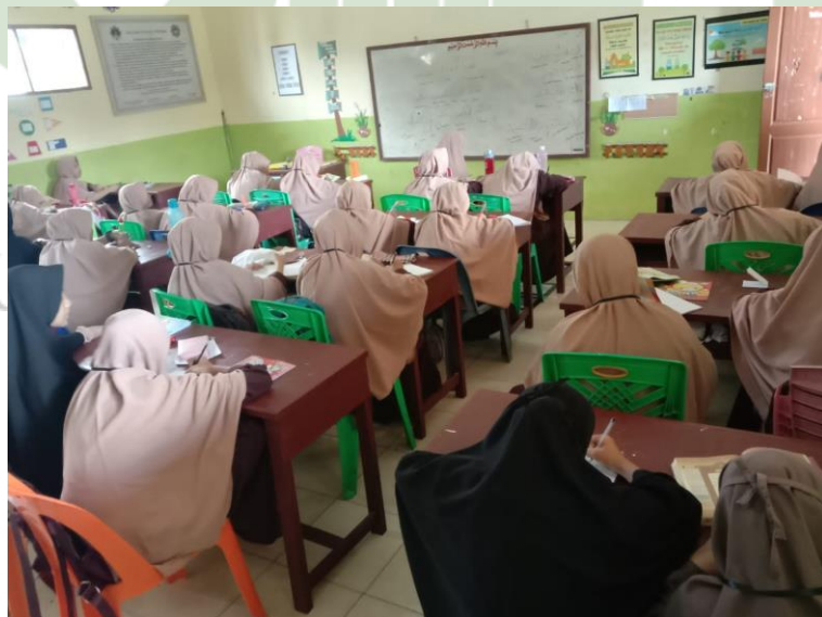
Gambar 5 Ruang Kelas MTs Hidayatullah