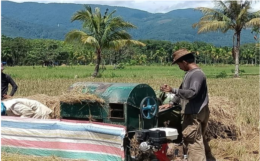
Proses Prontokan Burir Padi