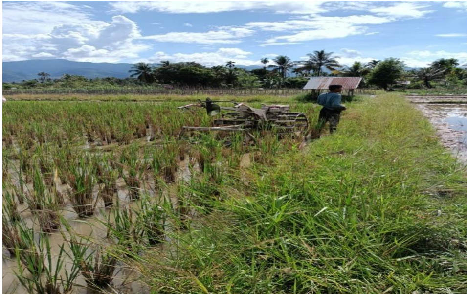
Wawancara Dengan Pak Rahman ( Tukang Bajak Sawah ) pada tanggal 11 april 2021 berada di lokasi tempat sawah yang akan dibajak