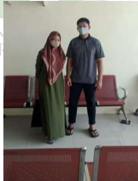
Dokumentasi Wawancara dengan Klien yang Menjalani Program Rehabilitasi Rawat jalan