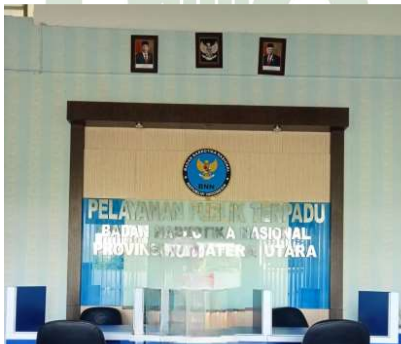
Kantor Pelayanan Badan Narkotika Nasional Provinsi Sumatera Utara