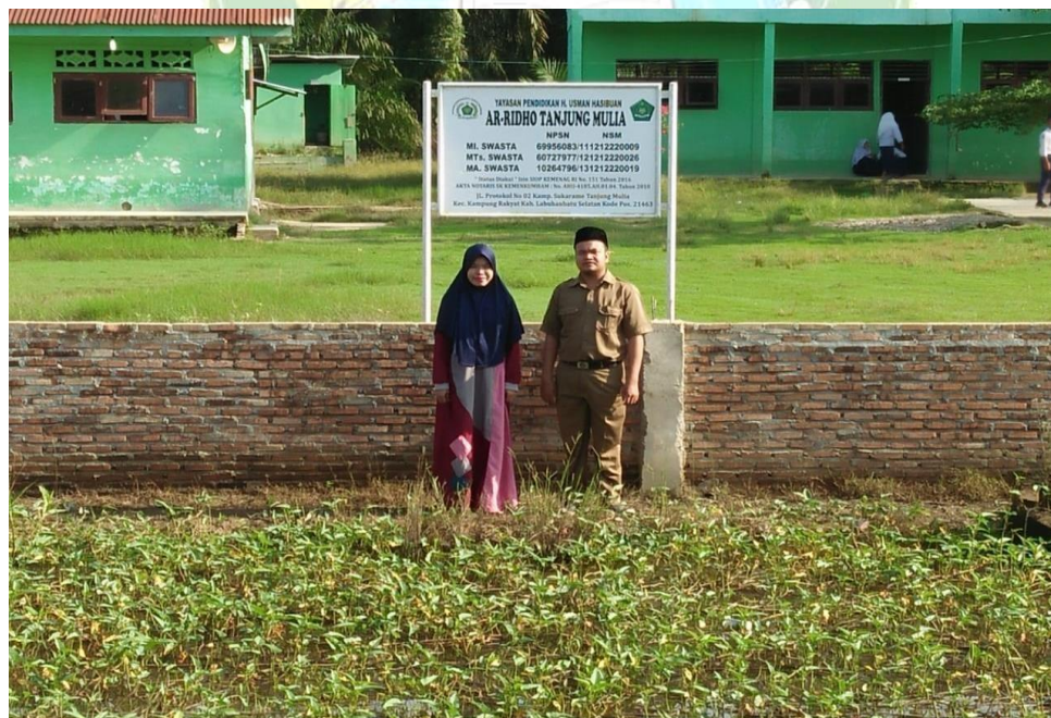
Photo Tampak Depan Sekolah MTs.S Ar Ridho Tg. Mulia