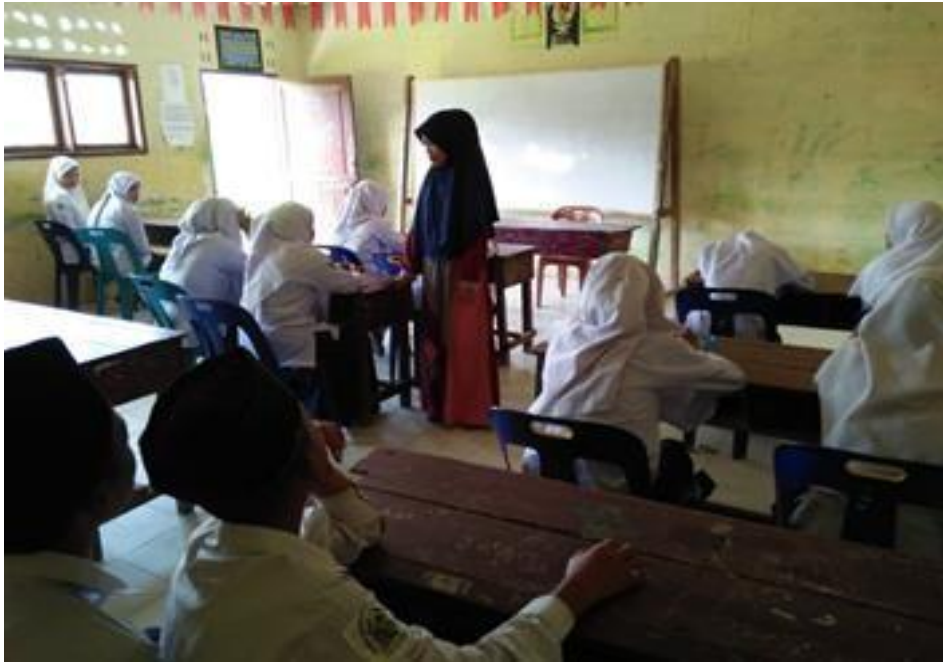
Kegiatan Belajar dan Mengajar di MTs.S Ar Ridho Tg. Mulia