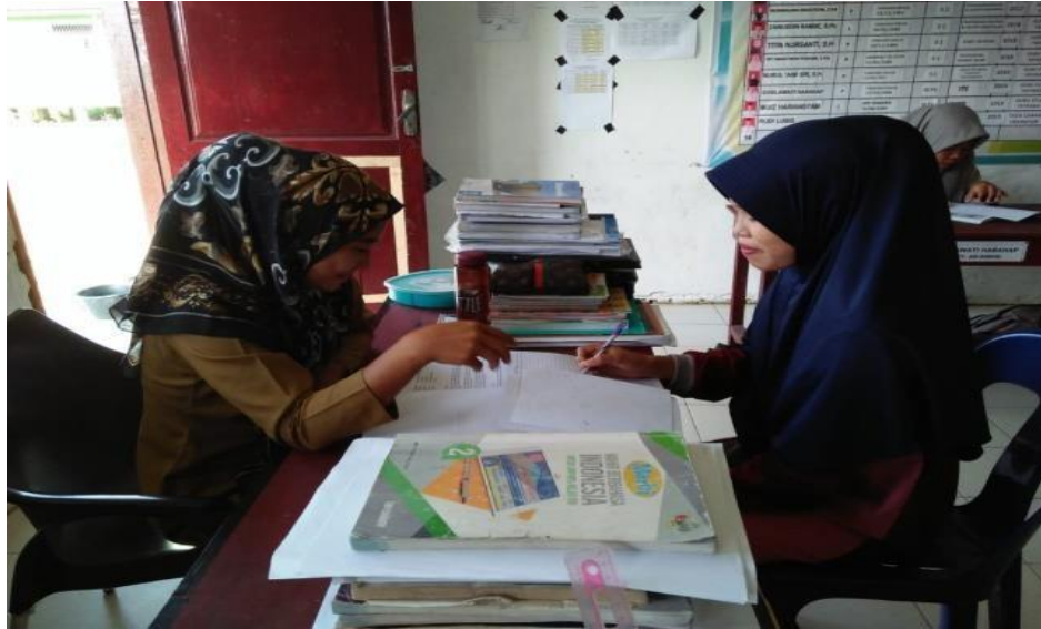
Hasil Wawancara Dengan Guru Bidang Study MTs.S Ar Ridho