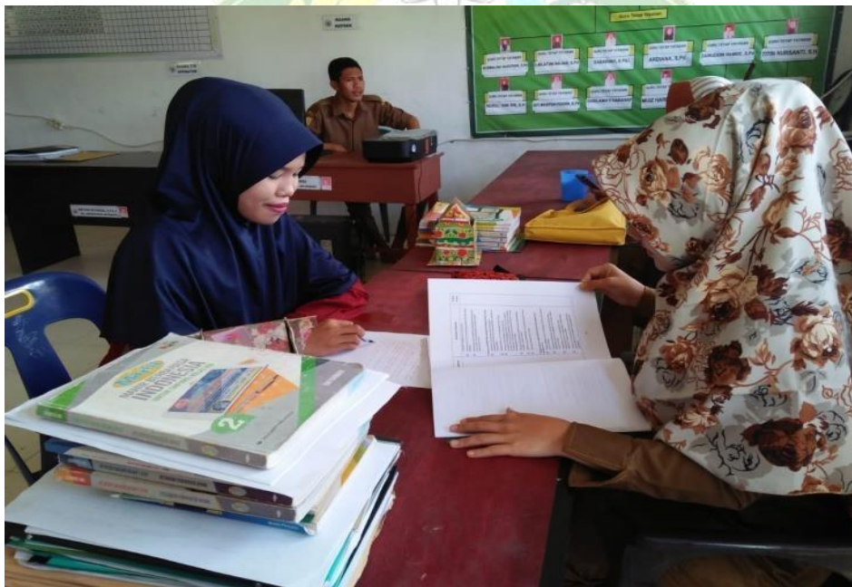
Wawancara Dengan Dewan Guru MTs.S Ar Ridho