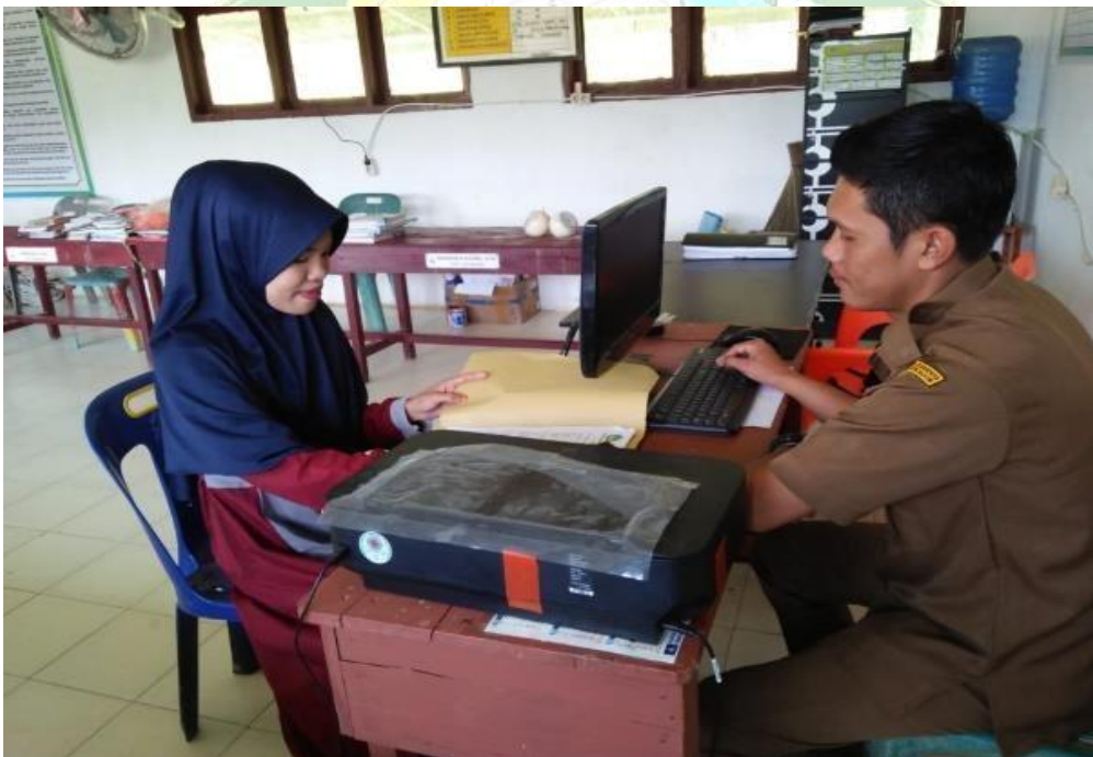
Observasi Wawancara Dengan Staf TU/Operator MTs.S Ar Ridho