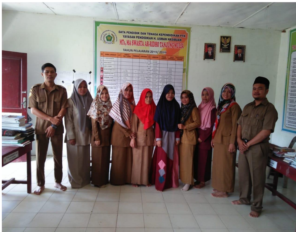
Photo Bersama Kepala Sekolah dan Dewan Guru MTs.S Ar Ridho Tg. Mulia