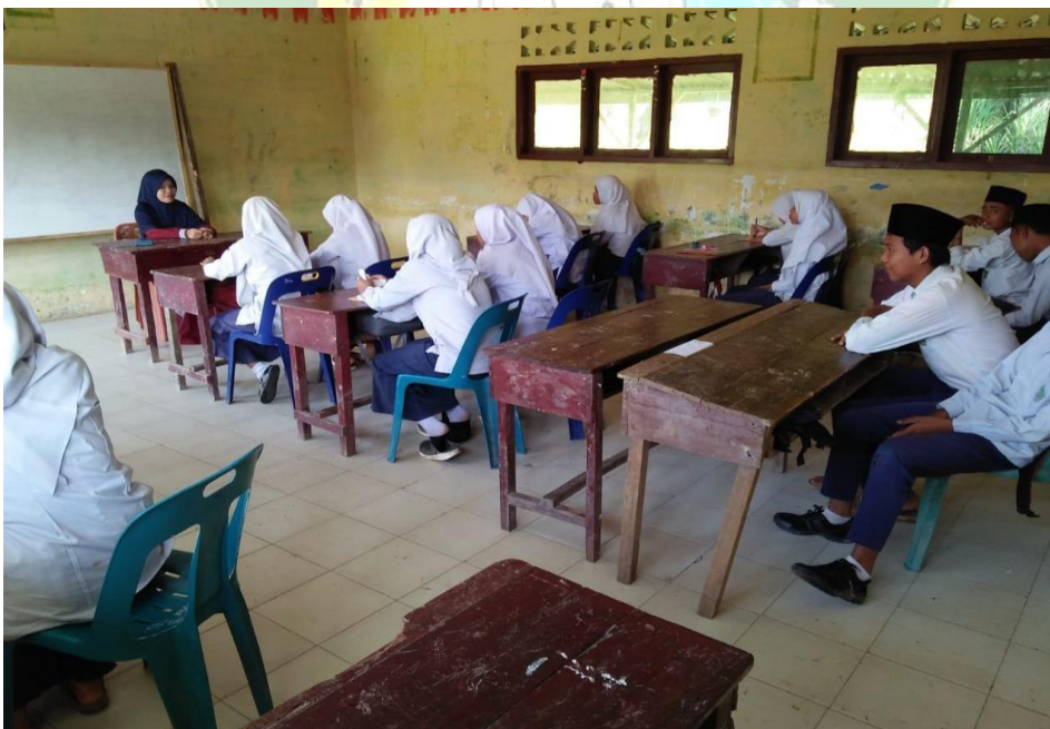
Study Lapangan Belajar dan Mengajar di MTs.S Ar Ridho Tg. Mulia