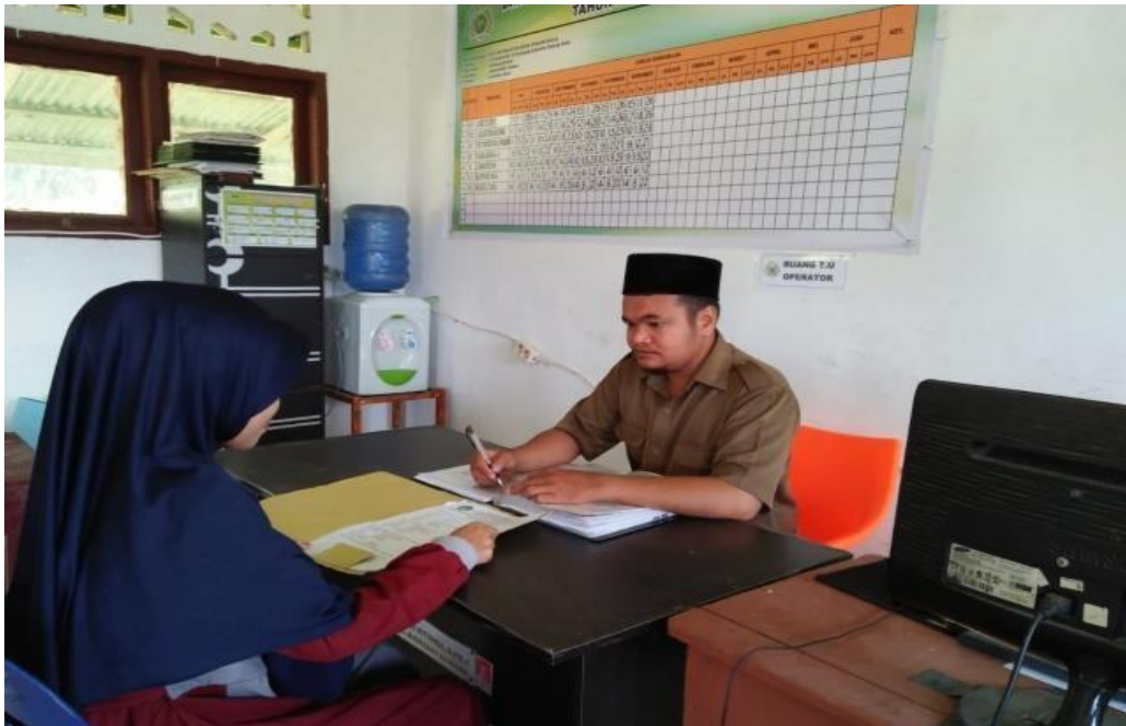
Observasi Wawancara Dengan Kepala Sekolah MTs.S Ar Ridho