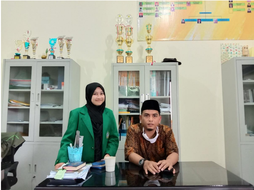
Gambar 8. Wawancara Bersama Kepala Sekolah