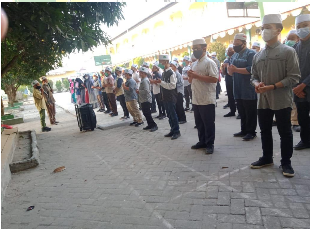
Gambar. 7 Kegiatan Dipagi Hari Mengaji dan Berdoa