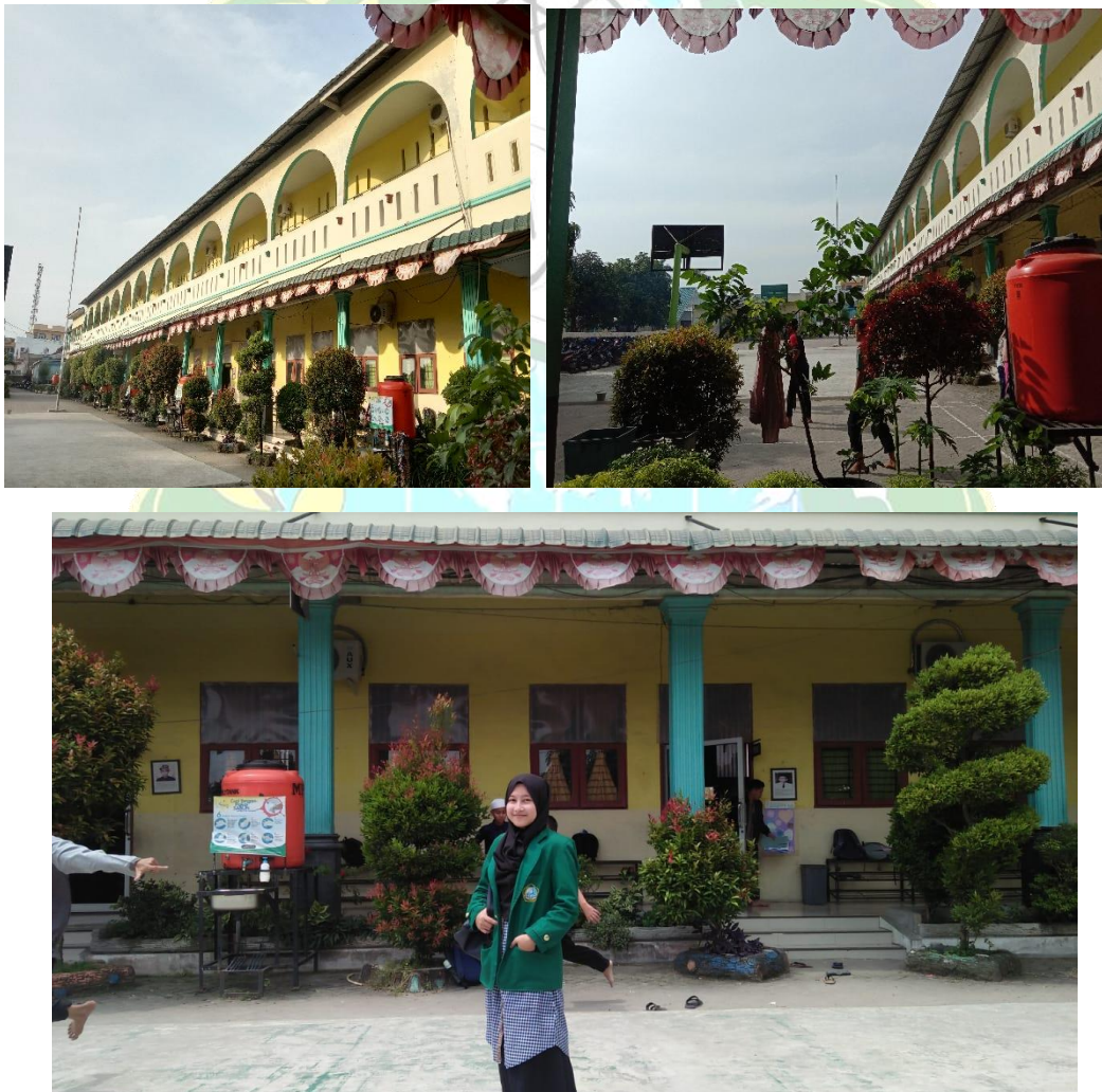
Gambar 2. Gedung SMP IT Al Hijrah Deli Serdang