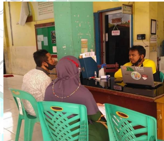
Gambar 5. Meja Piket