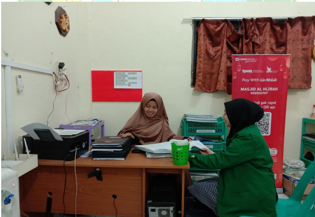
Gambar 9. Wawancara Guru Bahasa Indonesia