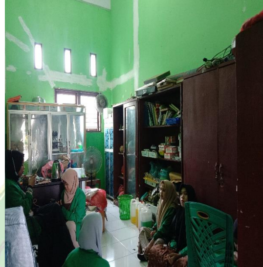
Gambar 4. Ruang Sapras