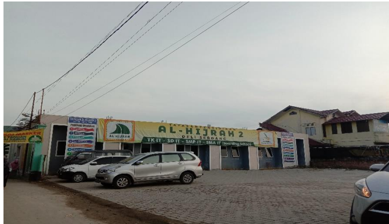
Gambar 1. Tampak Depan SMP IT Al Hijrah