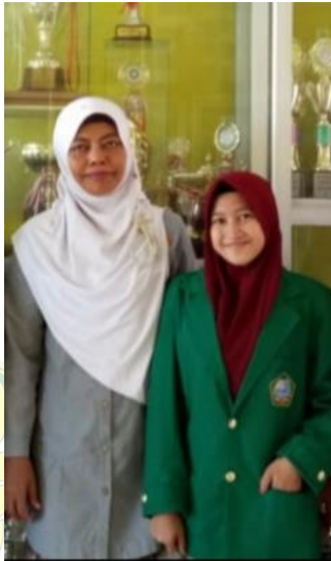
Gambar 10. Wawancara Bersama Wakil Kepala Sekolah Bidang Kesiswaan