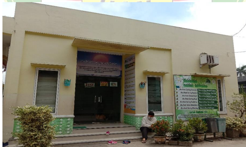
Gambar 6. Ruang Kelas SMA