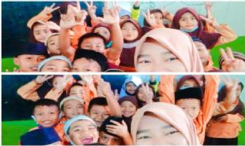
Dokumentasi siswa belajar Bahasa Indonesia dengan strategi reading guide