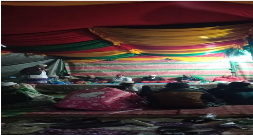
Zikir Ratib Seribe (Seribu) Yang Berlangsung Di Rumah Masyarakat Desa