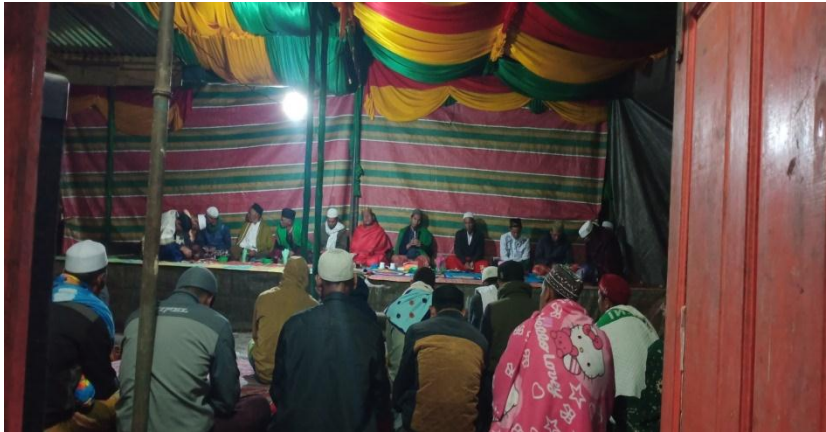
Para Jamaah Anggota Zikir Sedang Melaksanakan Zikir Ratib Seribe (Seribu)