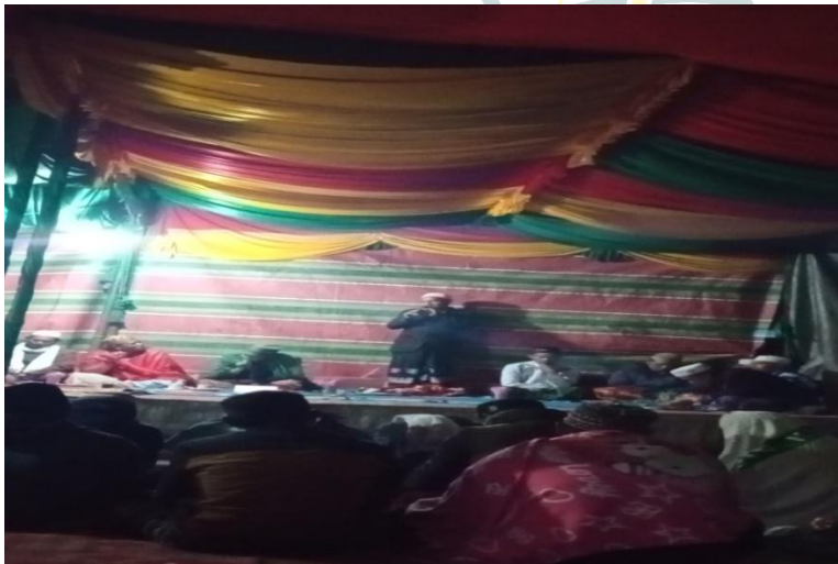
Para Jamaah bapak-bapak Sedang Melaksanakan Zikir Ratib Seribe (Seribu)