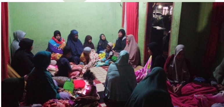
Para Jamaah Ibu-Ibu Sedang Melaksanakan Zikir Ratib Seribe (Seribu)