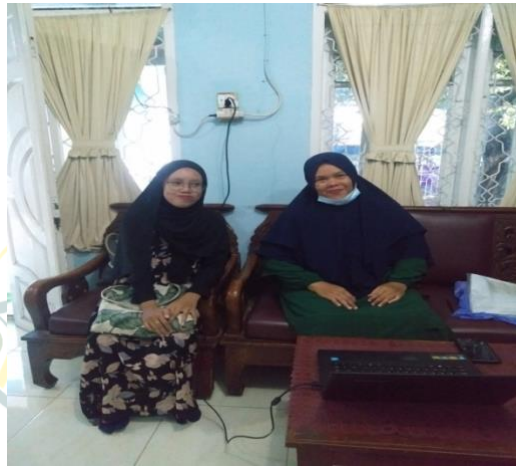
Wawancara bersama Kepala Sekolah

UNIVERSITAS ISLAM NEGERI SUMATERA UTARA MEDAN