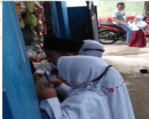
Kantin MIS Hidayatussalam