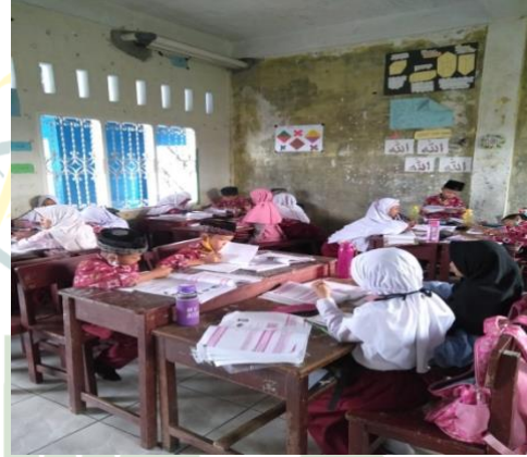
Kegiatan sebelum belajar menghafal siswa/i sedang mengerjakan tugas