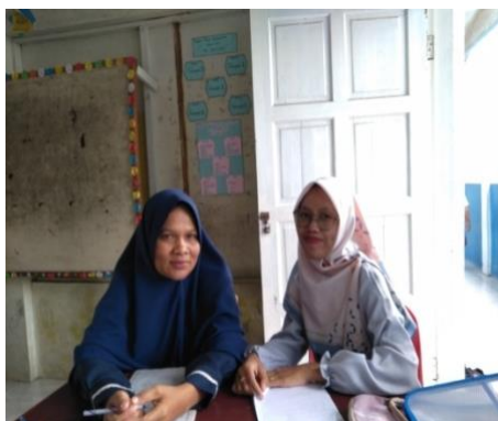
Wawancara bersama Wali Kelas IV-A