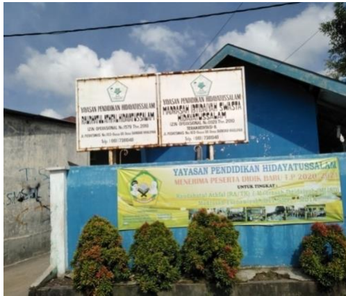
Profil MIS Hidayatussalam