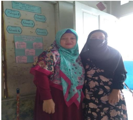
Wawancara bersama Wali Kelas IV-C