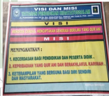
Visi-Misi MIS Hidayatussalam