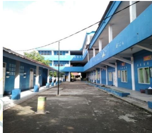
Halaman/lapangan MIS Hidayatussalam