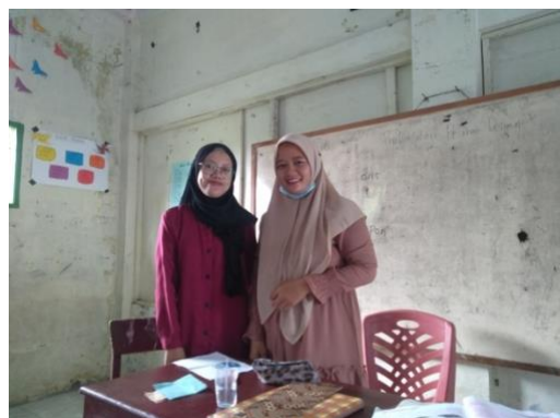
Wawancara bersama Wali Kelas IV-B