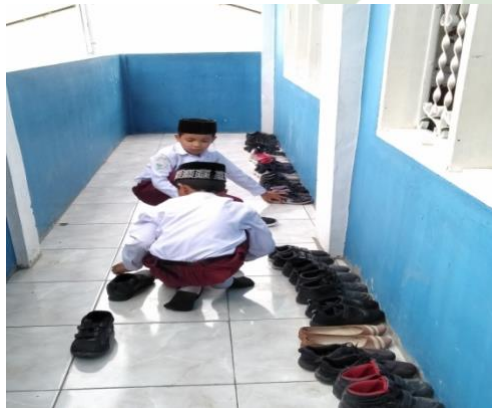
Siswa menyusun sepatu teman dan guru bagi yang bertugas piket