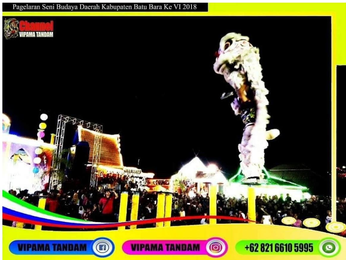
Festival Seni Budaya Daerah