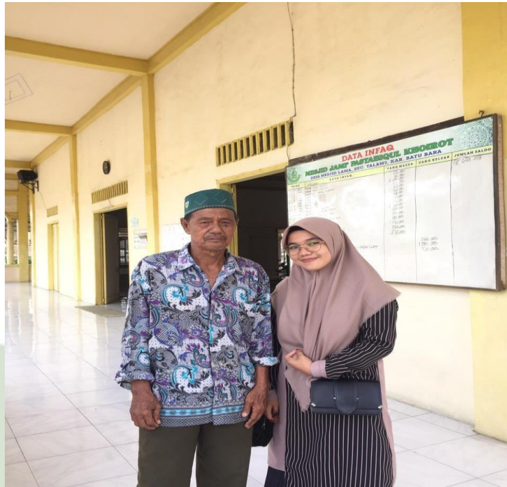
Gambar 3. Pengurus Masjid Lama Kec. Talawi, Kab. Batu Bara