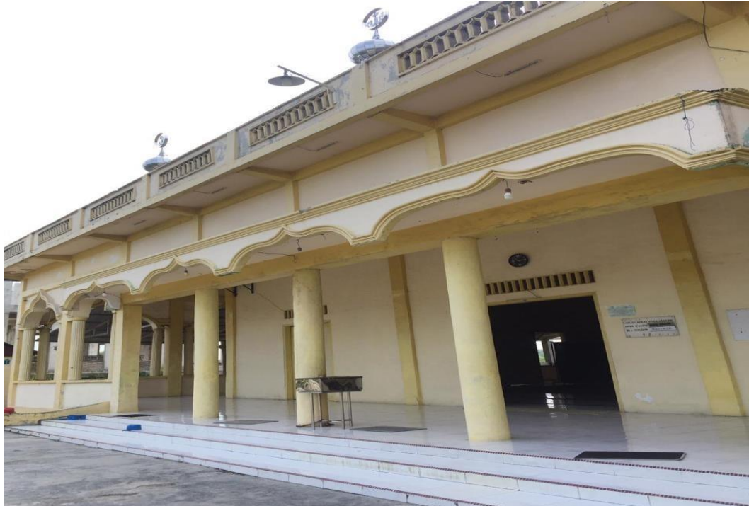
Gambar 1. Masjid Lama Kec. Talawi, Kab. Batu Bara