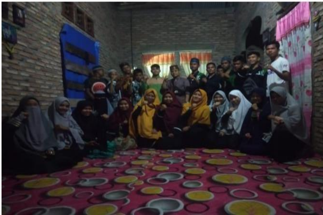
Gambar 2. Pelaksanaan kajian rutin