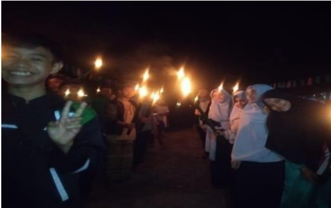
Gambar 5. Kegiatan Menyambut bulan Ramadhan oleh DPD GPMI