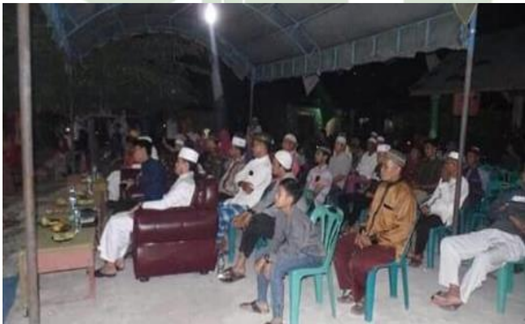
Gambar 6. Kegiatan Satu Muharram oleh DPD GPMI