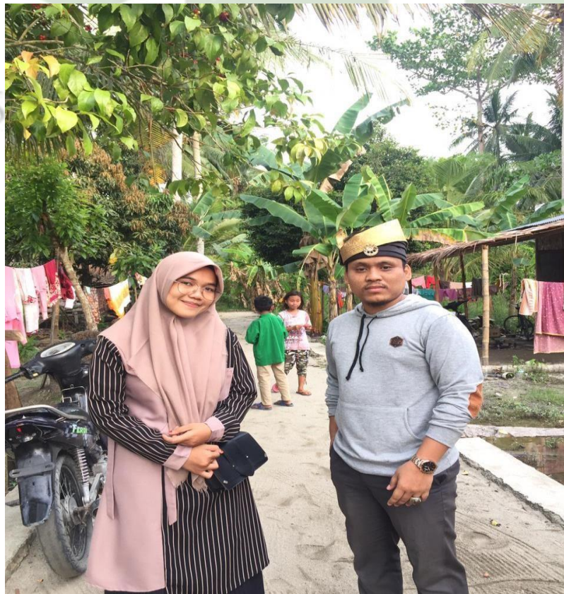
Gambar 3. Ketua DPD GMPI Kabupaten Batu Bara