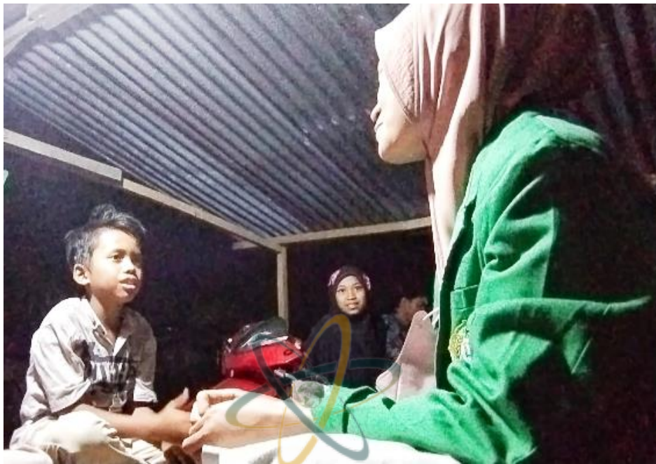
Wawancara dengan Dirly