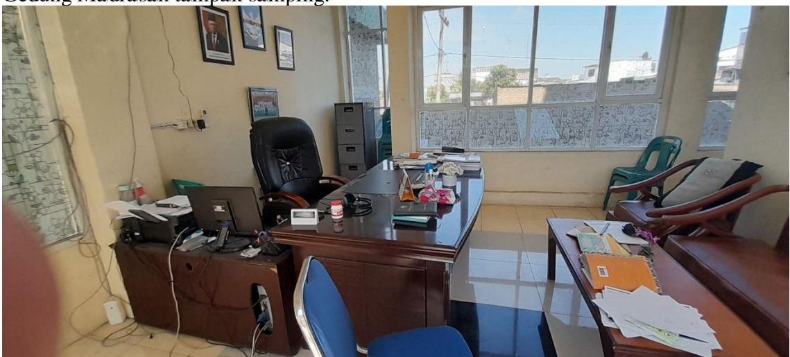
Kantor Kepala Madrasah.