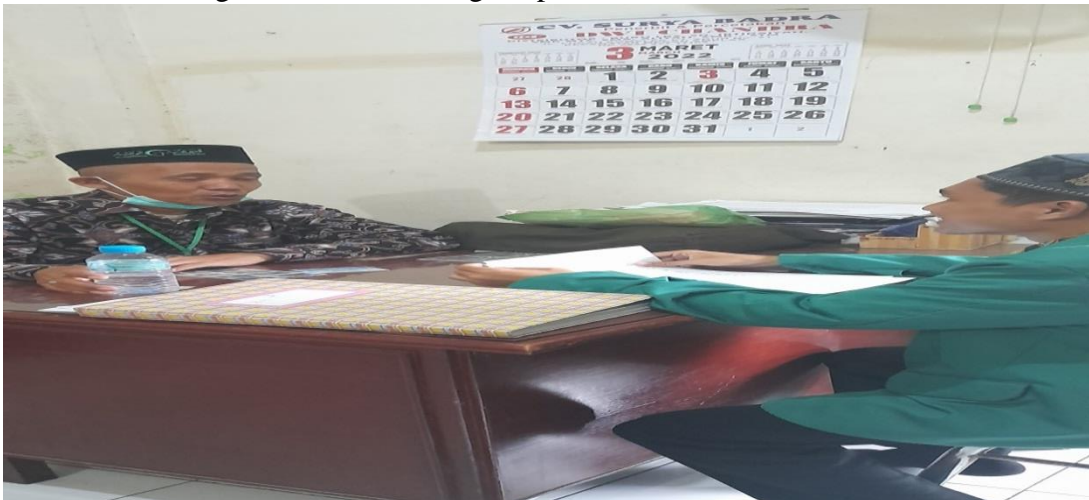
Wawancara dengan WKM III Bidang Kesiswaan.