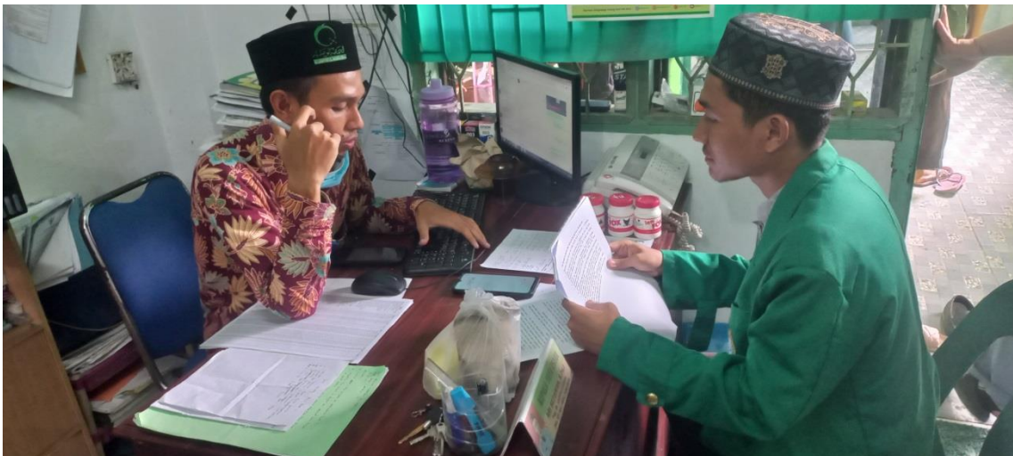
Wawancara dengan Kepala Tata Usaha.