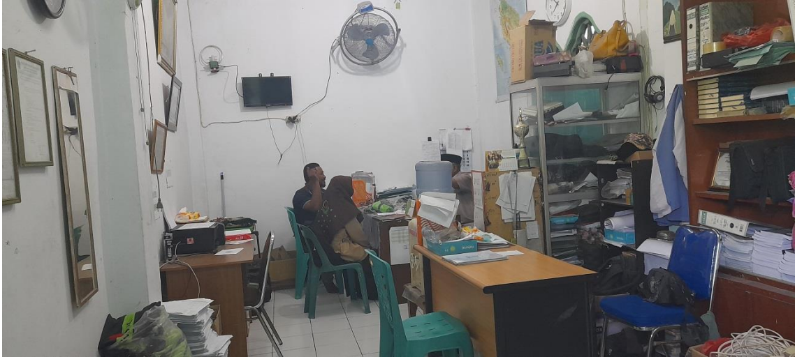
Kantor WKM/Tata Usaha.