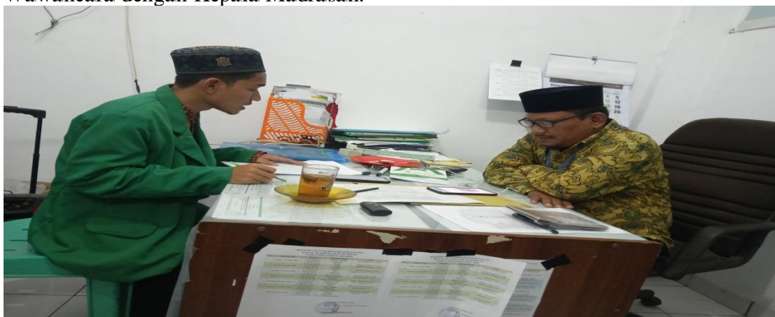
Wawancara dengan WKM I Bidang Kurikulum.