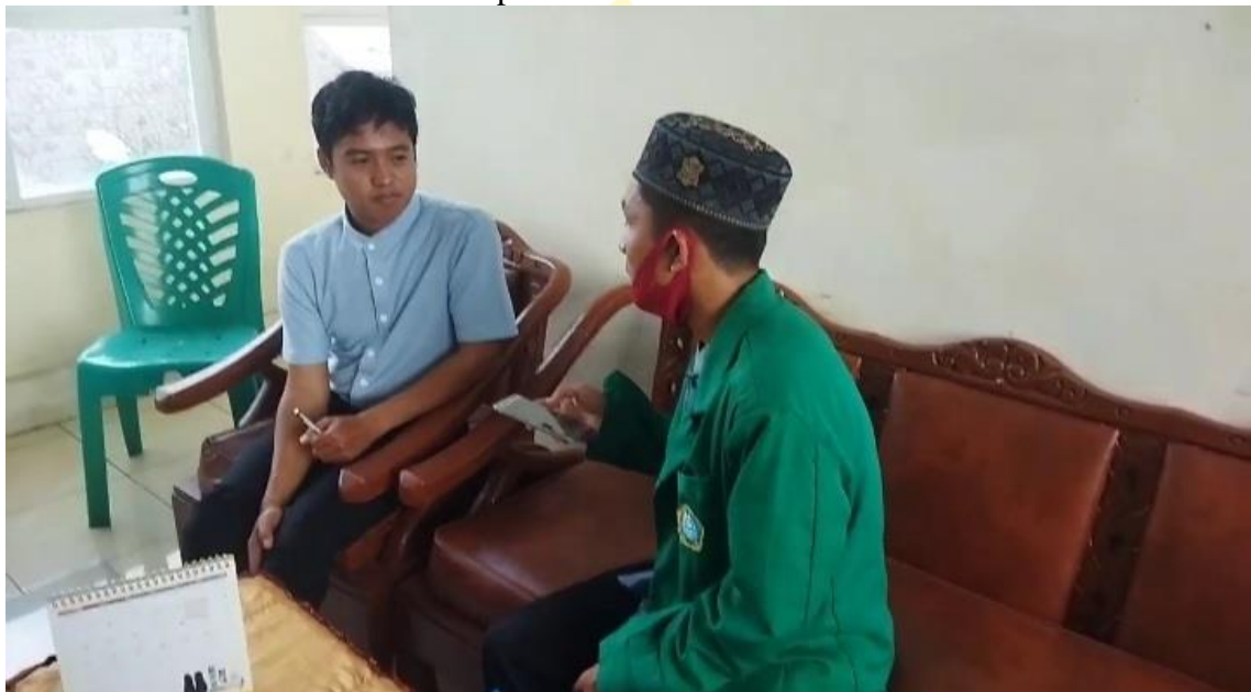
Wawancara dengan Kepala Madrasah.