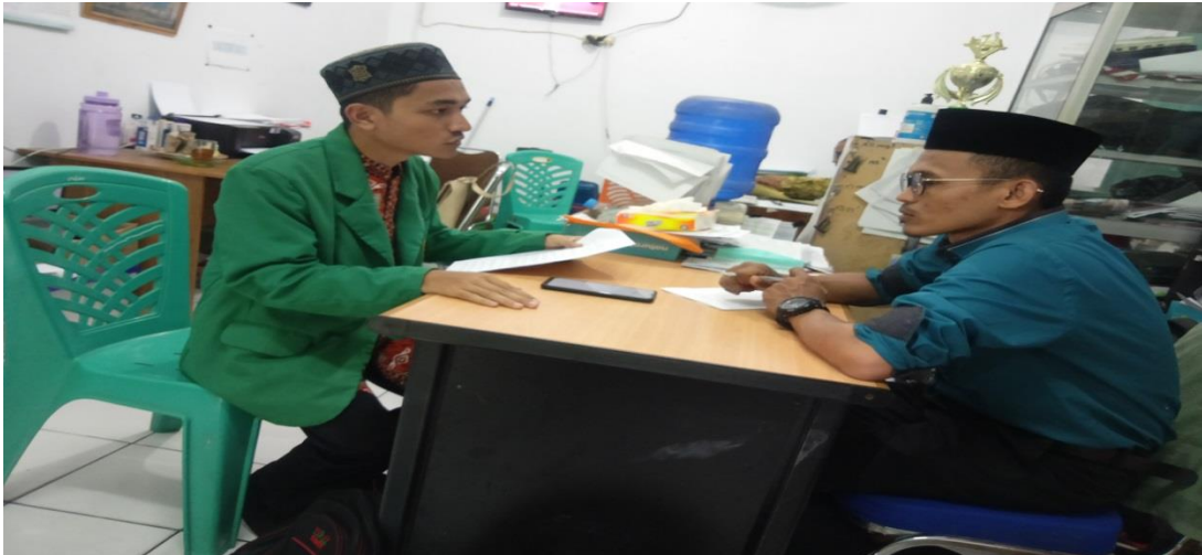
Wawancara dengan WKM II Bidang Sarpras.