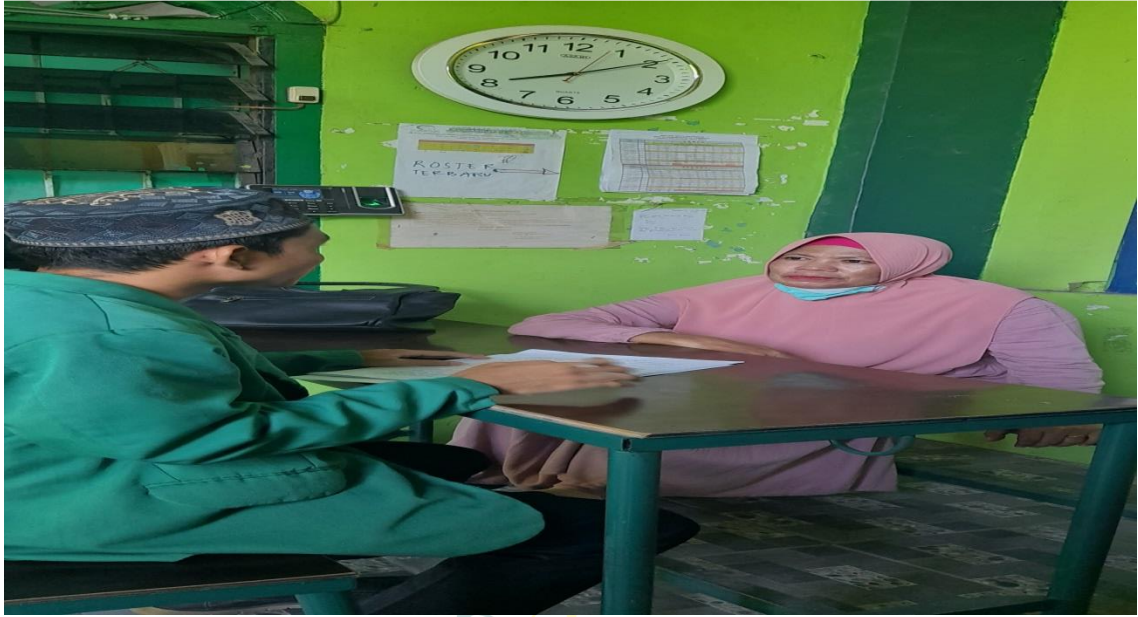
Wawancara dengan Wali Kelas/Guru Bidang Studi Bahasa Indonesia.