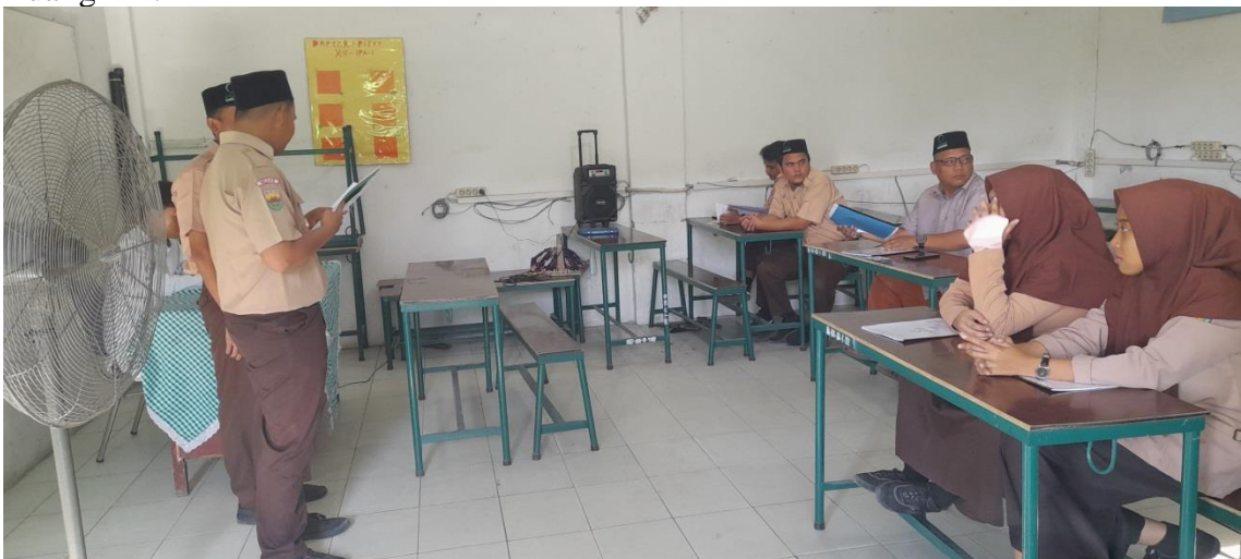
Kegiatan Tugas Akhir Karya Ilmiah Siswa.