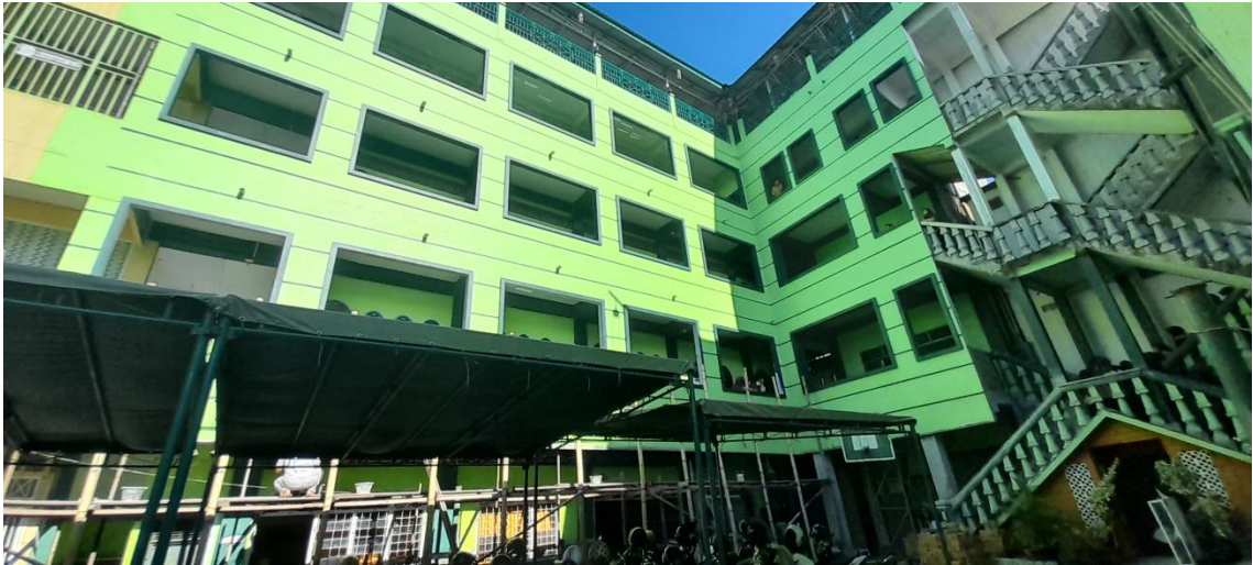
Gedung Madrasah tampak depan.