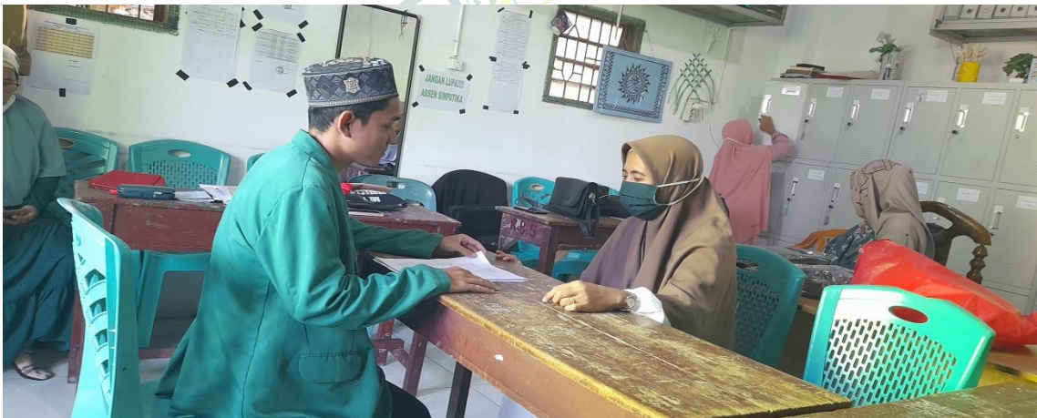
Wawancara dengan Wali Kelas/Guru Bidang Studi Matematika.