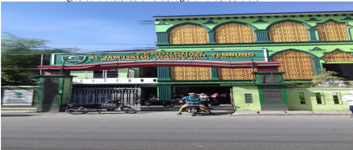
Tampak depan Pagar masuk pintu utama madrasah