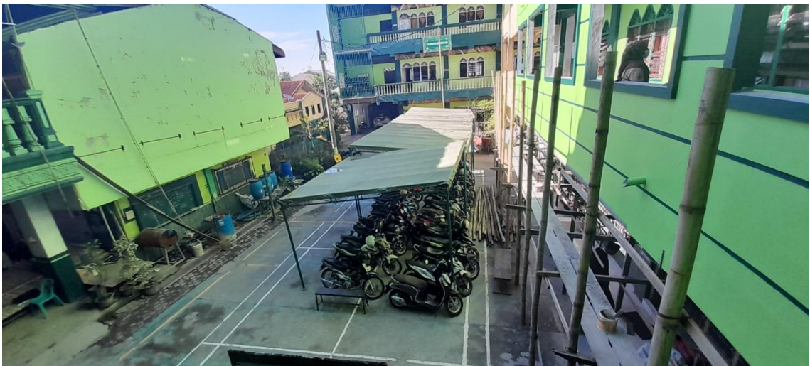
Gedung Madrasah tampak samping.