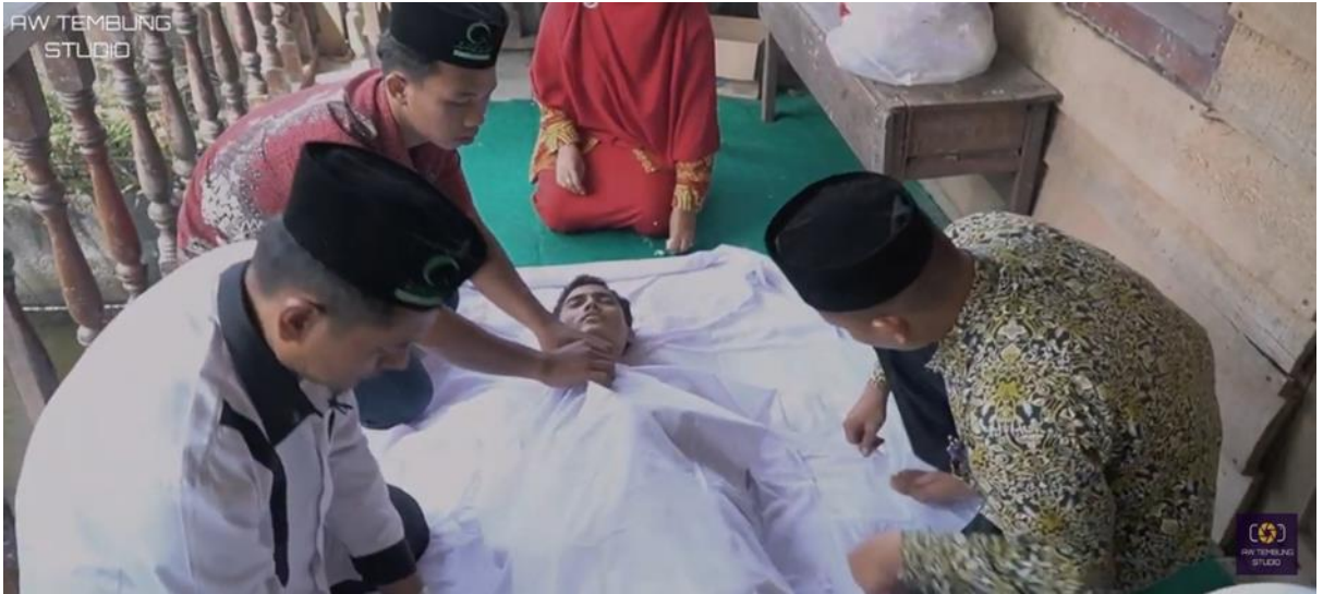
Pelatihan Praktek Fardu Kifayah.