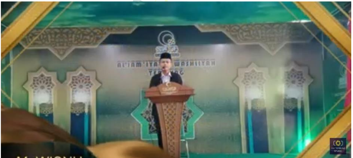
Lomba dan Sekaligus Pelatihan Praktek Khutbah Jum'at Dalam Rangka HUT Al-Washliyah yang ke-90.