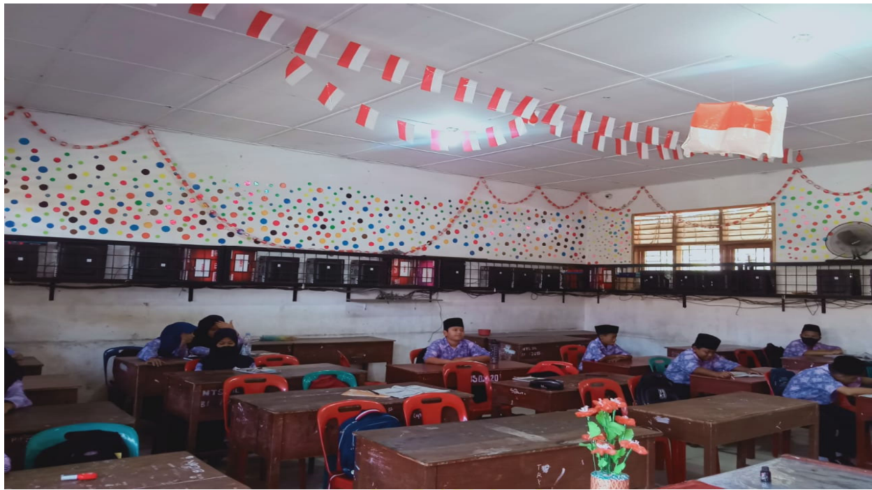
Laboratorium komputer MTs Darul Ilmi Batang Kuis