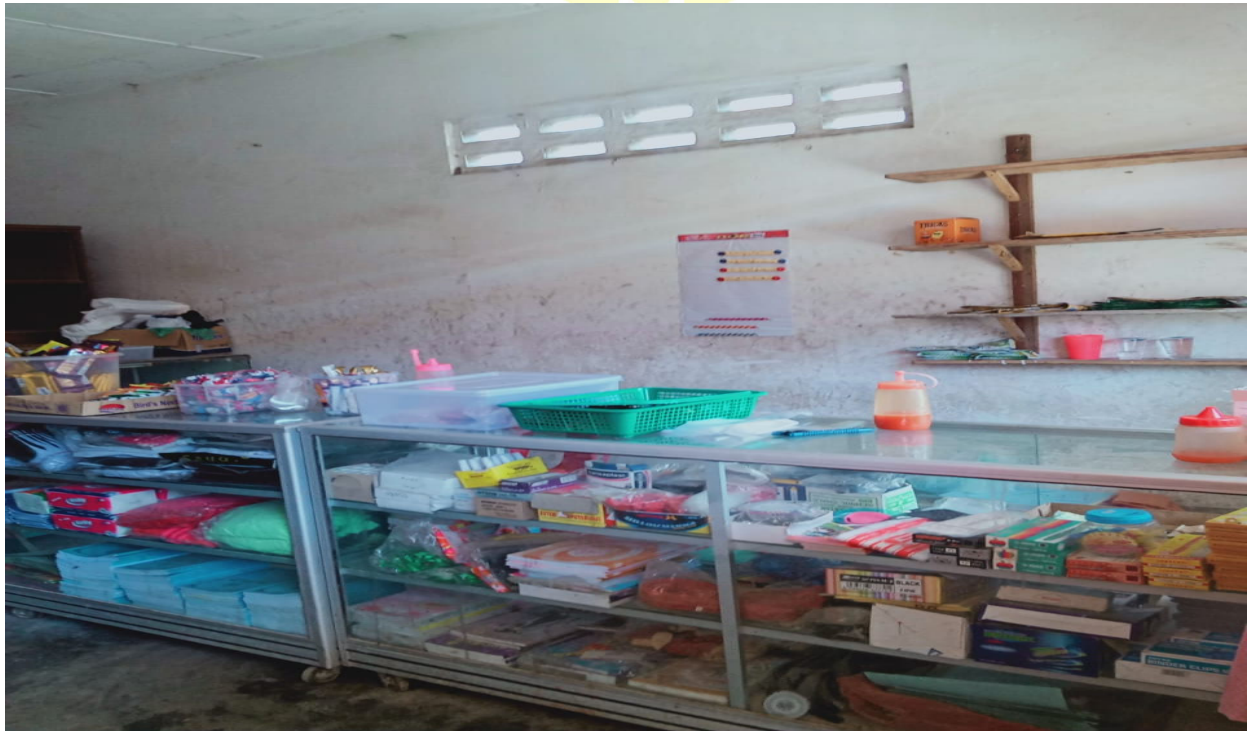
Kantin MTs Darul Ilmi Batang Kuis