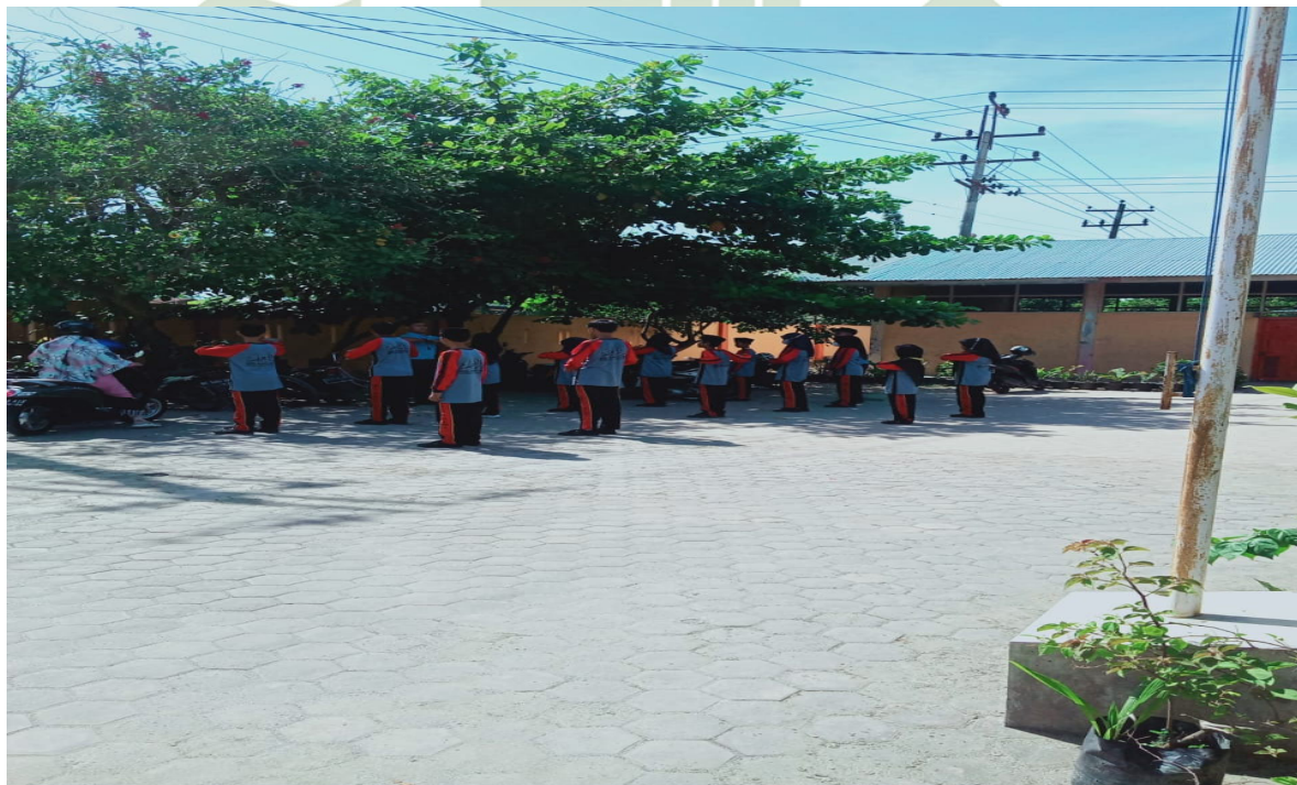
Halaman depan MTs Darul Ilmi Batang Kuis