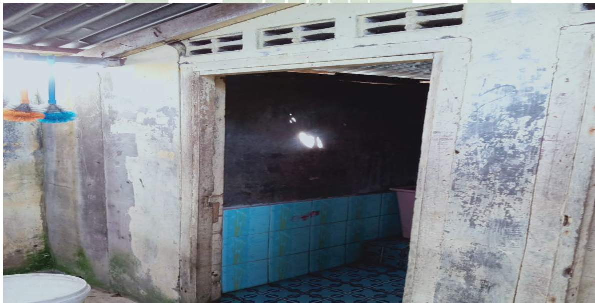
Kamar mandi MTs Darul Ilmi Batang Kuis