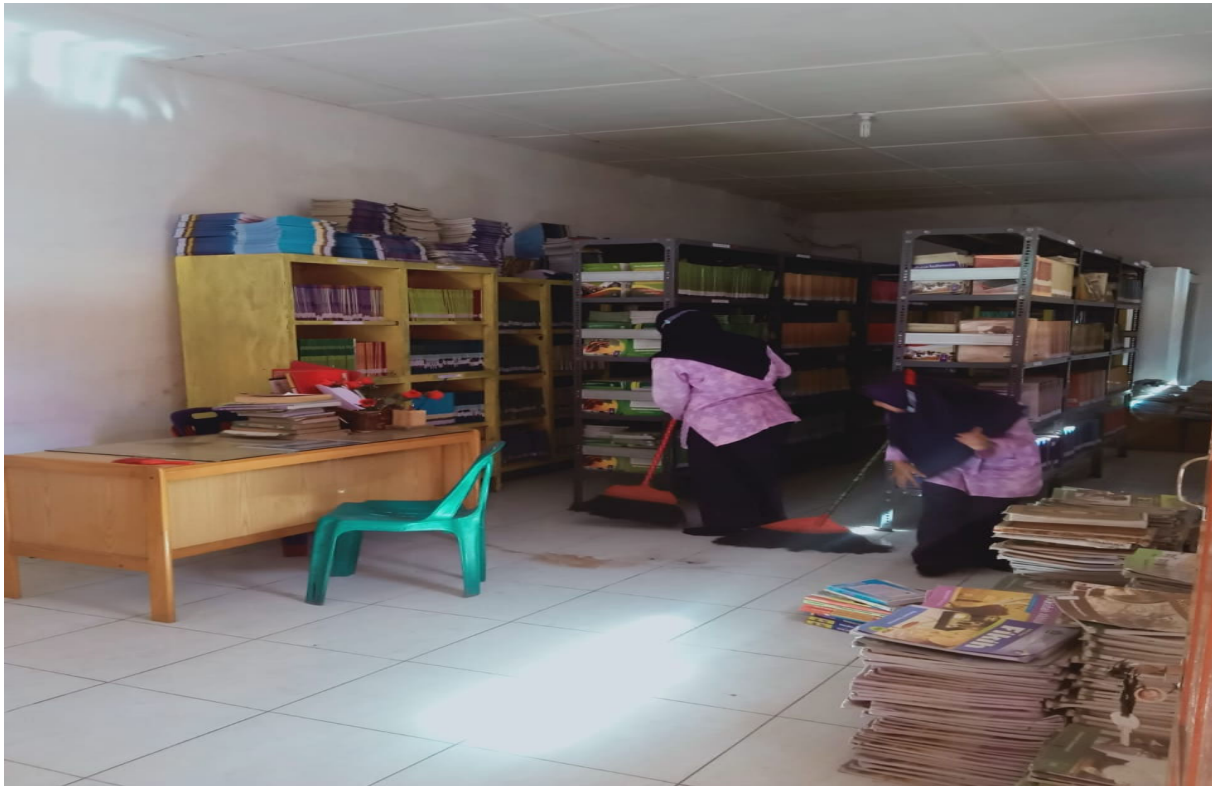
Perpustakaan sekolah MTs Darul Ilmi Batang Kuis