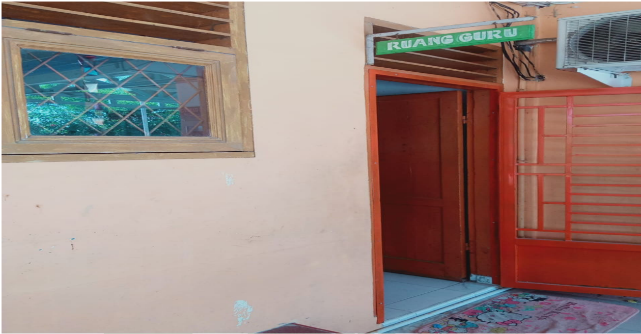
Depan ruang guru MTs Darul Ilmi Batang Kuis