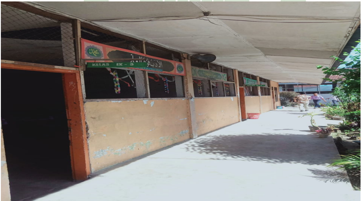
Depan ruang kelas MTs Darul Ilmu Batang Kuis