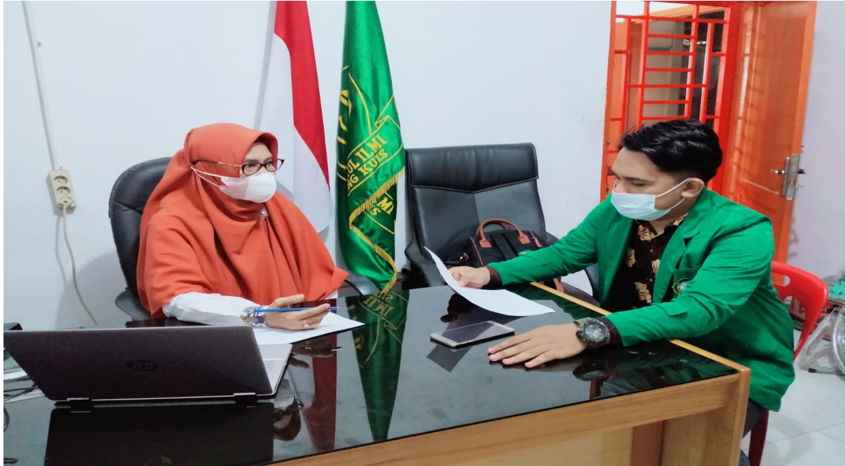
Wawancara dengan Ibu Kepala MTs Darul Ilmi Batang Kuis