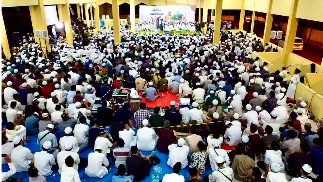
Gambar 1 : Foto pelaksanaan Majelis Taklim Darusshofa Medan yang dilaksanakan di percut sei tuan. Peneliti ambil foto ini pada saat mengikuti kajian majelis taklim ini dan sambil melakukan observasi dalam kajian tersebut.