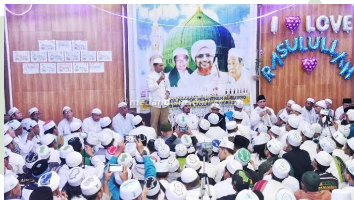
Gambar 4 : Dalam kegiatan menyambut hari lahirnya Nabi Muhammad SAW di ponpes Al Busyro. Pusat Majelis Taklim Darusshofa Medan.