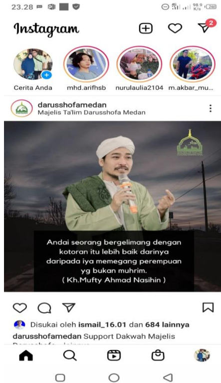
Gambar 11 : Foto diatas menunjukkan bahwa berdakwah tidak hanya melalui bil lisa saja, tetapi bisa secara bil qalam yaitu berdakwah melalui sebuah tulisan atau postingan