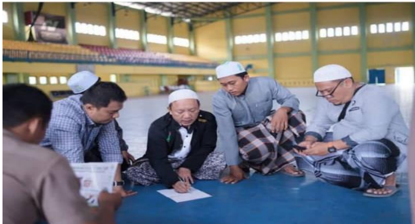
Gambar 3 : tampak dilihat gambar di atas, ketua majelis taklim melakukan rapat bersama untuk mengenai event besar dalam acara tabligh akbar dan memperingati maulid