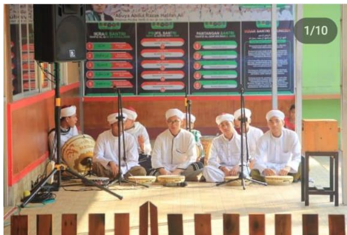
Gambar 8 : foto ini pada saat pemain hadroh telah selesai bersholawat dengan menggunakan rebana dalam kegiatan berjalan nya majelis taklim.