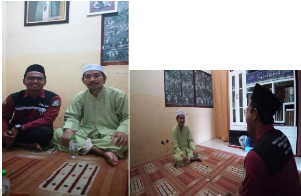
Gambar 13 : Foto pada saat di rumah informan, wawancara dengan pimpinan Majelis Taklim Darusshofa Medan. Dalam membahas sejarah dan tantangan dalam hal berdakwah