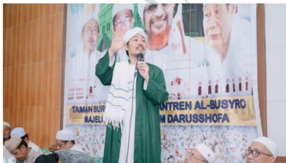
Gambar 9 : Foto ini di ambil atas bahwa Majelis Taklim Darusshofa medan menggunakan dalam berdakwah bil lisan yang artinya berceramah didepan para jamaah