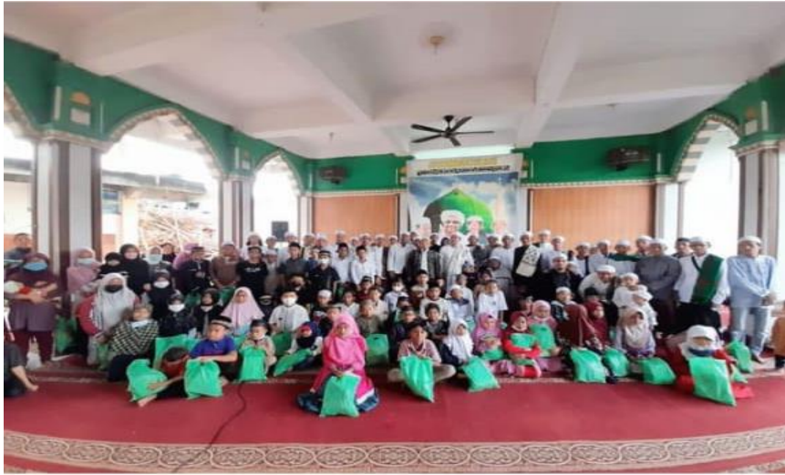
Gambar 6 : Foto dalam kegiatan sosial yaitu santunan anak yatim dan fakir miskin. Yang diadakan dipusat Majelis Taklim Darusshofa Medan.