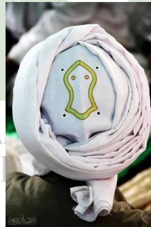
Gambar 2 : Dapat dilihat, Majelis Taklim Darusshofa Medan memiliki baju khusus untuk berdakwah. Agar untuk menarik minat jamaah, yang diutamakan adalah para pemuda.