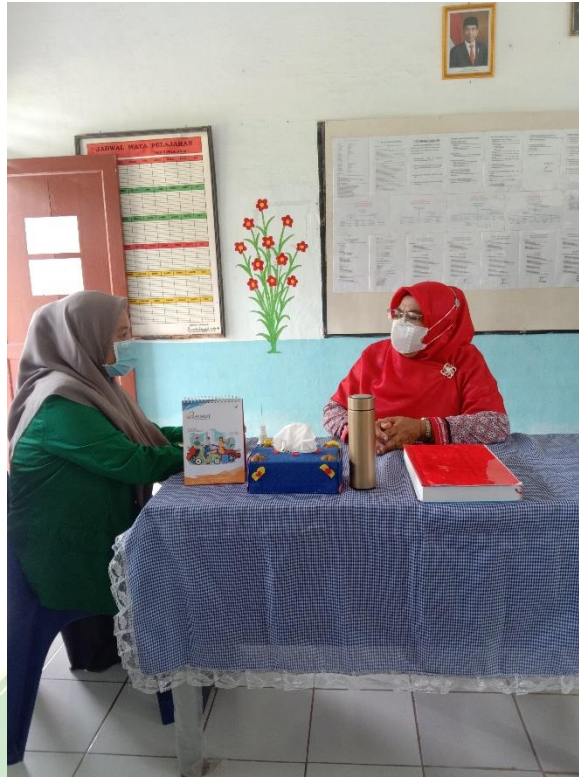
Foto dengan wali kelas IV SDN 091601