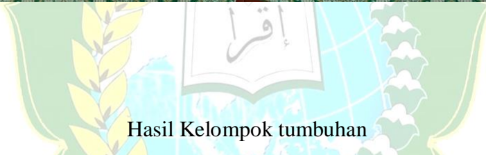
Hasil Kelompok tumbuhan