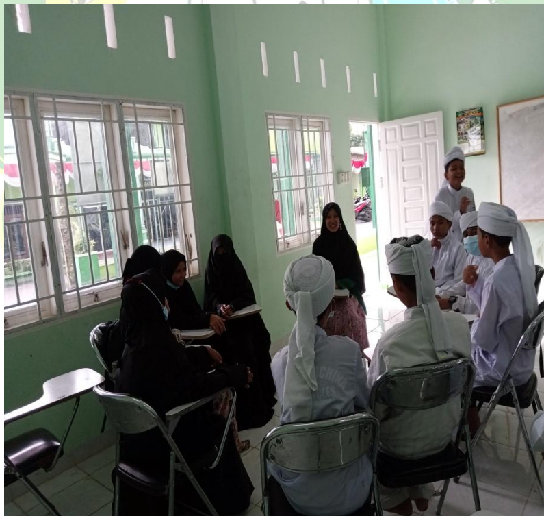
Layanan Bimbingan Kelompok