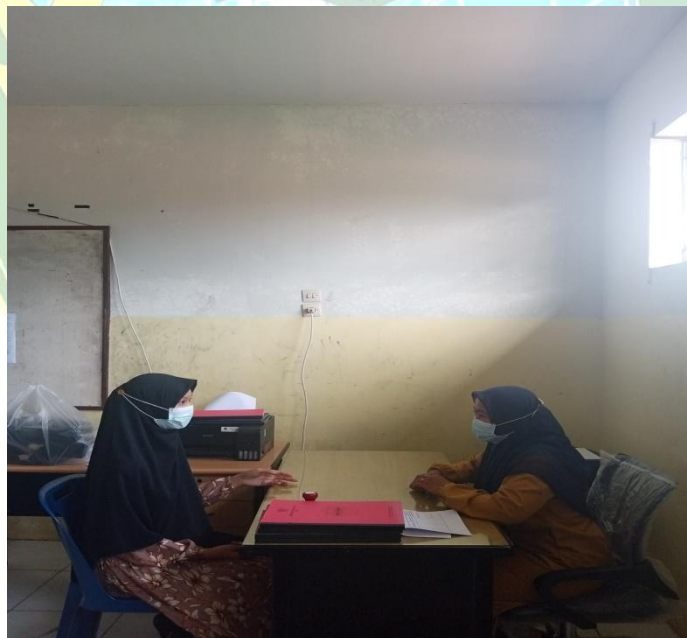
Wawancara Guru BK