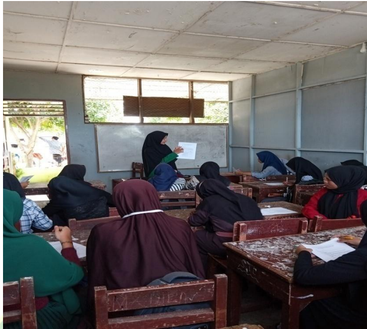
Uji Validitas Angket