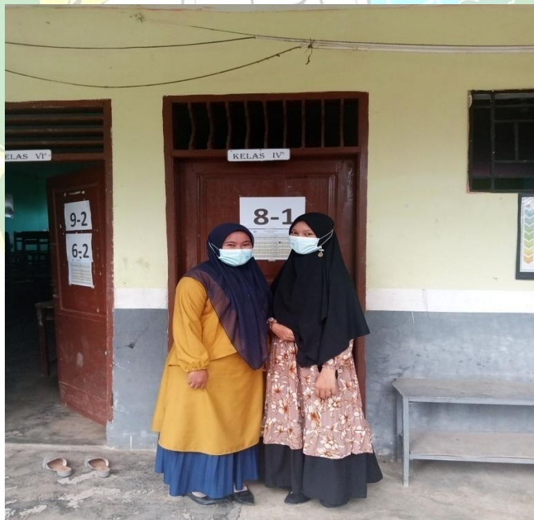
Foto Bersama Guru BK