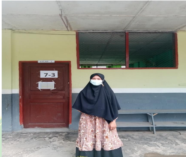
Sekolah SMP IT Ar-Rasyid, Kec. Tanjung Morawa