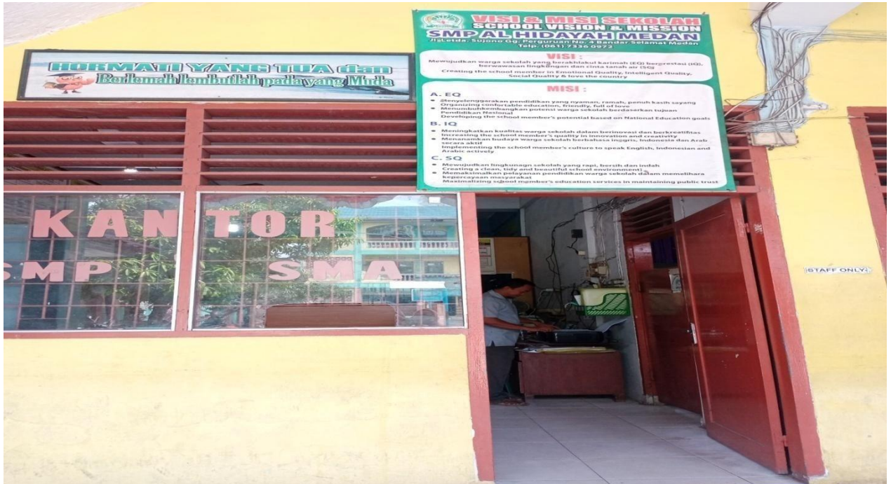
Gambar 5 : Kantor Yayasan Perguruan SMP Al-Hidayah