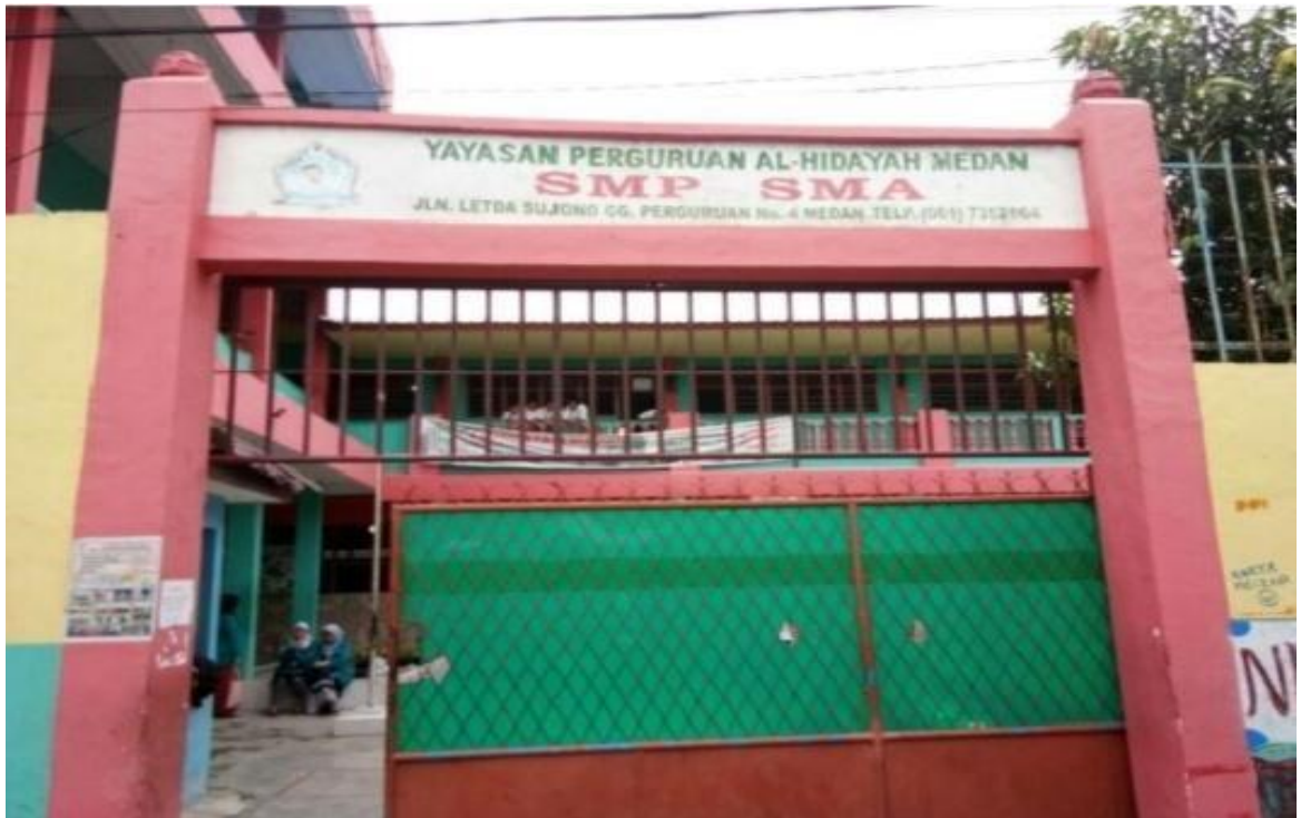
Gambar 1 : Lingkungan Luar Sekolah Yayasan Perguruan SMP Al-Hidayah Medan Tembung