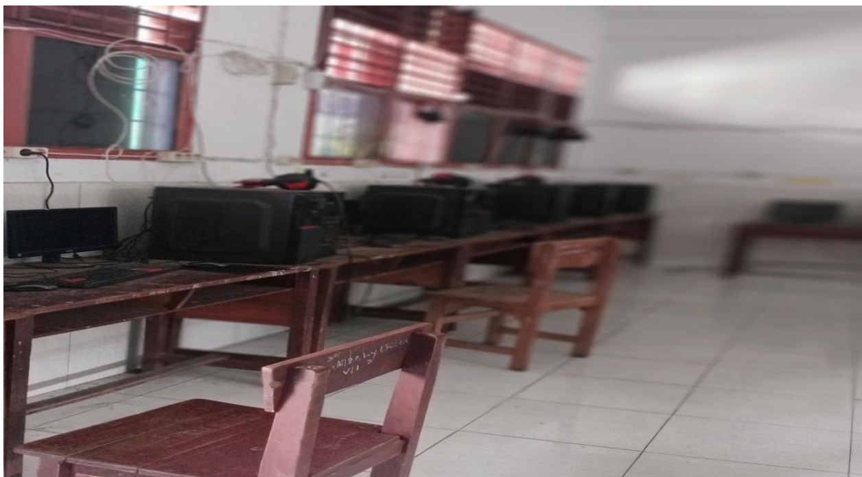
Gambar 7 : Ruang Lab Komputer