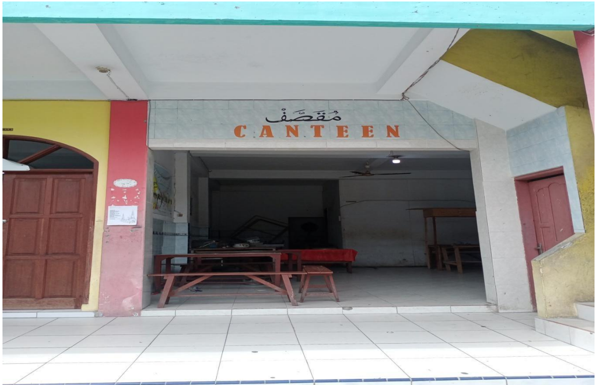
Gambar 3 : Kantin Sekolah Yayasan Perguruan SMP Al-Hidayah