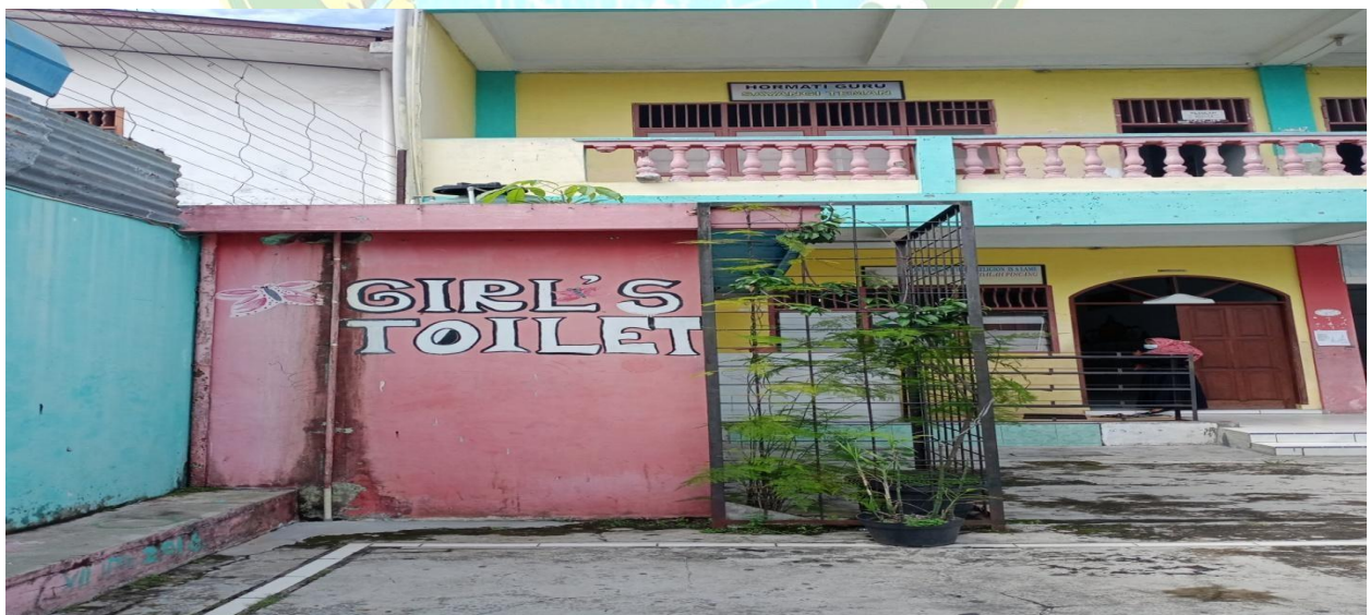
Gambar 6 : Toilet Siswa