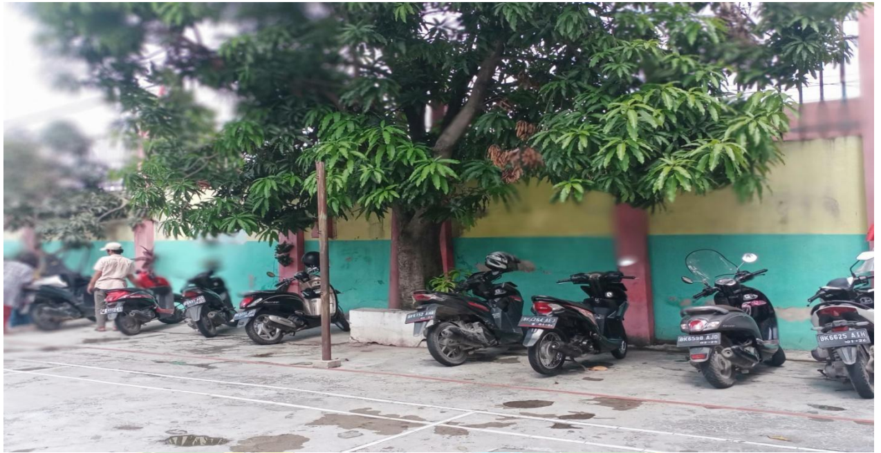
Gambar 7 : Tempat Parkir