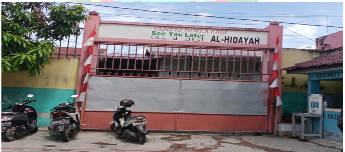
Gambar 2 : Gerbang Depan Yayasan Perguruan SMP Al-Hidayah