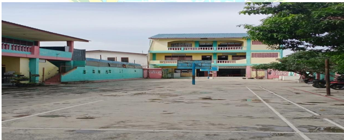
Gambar 4 : Lingkungan Sekolah Yayasan Perguruan SMP Al-Hidayah