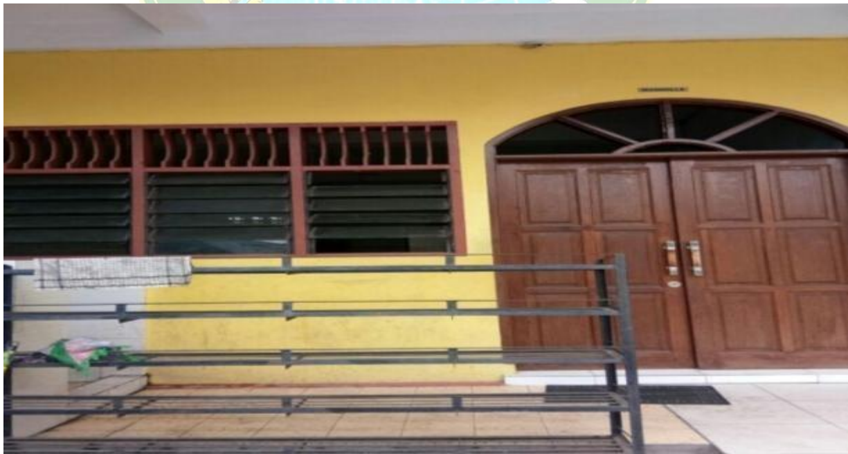
Gambar 6 : Ruang Shalat