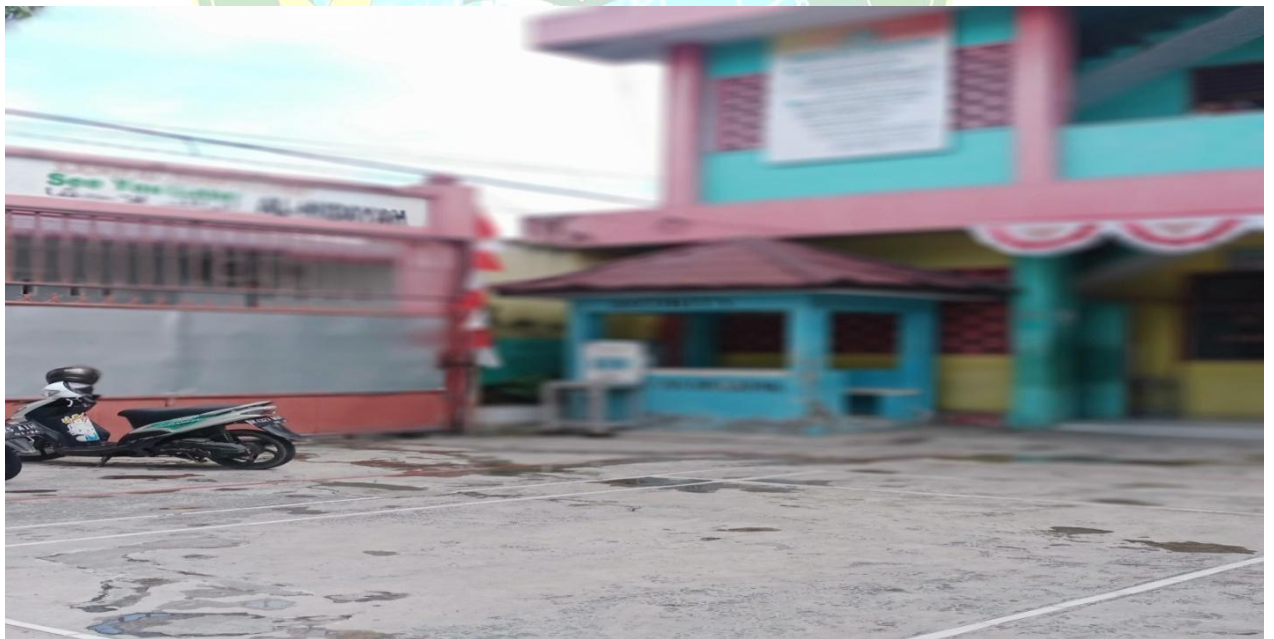
Gambar 8 : post satpam