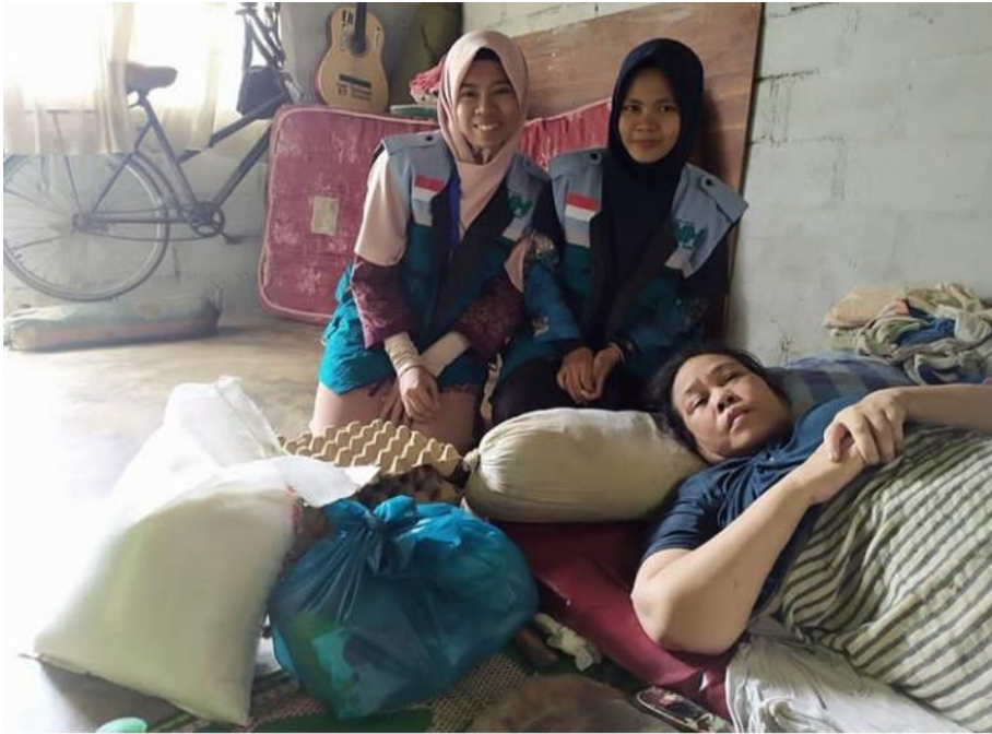
Kegiatan Bantuan Sosial