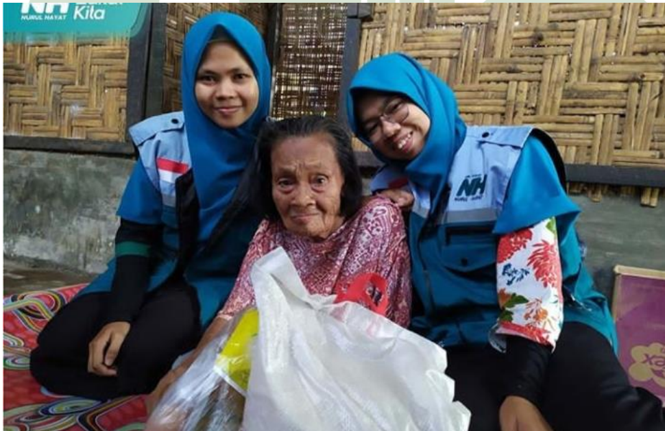
Kegiatan Bantuan Janda Dhuafa