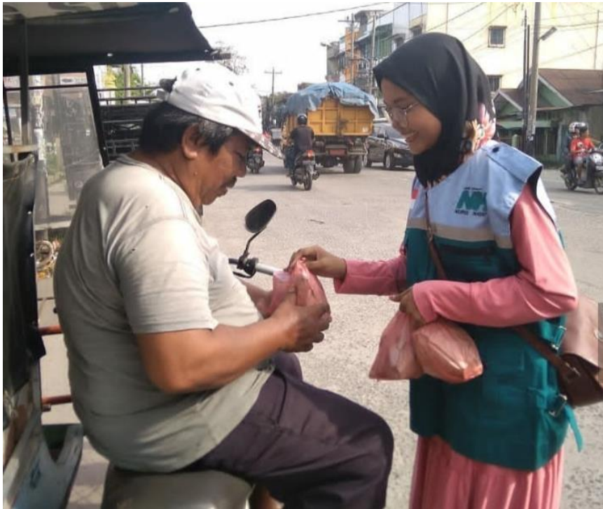
Kegiatan Santri Ganpres