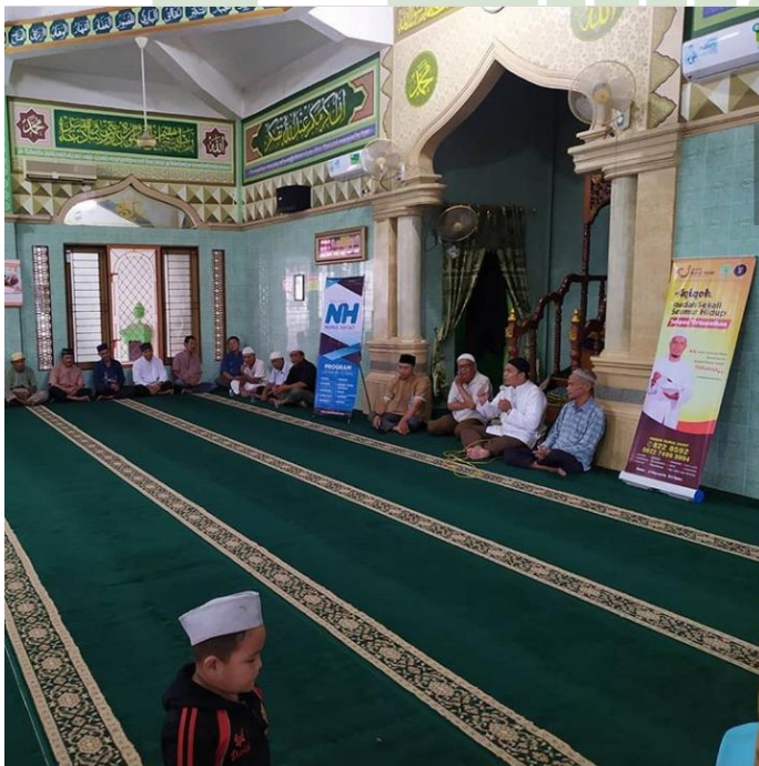
Kegiatan Kajian Sabtu Dhuha