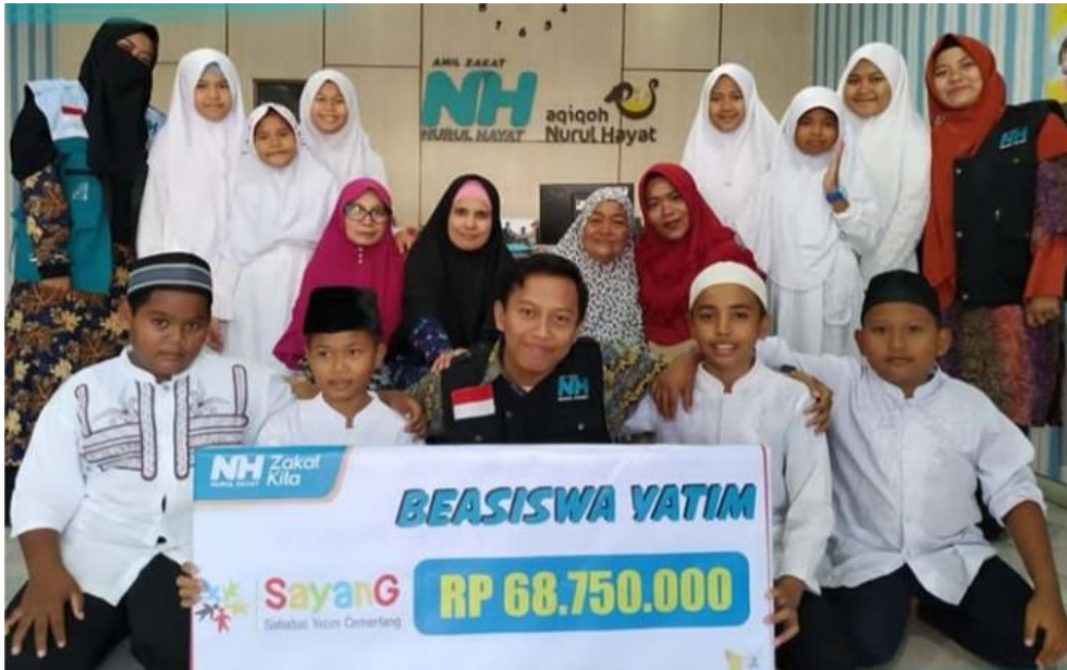
Kegiatan Beasiswa Yatim