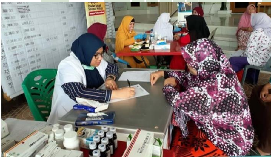
Kegiatan Praktik Medis Sosial