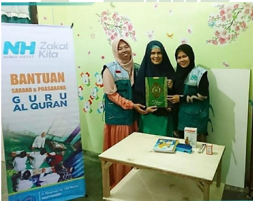
Kegiatan Bantuan Sarana dan Prasarana Guru Al-Qur'an