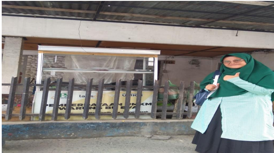
Gambar 5: foto bantuan dari LAZISMU yaitu berupa steling dan spanduk.