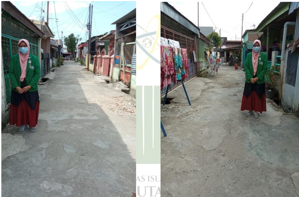
Foto dilokasi observasi di Daerah Kelurahan Kenangan Baru Kecamatan Percut Sei Tuan.